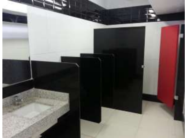
Ginásio Togo Renan Soares