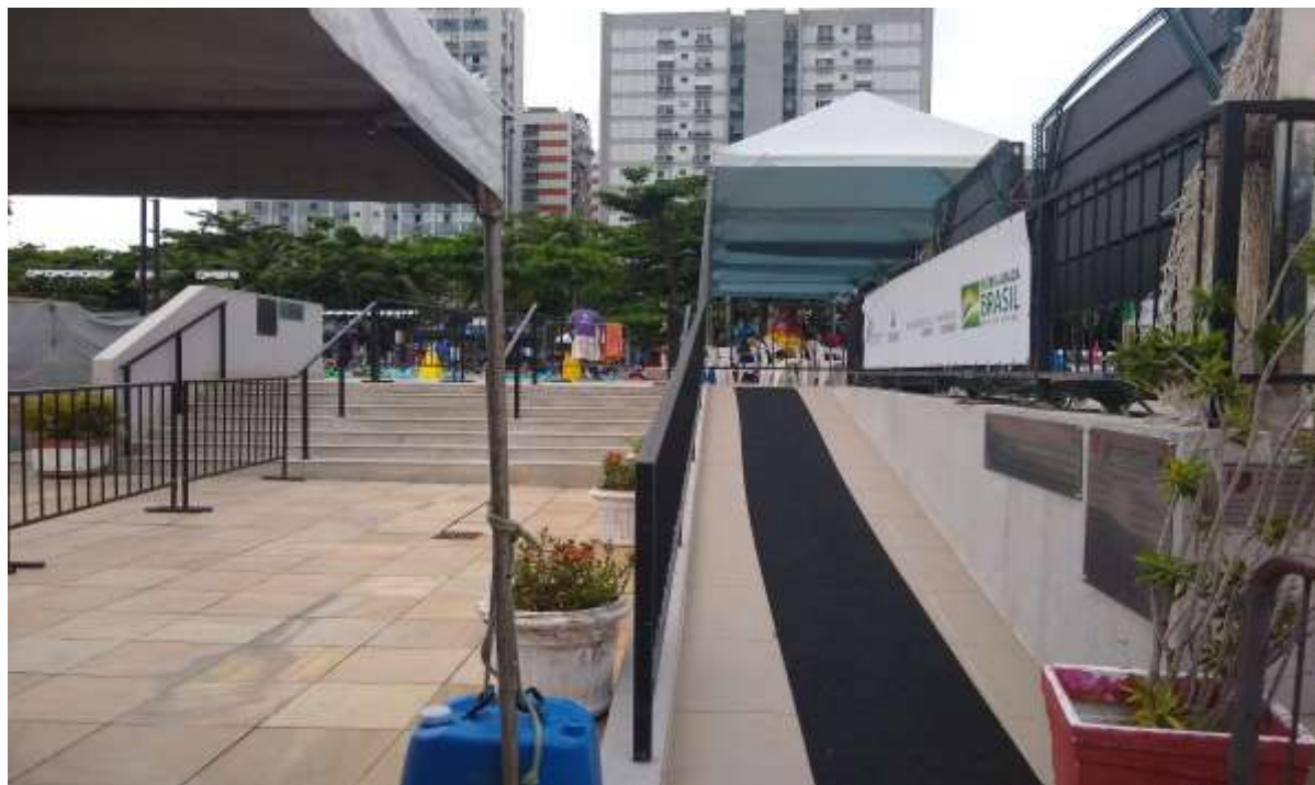
Rampa de acesso ao parque aquático