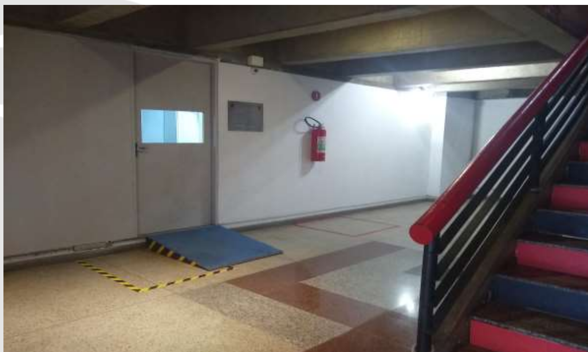
Rampa de Acesso a área administrativa do clube