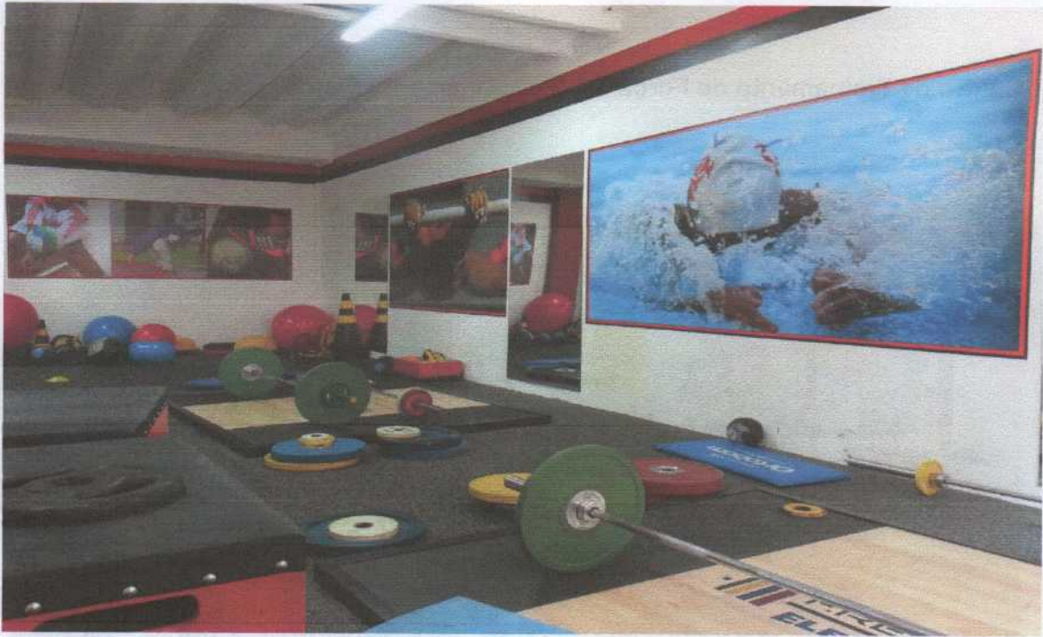
Ginásio Togo Renan Soares – Voleibol