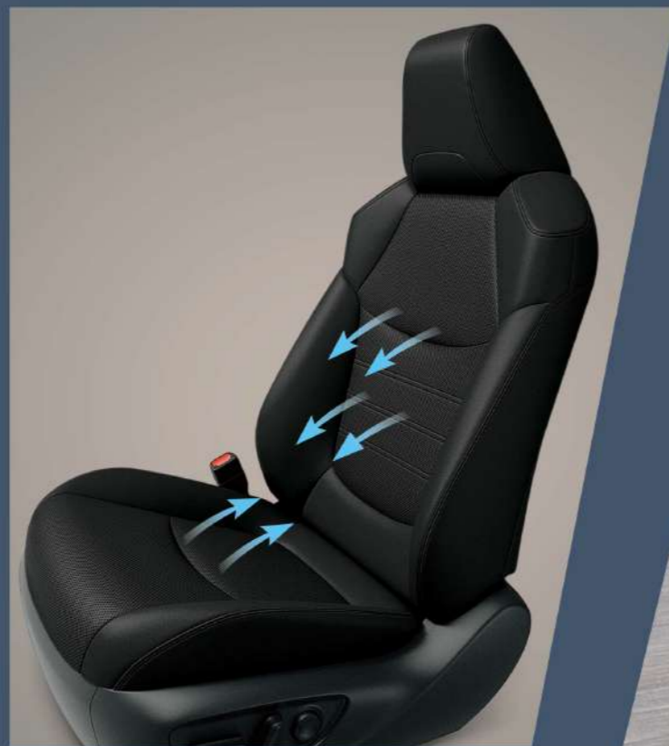
■ 雙前座通風座椅 (2.5 HYBRID 旗艦以上)