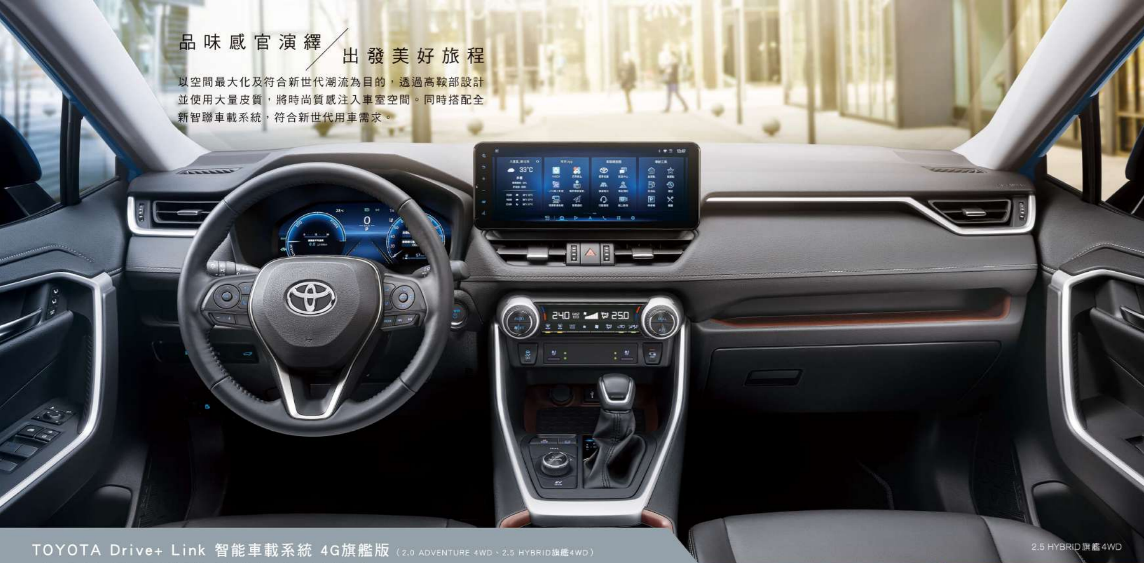
TOYOTA Drive+ Link 智能車載系統 4G旗艦版 (2.0 ADVENTURE 4WD、2.5 HYBRID 旗艦4WD)

以空間最大化及符合新世代潮流為目的，透過高鞍部設計並使用大量皮質，將時尚質感注入車室空間。同時搭配全新智聯車載系統，符合新世代用車需求。