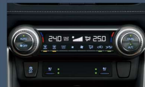
■ S-Flow 智慧型雙區恆溫控制空調系統 (2.0 尊爵以上)