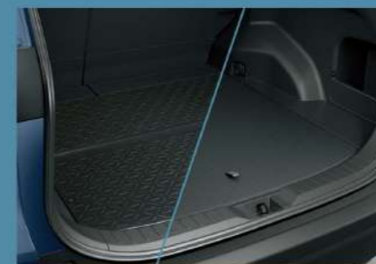
■ 雙面使用行李廂底板