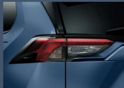
■ LED 光條式尾燈組