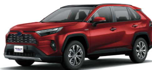
* 躍動紅 3T3