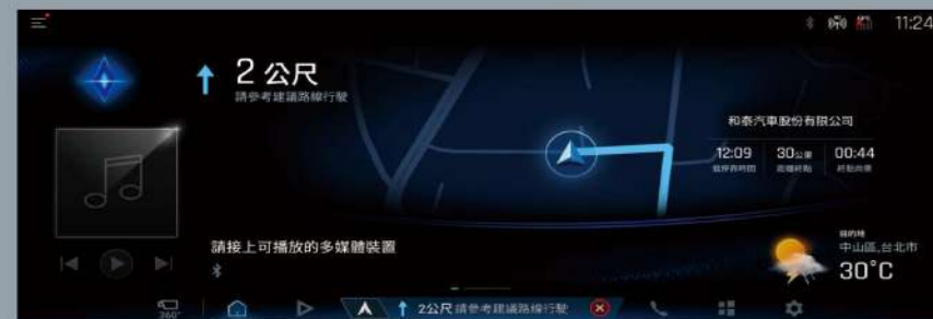
■ 12.3吋高解析度螢幕 (2.0 旗艦以上)