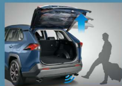
■ 足踢感應式電動尾門 (2.0 旗艦以上)