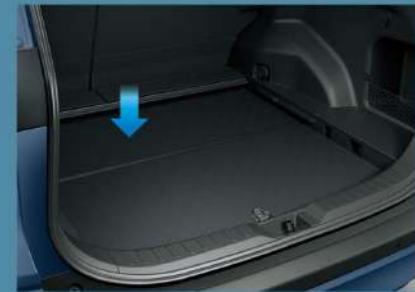
■ 上下可調式行李廂底板