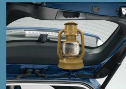
■ 多功能尾門握把/掛勾