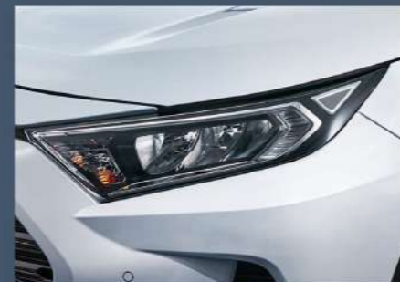
■ LED 反射式頭燈組 (汽油車型)