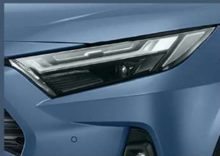
■ LED Bi-Beam 頭燈組 (HYBRID 車型)