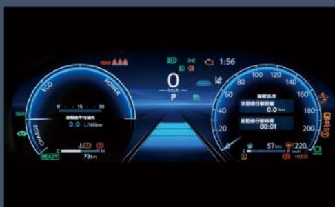
■ 12.3吋全彩數位式儀錶板 附 MID (2.0 尊爵以上、2.5 HYBRID 尊爵除外)