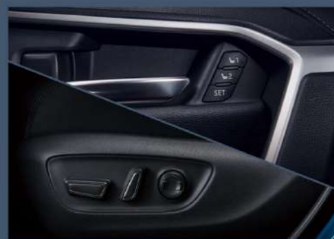
■ 電動座椅附記憶功能 (2.0 尊爵、2.0 旗艦、2.5 HYBRID 旗艦以上)