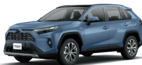
* 石漠藍 8W2