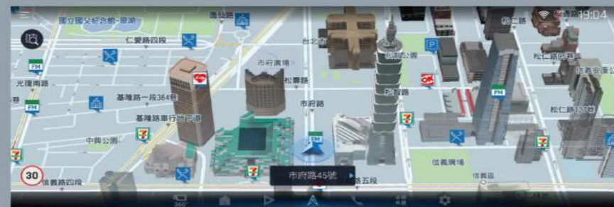
■ 智慧導航 (2.0 ADVENTURE 4WD、2.5 HYBRID 旗艦4WD)

12.3吋大螢幕，搭配Drive+ Link 智能車載系統4G旗艦版六大核心功能，行車資訊all-in-one，提供即時路況、手機預約導航等功能，影音體驗再升級。