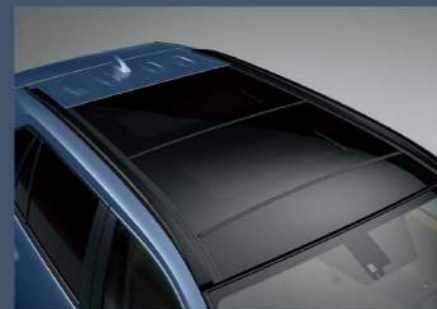
■ 全景式電動天窗 (2.0 ADVENTURE 4WD、2.5 HYBRID 旗艦 4WD)