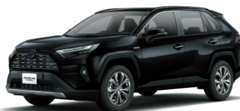
* 尊爵黑 218