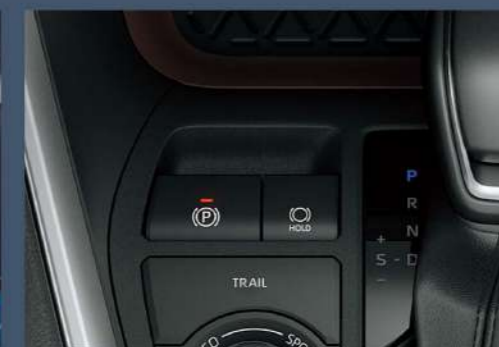
■ EPB 電子駐車煞車系統 (附 Auto Hold 功能)