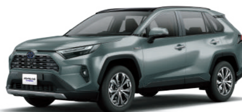
* 月岩綠 6X3