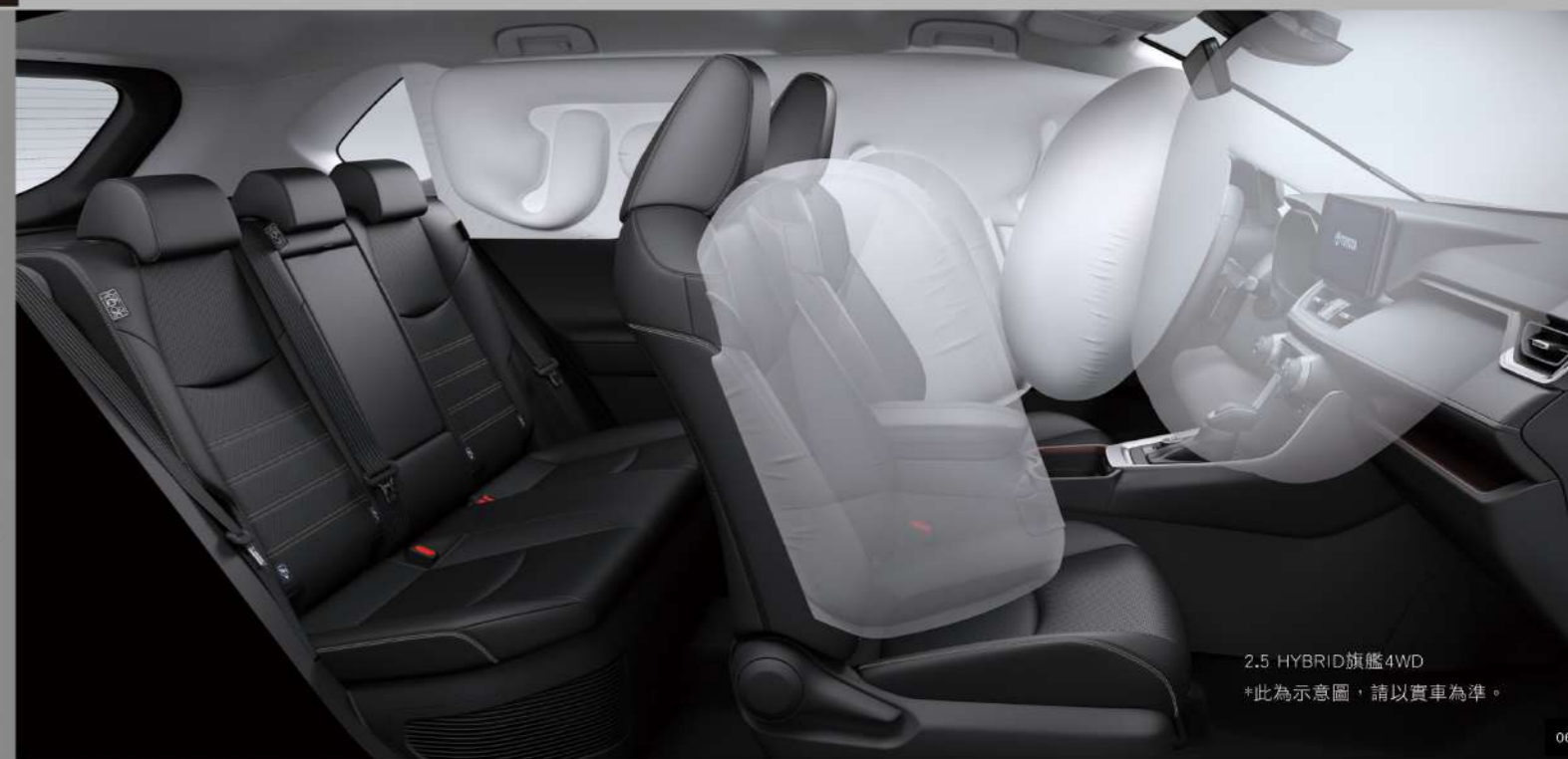
2.5 HYBRID旗艦4WD *此為示意圖，請以實車為準。