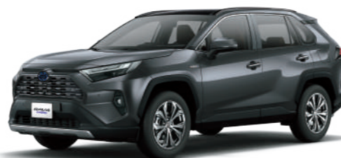
* 雲河灰 1G3