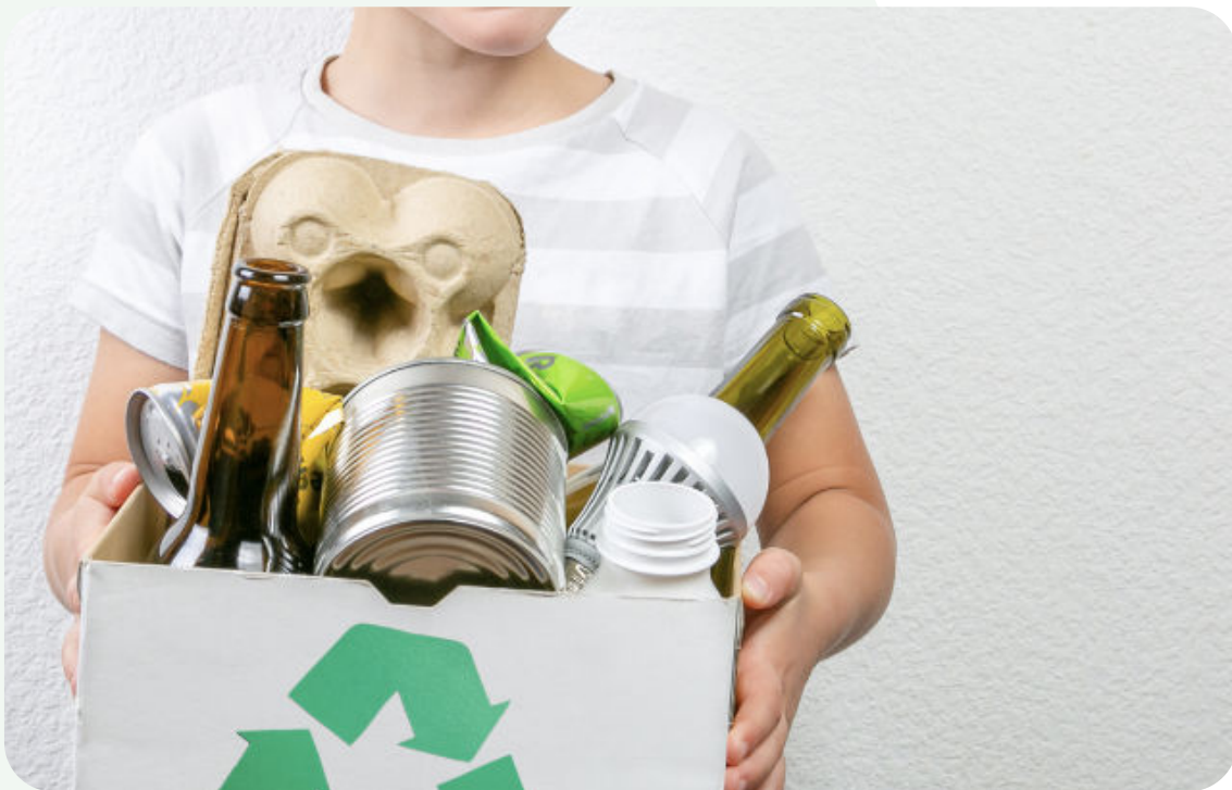
De focus moet verschuiven van recycling naar een lagere grondstoffenconsumptie.

Om de druk op onze kostbare grondstoffen te verlagen, zet RNB in op circulaire systemen en preventie. Door minder producten op de markt te brengen en er zuiniger mee om te springen, kunnen we het volledige productie- en consumptiesysteem verduurzamen. Onder de vlag van Het Groene Brein, schrijven we in 2022 samen met vooraanstaande Nederlandse academici een voorstel voor circulaire doelstellingen .