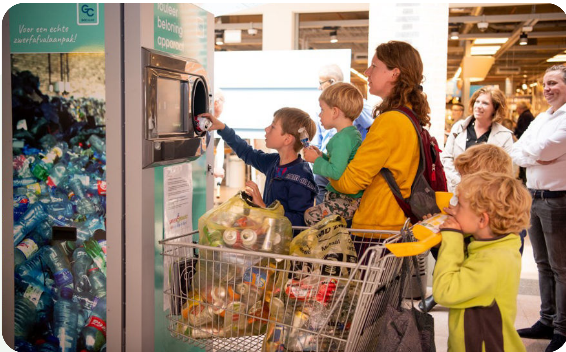
Het bedrijfsleven probeert de retour van het statiegeldblikjes uit de supermarkten te houden. RNB komt in actie tegen het klantvriendelijk plan.