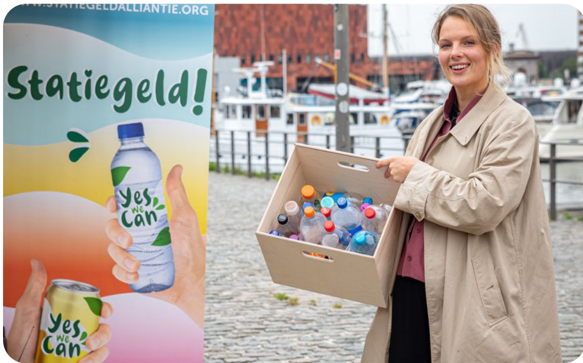
Meer dan 60 procent van de Belgische steden en gemeenten hebben zich aangesloten bij de Statiegeldalliantie.

ven ze de eis om statiegeld zo snel mogelijk in te voeren. De maatregel staat ook al sinds 2019 in het Brusselse én Waalse regeerakkoord.