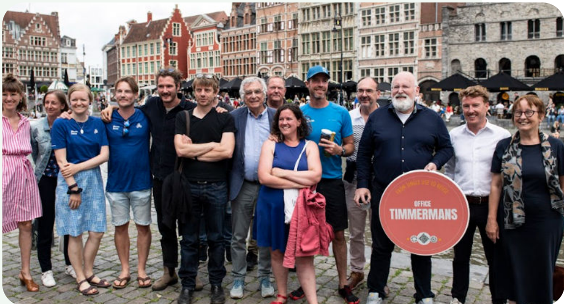
De Plastic Soup Surfer stopt in Gent voor een ontmoeting met Eurocomissaris Timmermans, Gentse en Vlaamse beleidsmakers en lokale impactondernemers.

In Gent en Leuven zetten we Kombak in de steigers, een project met herbruikbaar cateringmateriaal voor afhaal- en bezorgmaaltijden. We onderzoeken in beide studentensteden wat een gebruiksvriendelijk alternatief kan zijn voor vervuilende wegwerpbakjes. We werken hiervoor samen met de Stad Leuven en de Gentse afvalintercommunale Ivago. Het project maakt deel uit van de Green Deal Anders Verpakt van de Vlaamse Overheid en de resultaten worden gedeeld binnen het Europese Reuse Vanguard Project (RSVP) . De RSVP projecten in 5 verschillende landen worden gebruikt als basis om een blauwdruk te ontwikkelen voor hergebruik in Europa.