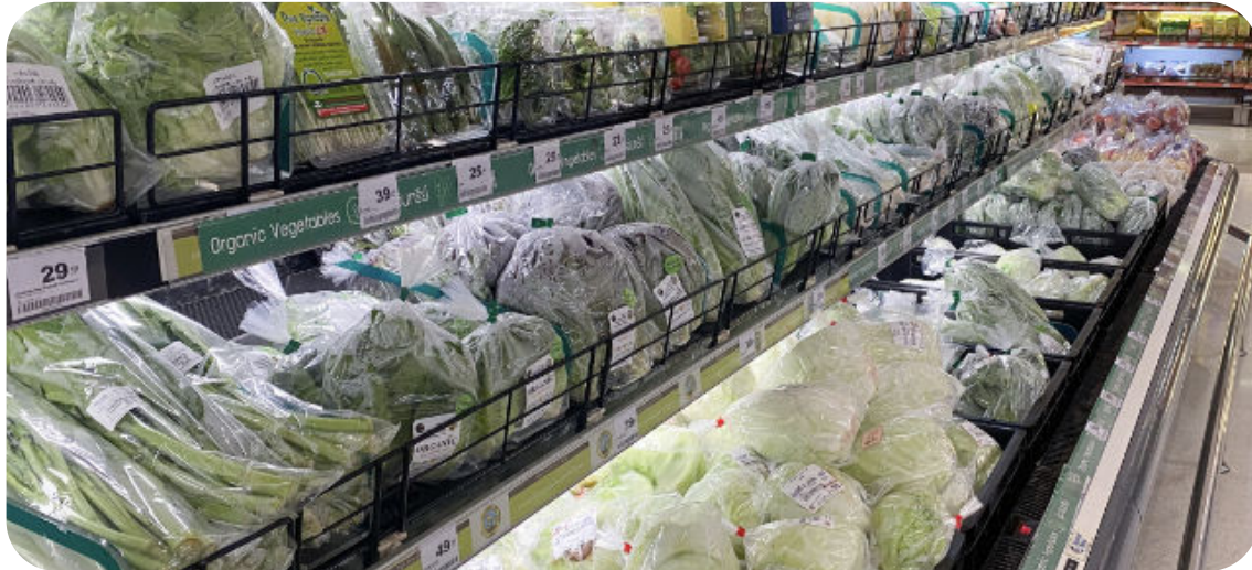
Hoe verlossen we onze groenten en fruit van alle plastic folie?

In opdracht van de Nederlandse overheid hebben we dit jaar ook onderzocht hoe de verpakkingen bij groenten en fruit verminderd kunnen worden. Het rapport besteedt vanuit systeemperspectief aandacht aan de voor- en nadelen van verpakkingen en bevat een afwegingskader voor het uitfaseren van plastic wegverpakkingen. Dit rapport leidde tot een stemming in de Tweede Kamer over een uitfaseringsplan.