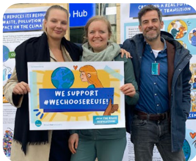
We Choose Reuse campagne tijdens de Brussels week of Action.

Uit ons onderzoek blijkt dat de consument herbruikbare verpakkingen verkiest boven wegwerp . Maar in veel situaties is wegwerp nog steeds de enige optie. Daarom vragen we burgers om onze oproep voor meer hergebruik te steunen. Samen met onze partners verzamelen we meer dan 100.000 handtekeningen voor We Choose Reuse . Ze worden bij de Europese Commissie neergelegd tijdens de Brussels Week of Action.