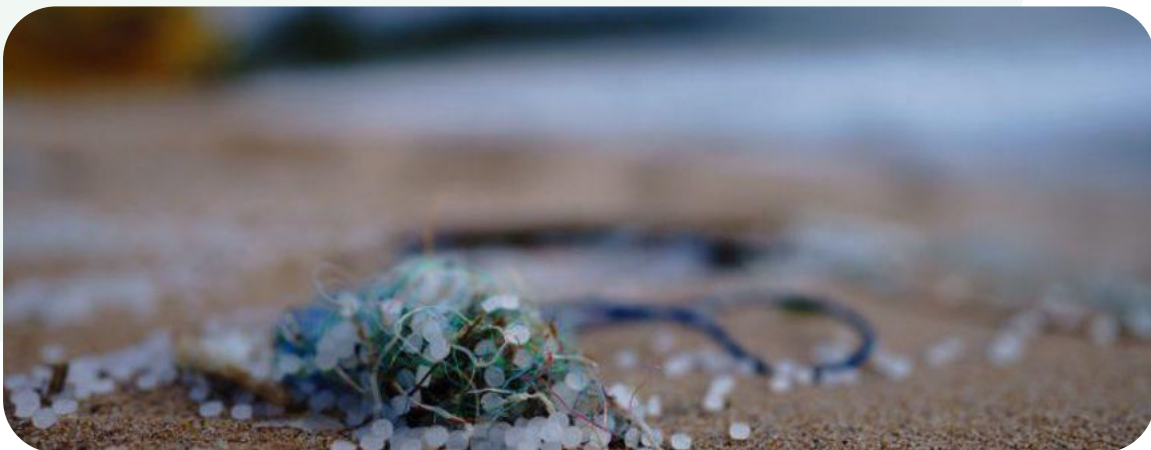
Europese Commissie wil verbod op producten met toegevoegde microplastics (bron ?)

Plastic is veel te goedkoop, wat zorgt voor overproductie en onnodige verpakkingen. Het is een veelgebruikt maar gevaarlijk materiaal dat als zwerfvuil traag afbreekt en verkrumelt in giftige microplas-