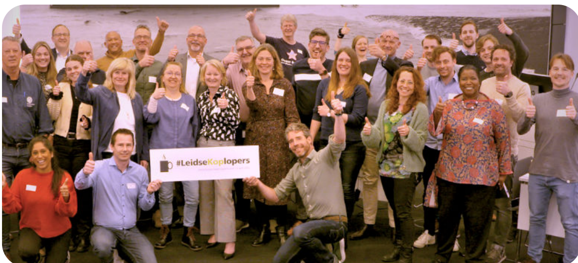
Samen met de Gemeente Leiden ondersteunen we ondernemers in hun transitie van wegwerp naar herbruikbare bekervan.

Met Mission Reuse streven we al jaren om de switch van wegwerp naar hergebruik te versnellen. In 2022 introduceren we herbruikbare bekervan op universiteiten en experimenteren we op festivals met herbruikbaar servies . Daarnaast onderzoeken we hoe we herbruikbare verpakkingen zo efficiënt mogelijk kunnen afwassen op grote schaal . Al deze kennis en ervaring delen we binnen ons sterk Europees netwerk en helpen ons om gefundeerde beleidsaanbevelingen te formuleren. De praktijkervaring zorgt er ook voor dat we een sterk weerwoord kunnen formuleren tegenover partijen die de haalbaarheid van hergebruik in twijfel trekken.