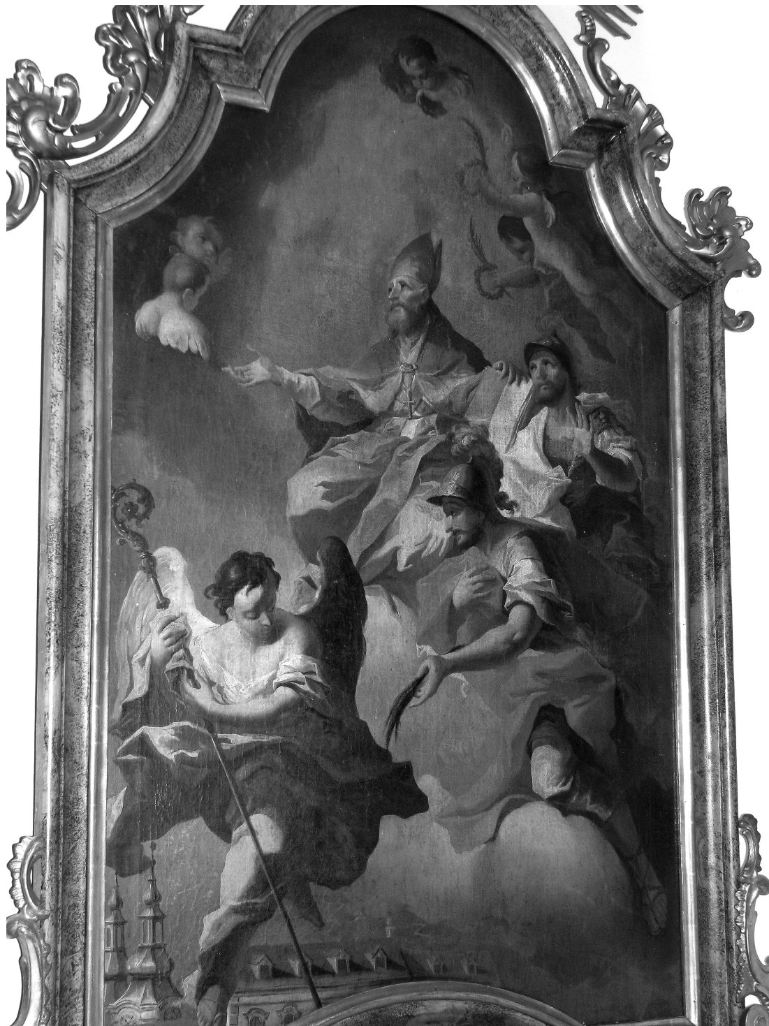
Obr. 6: Ignaz Mayer st., Sv. Augustin se sv. Janem a Pavlem , Lovčičky, kostel sv. Václava, boční oltář. Foto: Petr Ariječuk.

„DIESE STADT HATTE AUCH IN IHREN MAUERN IMMER BRAVE KÜNSTLER ALLER ART...“