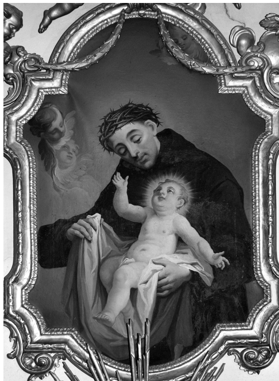
Obr. 4: Ignaz Mayer st., Sv. Jan z Boha , Vizovice, zámecká kaple Panny Marie Dobré rady, boční oltář.

jí. 43 Oprávněný poukaz na určité nedostatky v projevu však nyní můžeme vnímat, s náležením další dosud neznámé realizace téže kompozice, přeci jen v jiných souvislostech.