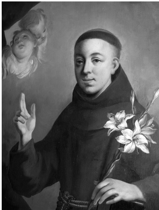
Obr. 5: Ignaz Mayer st., Sv. Antonín Paduánský, detail, Jimramov, kostel Narození Panny Marie, boční oltář.

Výše zmíněné obrazy Křížové cesty, zavěšené po obvodu kaple, jsou ve svém výrazovém projevu i v utváření detailů natolik shodné s ostatními Mayerovi připsanými obrazy, že ani o jejich autorství není třeba pochybovat. Nezodpovězena tak zůstane pouze otázka stran doby jejich vzniku. Některá zastavení přesvědčivě pracují s malým počtem zúčastněných postav, jiná, povětšinou četněji zaplněné kompozice, působí ve srovnání s před-