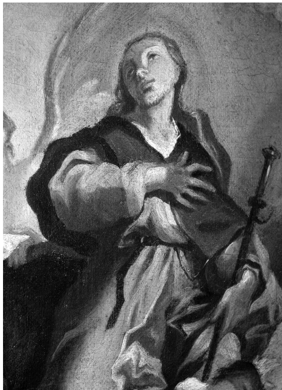
Obr. 1: Ignaz Mayer st., Apoteóza sv. Jakuba Většího, skica, detail, Bratislava, Slovenská národní galerie.

Podíl Sterna, Korompaye a Rottera na výzdobě brněnských kostelů, ať těch stojí-