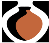
La Chamba Marca Colectiva