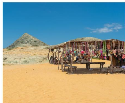
LA GUAJIRA RUTA TEJEDURÍA WAYÚU