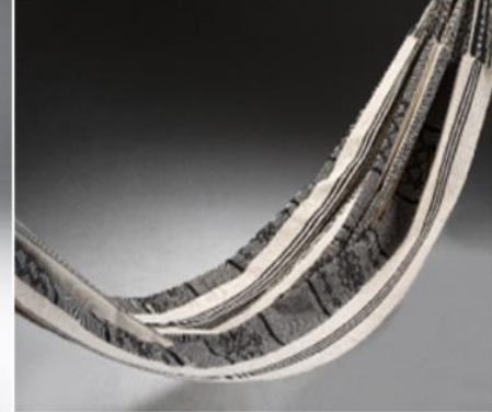
Tejeduría de San Jacinto