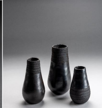
Cerámica Negra de La Chamba