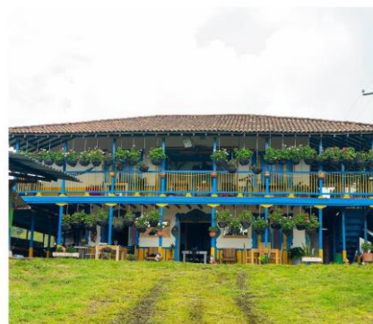
EJE CAFETERO RUTA DEL CAFÉ