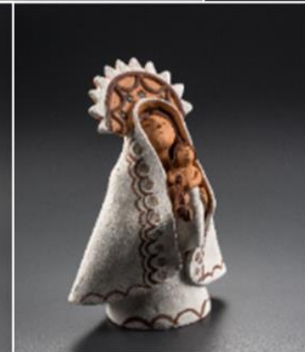
Cerámica de Ráquira