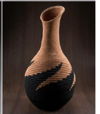
Cestería de Guacamayas