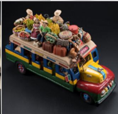
Chiva de Pitalito