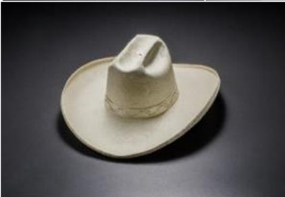
Sombrero de Suaza