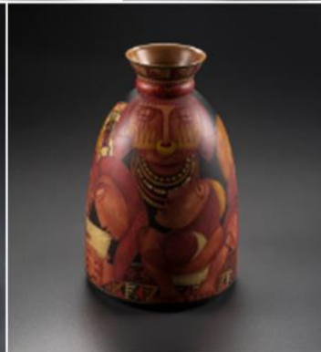
Barniz de Pasto