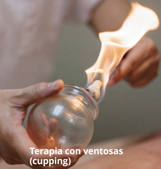
Terapia con ventosas (cupping)