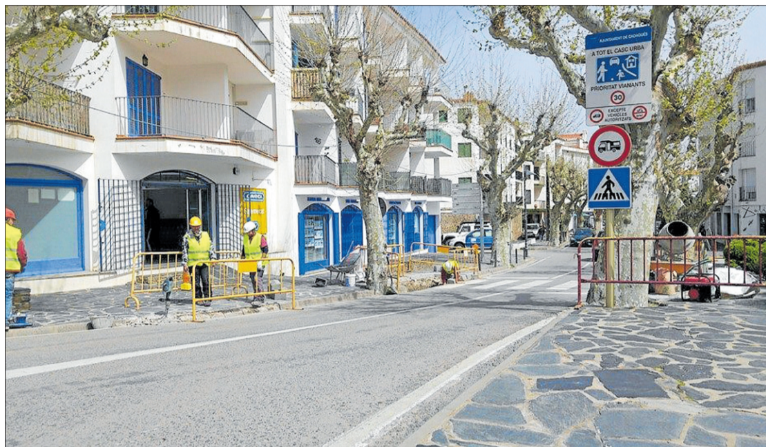
A Cadaqués, el metre quadrat d'un habitatge d'obra nova frega els 4.000 euros.

Els segueixen Castell-Platja d'Aro (s'hi van construir 73 habitatges nous l'any passat, a un preu/m 2 de 3.547 euros); Begur (dos habitatges a 3.487 euros/m 2 ); Tossa de Mar (5 habitatges a 3.279 euros/m 2 ); Palamós (43 habitatges a 3.160 euros/m 2 ); Llançà (16 habitatges a 3.154 euros/m 2 ) i Quart, on s'hi van edificar 13 cases unifamiliars que es paguen a