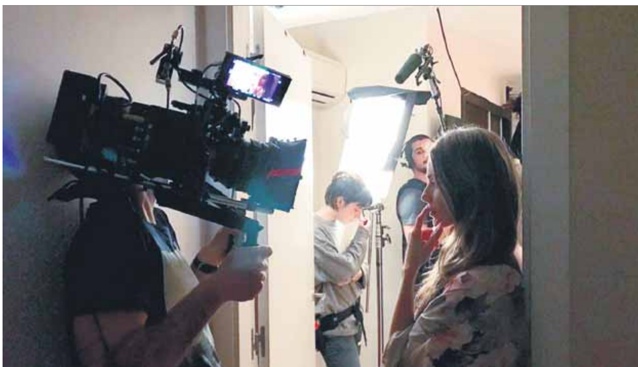
Un moment del rodatge a Barcelona, amb l'actriu Vanesa Romero ■ M.C.