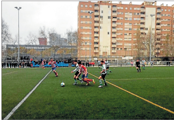
Una acció del partit d'ahir entre el Sants i el Girona B.