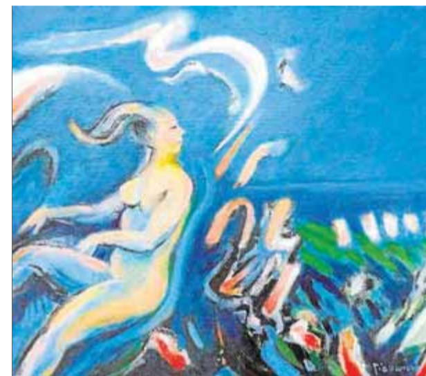
Una de les obres (fragment) que es pot veure a l'exposició col·lectiva de Castell d'Aro ■ AJUNTAMENT CASTELL-PLATJA D'ARO

■ La Fundació Jordi Comas coorganitza l'exposició, que es pot visitar fins a l'abril