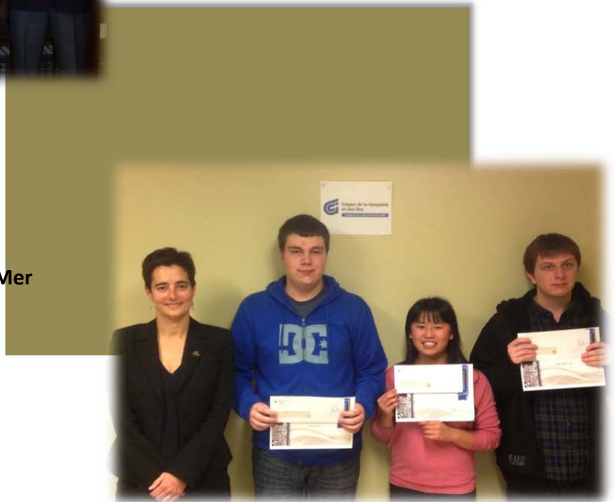
Réceptiendaires du campus de Carleton-sur-Mer