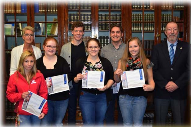
Réceptiendaires du campus de Gaspé