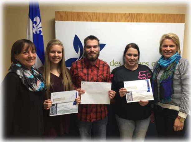
Réceptiendaires de l'ÉPAQ