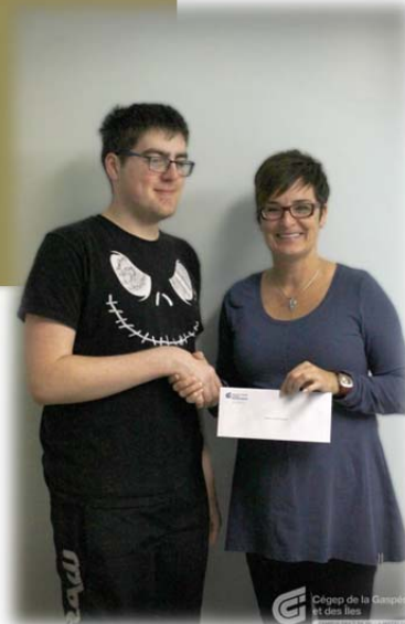
Campus des Îles

De plus, ce même partenariat nous a également permis de tenir, pour une deuxième année consécutive, des ateliers visant à sensibiliser les jeunes aux domaines d'études scientifiques et techniques. Le 'Centre des sciences de la Gaspésie' fut mandaté pour la réalisation de ces ateliers dans les campus.