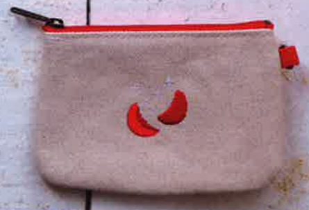
心願雙杯帆布散銀袋 82 港元 @ 來好 系列有不同台灣民俗小物，例如寺廟許願用的筊杯。