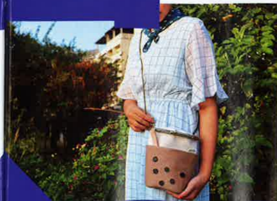
珍珠奶茶網眼圓筒 349 港元 @ little imperfection