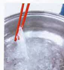
分開煮熟粉絲，加入鴨血即可。