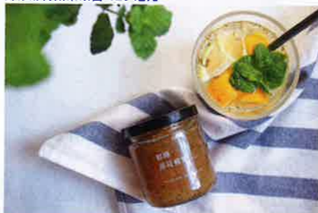
鮮檸薄荷蘋果果醬 120 港元

春季限定晚滴西亞橙果醬、冬季限定薄荷胡椒草莓各 120 港元 品牌不時推出季節限定，例如以經典草莓果醬，加入些許磨碎的七彩胡椒和薄荷葉，果甜中帶有嗆辣，味道有驚喜。