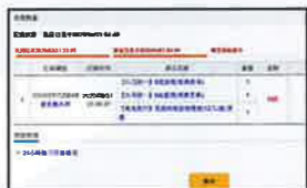
博客來平台的出貨進度清晰，抵讚！