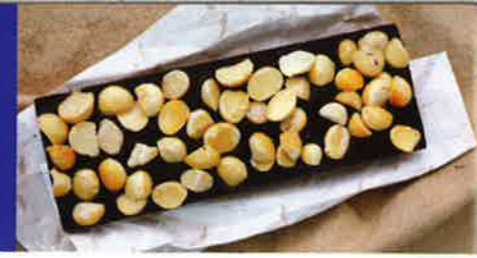
澳洲火山豆香脆清甜，配合濃厚純苦的巧克力，口感有層次。