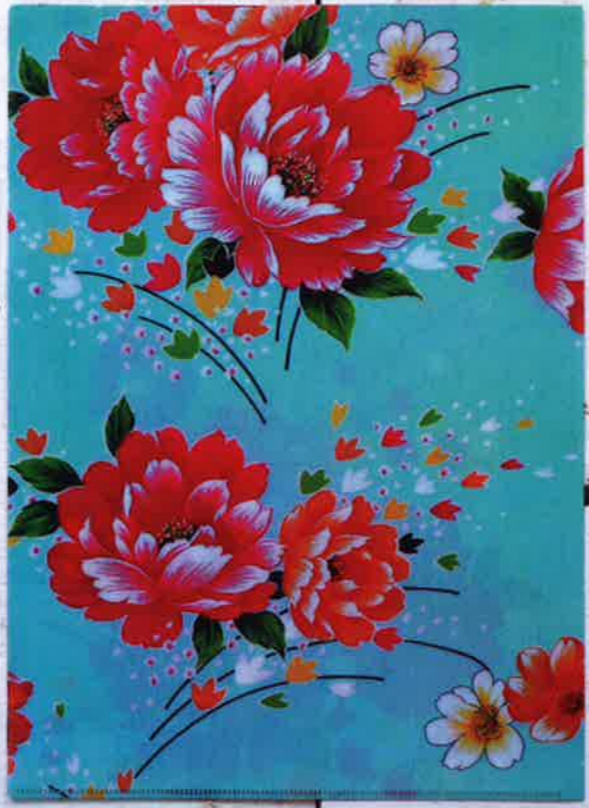
台灣水藍文件夾 @ 來好 華麗的牡丹花相當搶眼。