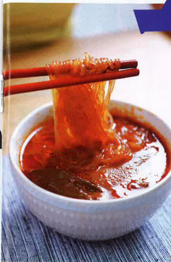
盒內已包含粉絲，質感爽彈，配合麻辣辣湯夠入味。

麻辣鴨血粉絲處理簡單，只需要隔水加熱調料包，不用 15 分鐘就食得。麻辣湯底以雞湯熬製，加入多款花椒、香料，夠辣勁，稍欠麻香。不過整體而言已經好驚喜，尤其是 3 大片飽滿的鴨血，滑嫩夠入味。在家中處理時更可以加入青菜、豆腐等，自製一人份的小火鍋過過癮。