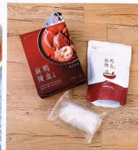
每盒包含 1 份粉絲、1 包麻辣調料包。