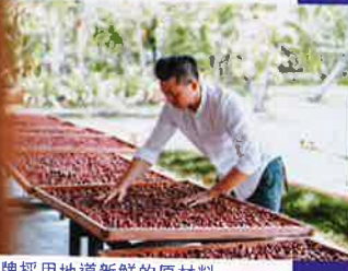
品牌採用地道新鮮的原材料，連發酵都由自家操作，大大保留朱古力的本土風味。