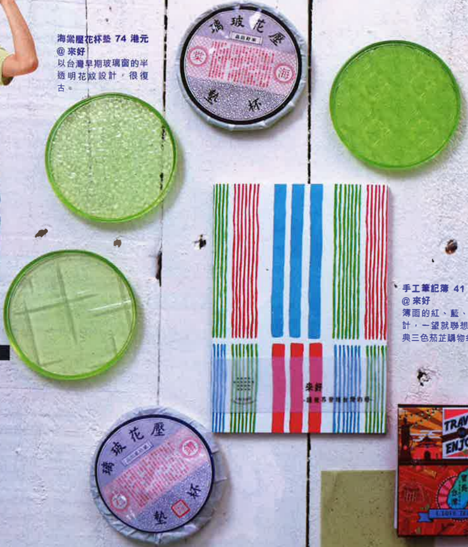
手工筆記簿 41 港元 @ 來好 薄面的紅、藍、綠設計，一望就聯想到經典三色茄芷購物袋。