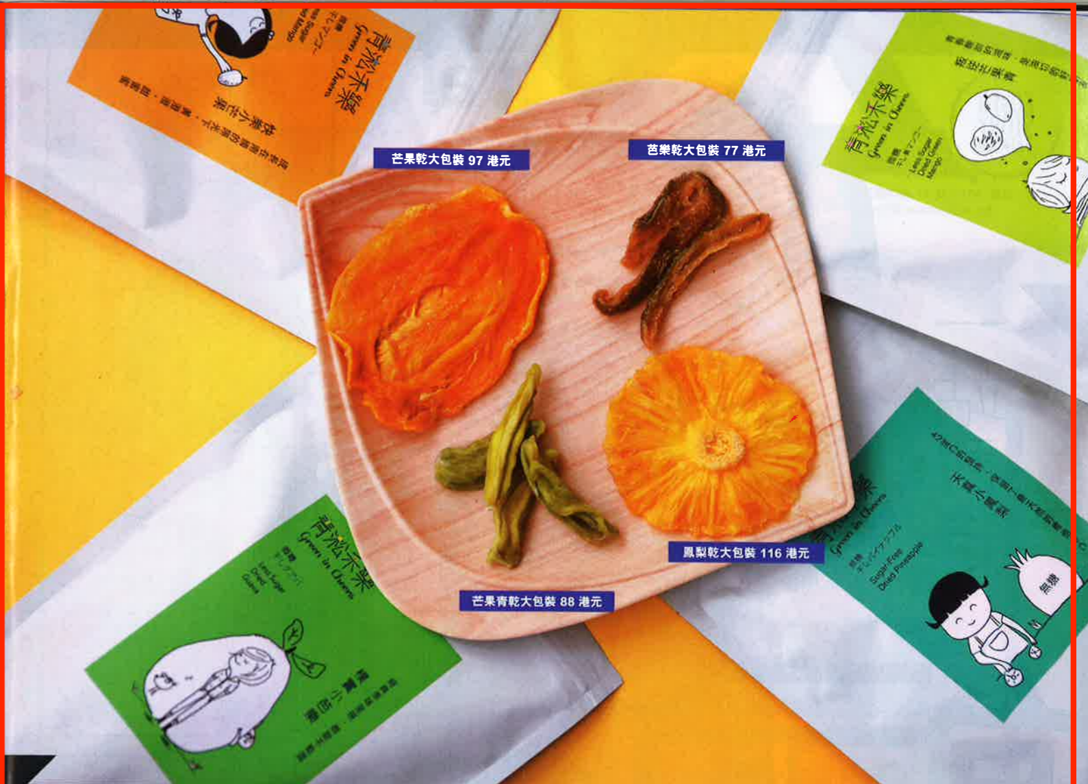
芒果乾大包裝 97 港元