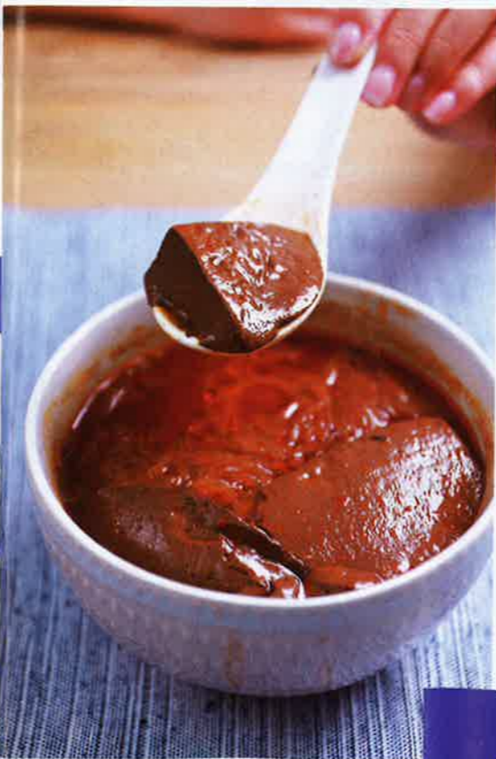
麻辣湯底濃郁夠辣，鴨血更是大大塊，非常入味，食落沒有渣。