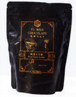
純黑可可粉 73 港元 100% 可可粉，不含砂糖、牛奶，熱量較低，即使女士亦可以放心飲多兩杯。

品牌中最受歡迎是曾奪得不少國際大獎的 62% 可可台灣一號，香氣豐盈，餘味悠久。品牌更運用許多台灣特色食材配搭，變化出不同款式，例如加入櫻花蝦、紅藜、鐵觀音等，口味獨特，很值得買來一試。