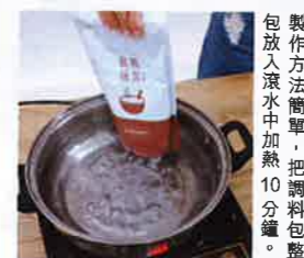
製作方法簡單，把調料包整包放入滾水中加熱 10 分鐘。