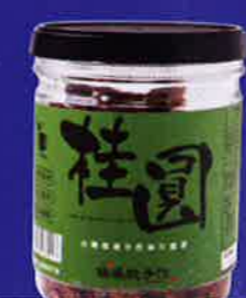
暖暖手作桂圓 104 港元 (購自: Pinkoi)