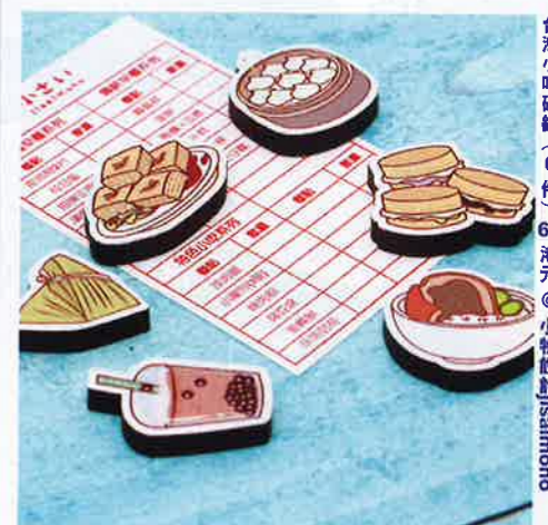
台灣小吃磁盤 (6 件) 60 港元 @ 小物設計 isamono