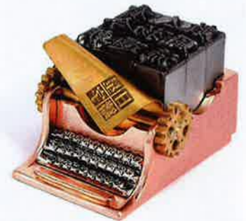
復古打字機客製化鉛字印章 371 港元 @ 日星鑄字行 獨特的鉛字印章在去年贏得台灣文博會最佳文創精品獎。

近年台灣的設計精品風格多元，可愛的、文青的，總有一款獨一無二的設計合你心意！講到手作設計販售平台，最為人熟悉的除了 Etsy 和 Creema，就是來自台灣本土的 Pinkoi 了。Etsy 以西方地區設計為主，Creema 則是日本職人的陣地，至於 Pinkoi，當然有最多台灣雜貨好物了。網站有超過 1 萬 3 千間設計館，文創精品、衣服鞋襪飾品等選擇多多，加上不時推出包郵費的優惠，隨時比在香港網購更划算。設計館之一「來好」，不止有自家品牌售賣具台灣代表性的精品，如磁鐵、明信片、吸油面紙、筆記簿、帽子、杯套、散銀包、tote bag 等，還搜羅超過 50 個台灣設計品牌。有時候只隨意逛一逛幾個設計館，購物車已滿有收穫！