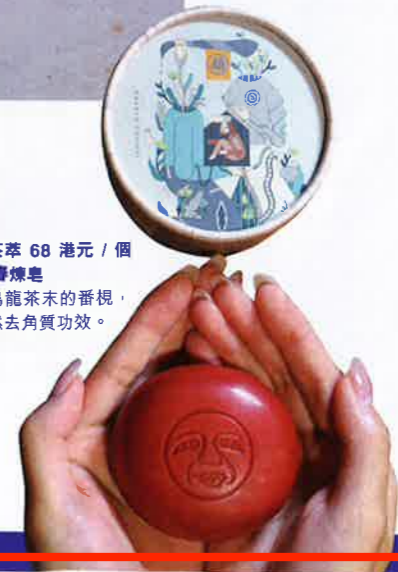
經典茶萃 68 港元 / 個 @ 大響煉皂 加入烏龍茶末的番視，有天然去角質功效。