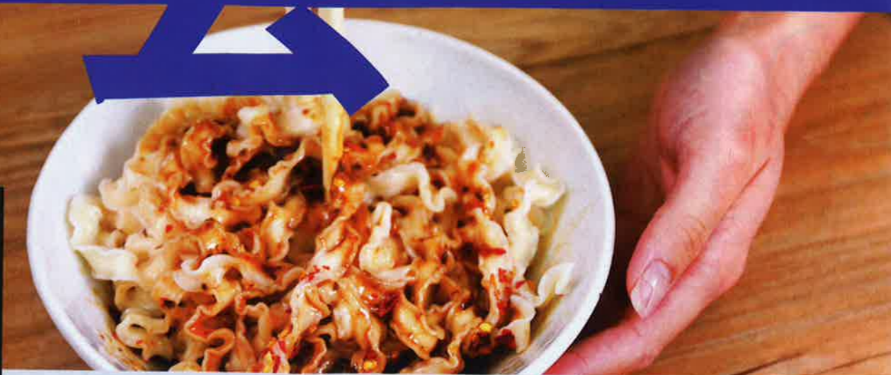
留意煮麵時間，時間太長麵身會失去嚼勁；如果不能吃得太辣，亦可以慢慢拌入調料包。