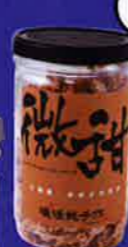
暖暖手作微糖黑糖 104 港元 (購自: Pinkoi)