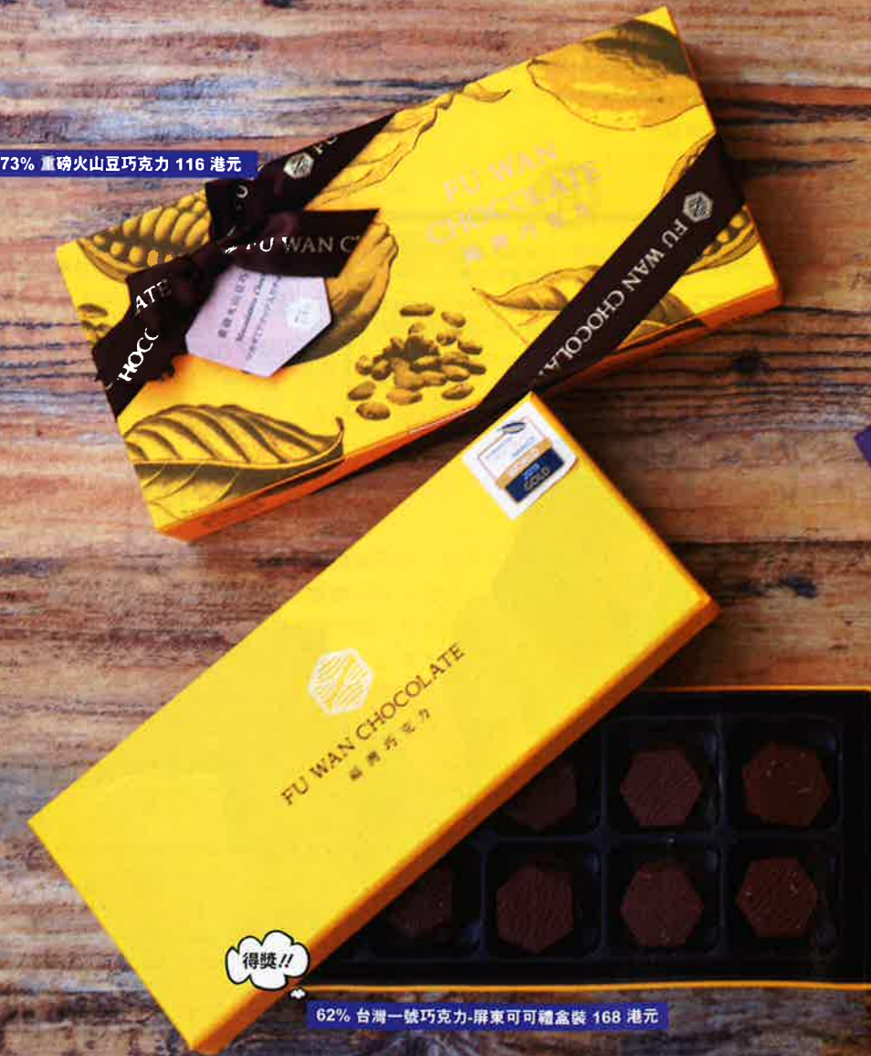
73% 重磅火山豆巧克力 116 港元