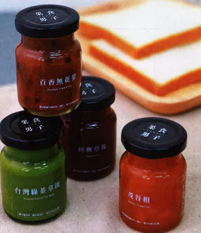
經典果醬禮盒 4 款 195 港元