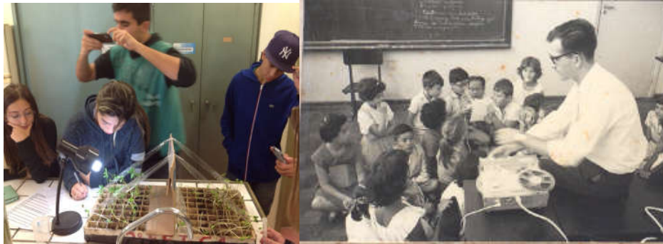
Aluna(o)s Fund II - laboratórios 2015, arranjo interacional com crianças em sala na década 1970.

em um projeto de trabalho ou em uma pesquisa conseguem melhores resultados.