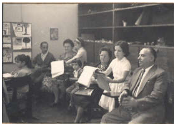
Crianças e suas famílias – reunião Escola de Aplicação década 1970.

O tamanho do grupo e a razão professor aluna/aluno faz diferença nas dinâmicas das aulas, tanto no ensino fundamental de 9 anos como no Ensino Médio – alguns professores e professoras desde a década de 1970 conseguem arranjos (duplas, trios, rodas etc.) que facilitam as interações entre as crianças 21 .