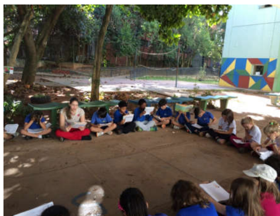
Roda de Leitura no Pátio da Escola - 4º série Fud. I, 2015

Todas as crianças que necessitam de atendimento educacional especial ou não conseguem maior grau de participação quando podem falar, pensar e ser ouvidos. As crianças e jovens na Escola de Aplicação quando estão envolvidos