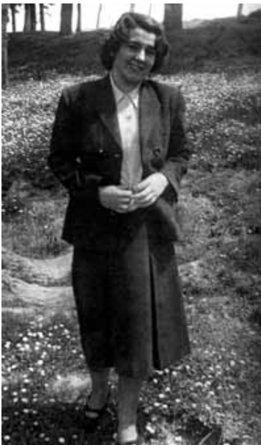
Mikela gaztetako urteetan

Eta hain zuzen ere, Euskeraren Adiskideak Elkartek sortu zuen lehen euskal eskola 1931. urtean Iruñean, eta Escuela Vasca izenez izan zen ezagutua. Gerra Zibila hasi arte iraun zuen eta hainbat haur eta gaztetxo pasatu zen haren ikasgeletatik bost urte horietan. Ez zuen egungo ikastoletako hizkuntzaren erabilera berdina jarraitzen, euskararen irakas-