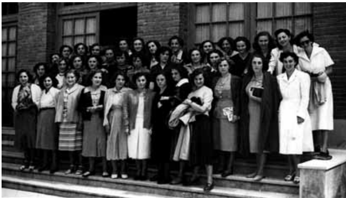
Maistra ikasketetako ikaskideekin. Lehenengo lerroan ezkerretik bosgarrena