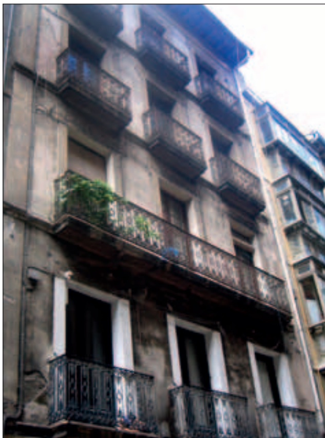
Pozoblanco kaleko etxe honetan hasi zen Iruñeko lehenengo ikastola Mikelarekin

da harritzekoa, gogoan izango baitzuten Iruñean hain berriki gertaturiko esperientzia. Eta hasiera xumea izan bazuen ere, ez zen, haatik, garrantzi txikiko ekintza gertatuko: lehenbiziko harria izan zelako, batetik, eta urrats berria eman zutelako, bestetik, eta, horrenbestez, beste askorentzat eredu eta eragin-garri bikain bihurtuko zelako uste baino arinago. Horra nola agertzen zuen Euskalerrriaren Adiskideak Elkarteko lehendakariak