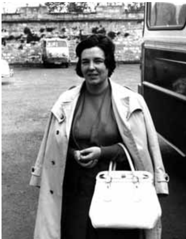
Ikastolako autobus baten ondoan

Pertsona erlijiosoa zen eta oinarrizko balio eta irizpideak ongi finkatuak zituen.