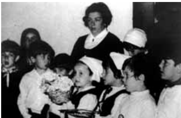
Ikastolako besta-egun batean

Gaitzak ere batzuetan bata bestearen atzetik etortzen baitira, unerik larrienean Hezkuntza Ministerioaren erantzuna jaso zen Ikastolari legeztapen ofiziala ukatuz, eta berehala itxi egin behar zuela ere aginduz. 1970eko otsaila zen. Nola edo hala, ikasturtea bere tenorean amaitzea lortu zen, baina, tarte horretan, Iruñako Ikastola, zenbait dokumentutan Uxue Ikastola ere deitzen hasia zena, zatitu egin zen. Hainbeste eta hain larriak ziren arazoak eta hain kontrajarriak bateko eta besteko irizpide eta jarrerak, ezen ez baitzen ahal egoerari fundamentuz aurre egiterik. Hurrengo hilabetean, gurasoen batzordearekin ados zeuden gurasoen ume eta andereñoek alde egitea erabaki zuten, eta apirilaren hasieratik, Zizurko Verbo Divino ikastetxean amaitu zuten ikasturtea, San Fermin Ikastola berria sortuz.