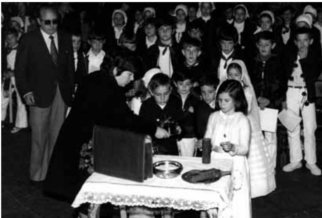
Beti adi egoten zen hurrekin