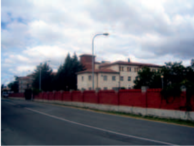
Paz de Ziganda ikastolak Beloso Goikoan bi urtez izan zuen egoitza