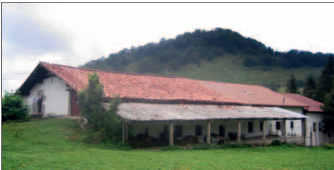
Mendi goian Santa Barbararen ermita dago