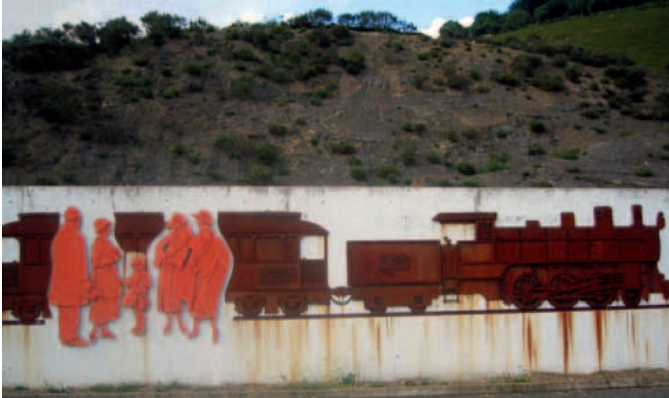
Iruñera joateko erabiltzen zuen Plazaola trenaren oroigarria

horretan laguntzea alabari. Ziprik berak lagun- du zion Iruñerako prestatzen ere eta hara abiatu zen ilusioz gainezka maisutzako ikaske- tak egitera Gorritiko neska gaztetxoa.