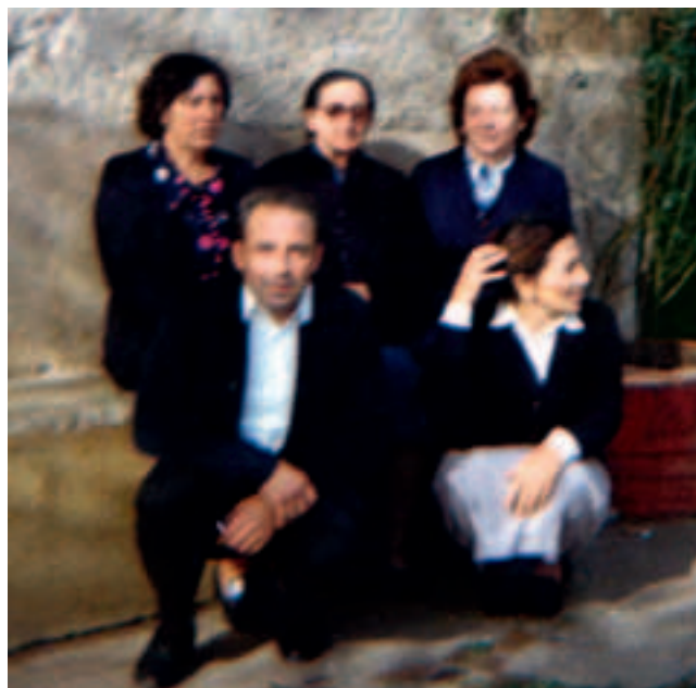
Amarekin, bi ahizpekin eta anaiarekin

Eta euskaltzaletasun hori bere inguruan zebiltzanengan hedatzen zuen. Haur eta ikasleengan, lehenbizi, erraz lortzen zuelako haurren