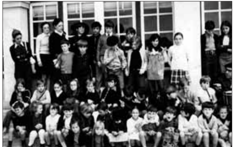
Paz de Zigandako ikasle taldea andereñoekin 1973an