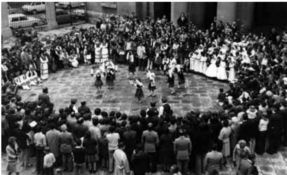
Ikastolako umeen lehen jaunartze egunean katedraleko atarian

urtean 125 izan ziren matrikulatuak, eta berriro toki arazoa sortu zen. Egoera ekonomikoa ez zen onegia eta ikasleen kuotetatik jasotzen zenak ez zituen kostu guztiak estaltzen, eta Euskalerrriaren Adiskideak Elkar-teak ez zuen egoitza bat erosi edo berria egiteko errekurtsorik, horrelako pentsaerarik burura etorri bazitzairen ere. Gauzak horrela, San Jose enparantzako tokia utzi gabe, beste bat alokatuz, kasu honetan bebarru bat Donibane auzoko Baiona etorbidearen 42an, eta irakasle berri bat hartuz eman zitzaion hasiera 1967-68 ikasturteari. Bestalde, ikasturte horretan eratu zen gurasoen lehenengo batzordea, 6 kidez osaturik, Euskalerrriaren