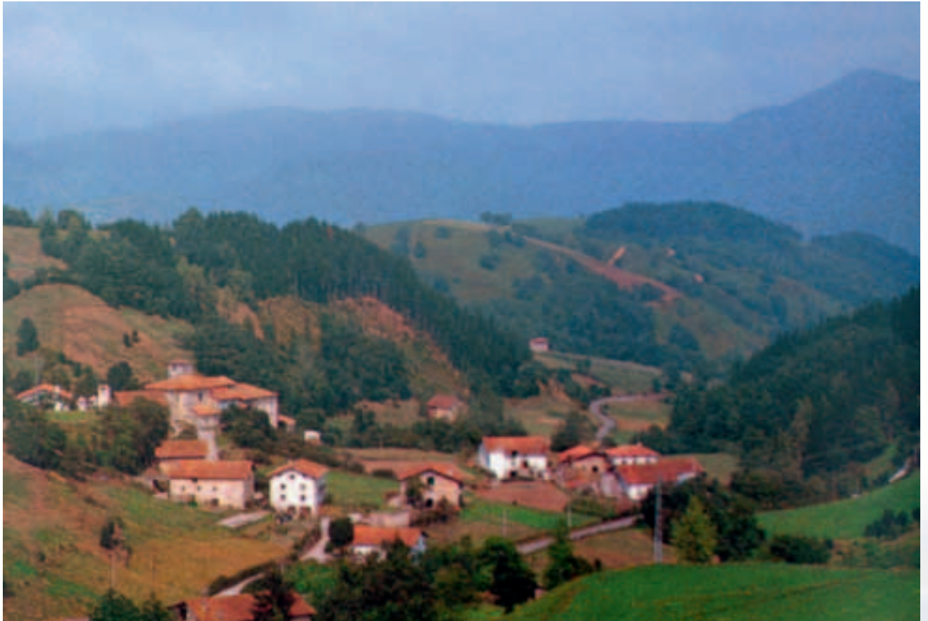
Uztegin eman zituen lehenengo eskolak