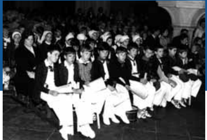
Euskalduntasunean murgiltzen zituen neska-mutilak

Garai hartan, ez zen hain erraz har zitekeen erabakia bat-batean eskolak euskaraz ematen hastekoa. Iruñean ez