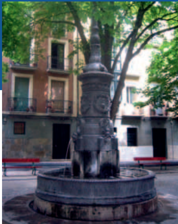
San Jose enparantzako etxe honetan izan zuen ikastolak bigarren egoitza