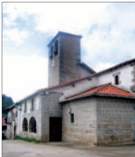
San Bartolome elizan bataiatua izan zen

Harreman nagusiagoetarako Gorritik Tolosara jotzen zuen ia erabat errepidea egin zen arte, Tolosa hiri nagusia baitzen eta, gainera, hurbilxeago gelditzen zitzaion Iruñea baino. Ongi