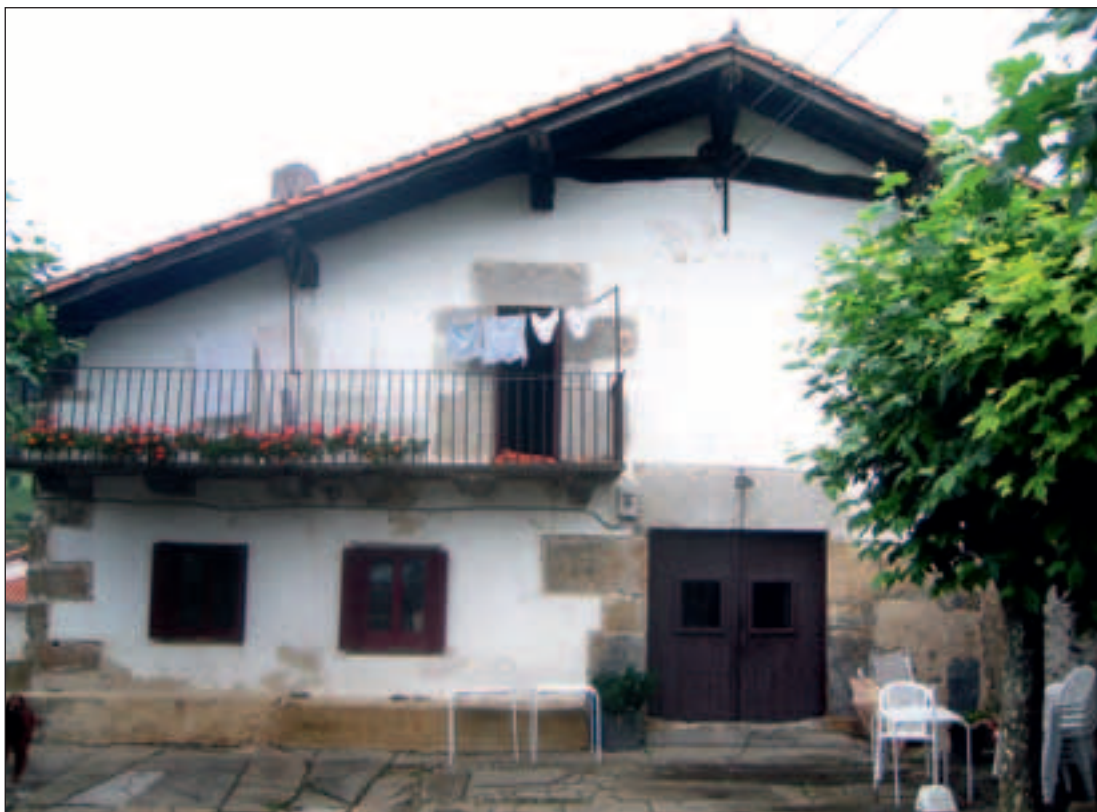
Mikelenea Mikelaren etxea

baitzioten herrietan, eta mesedegarria ere herri horietako jendearentzat harat-honat mugitzeko Donostia eta Iruñea bitartean. Desagertua da aspalditxo, baina haren oroitzapena ez da galdu, eta hark egiten zuen bidea baliatuz ibilbide gozagarriak eratu dituzte zenbait tokitan, izena bera ere gordez.