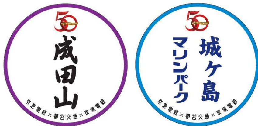
復刻運行用ヘッドマーク