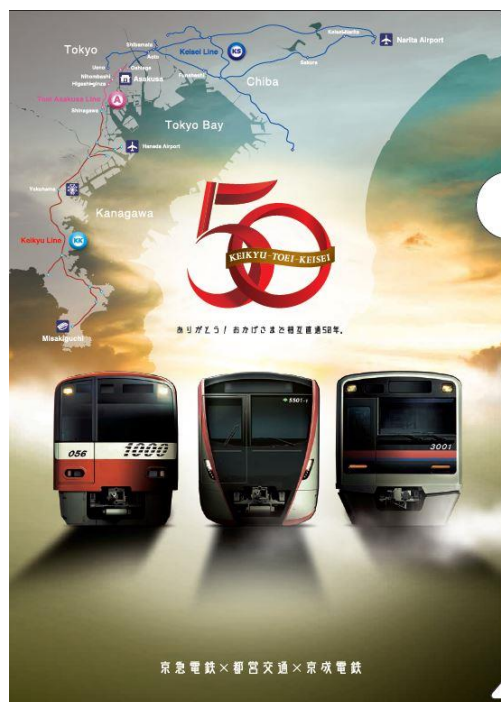
オリジナルクリアファイル