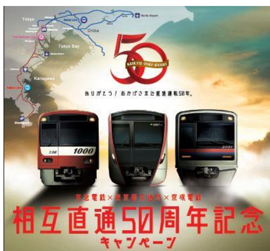
相互直通 50 周年記念ポスター