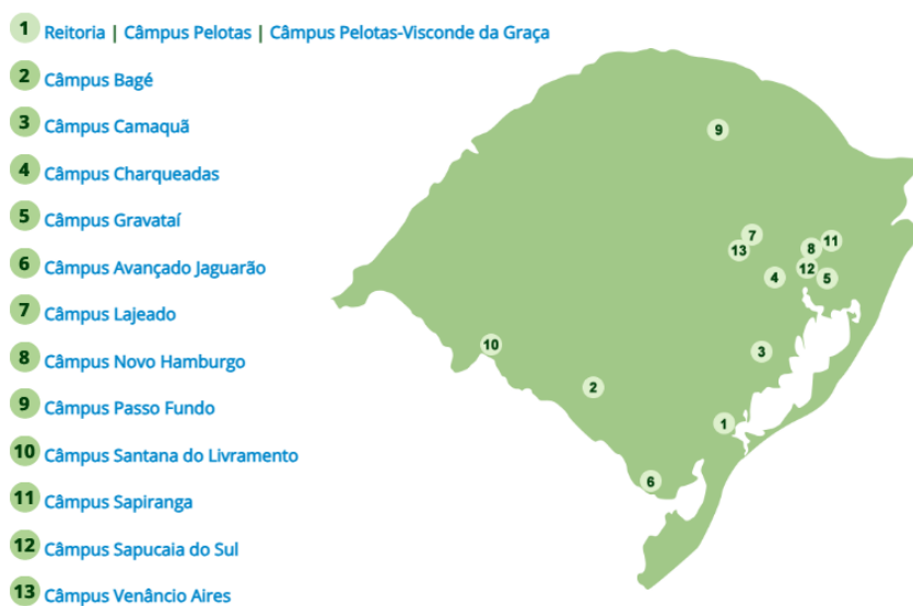
Figura 1 - Distribuição das unidades do IFSul pelo estado

A administração do IFSul tem como órgãos superiores o Colégio de Dirigentes (CODIR) e o Conselho Superior (CONSUP), cuja estruturação, competências e normas de funcionamento estão organizadas em seu Estatuto. A reitoria e os 14 (quatorze) câmpus do IFSul estão distribuídos pelo estado do Rio Grande do Sul, conforme Figura 1: