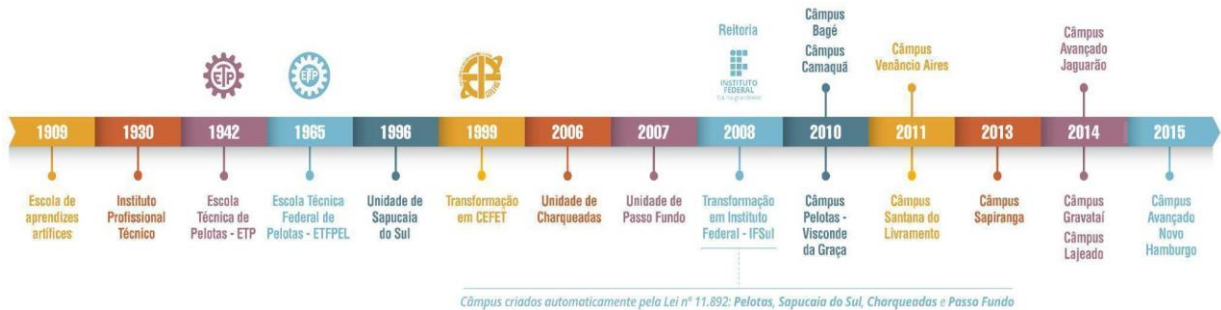
Figura 2 – Linha do tempo de evolução da Instituição