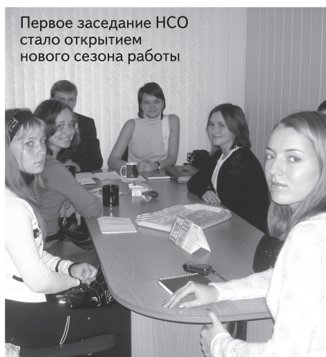
Первое заседание НСО стало открытием нового сезона работы

— Приняли очень тепло. Студенты были заинтересованы, проявляли интерес, любопытство. До посещения колонии думал, что там будет хуже. Но осталось место для критики – военная дисциплина. Порядок, дисциплина, чистота – армейские доблести. Заключение рассматриваются в рамках коллектива, а надо сместить акцент на личность. В каждом человеке есть своя личность, каждый должен по-своему готовиться к освобождению. После беседы с руководителем колонии прогноз не оптимистический