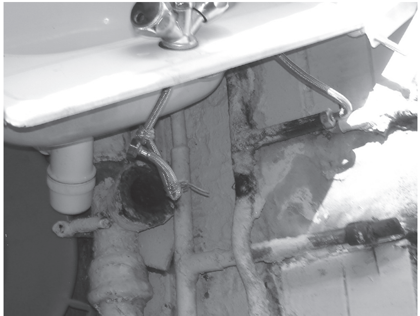
■ Неудобства? К счастью, их устранение – только вопрос времени.

Во-вторых, именно «пять человек» живет только в двух комнатах, причем, исключительно по своему желанию и национальным причинам. Поэтому мест пока хватает всем, мебель уже тоже не в дефиците. Совсем недавно директор факультета выделил на нее 10 000 рублей. Кроме того, администрация студ. городка тоже решила помочь в этом деле, когда – пока неизвестно.