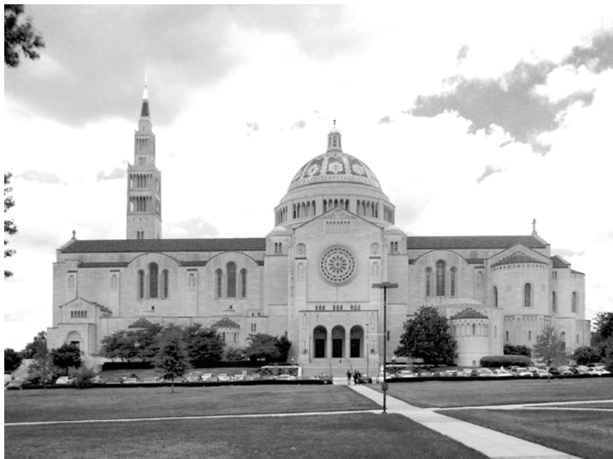
Bazilika Neposkvrněného početí Panny Marie, národní svatyně USA, Washington D. C.