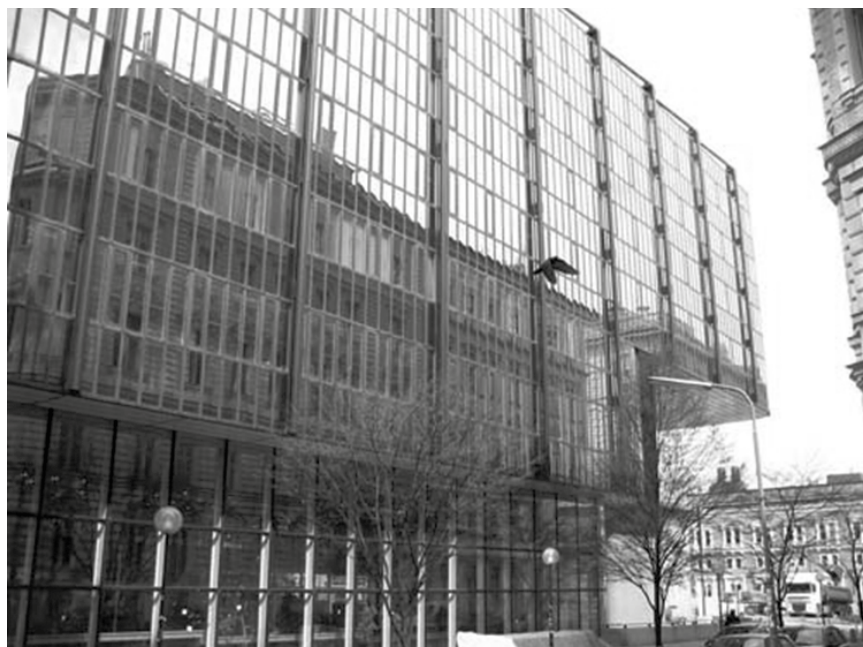
Juridicum, hlavní budova Právnické fakulty Vídeňské univerzity (2014).