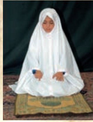
تشهد و سلام در مذهب حنفی:

سلام و درودها برای خداست. همچنین نمازها و چیزهای خوب.