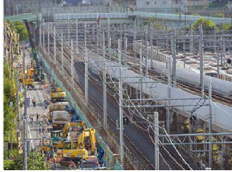
側道復旧工事の状況