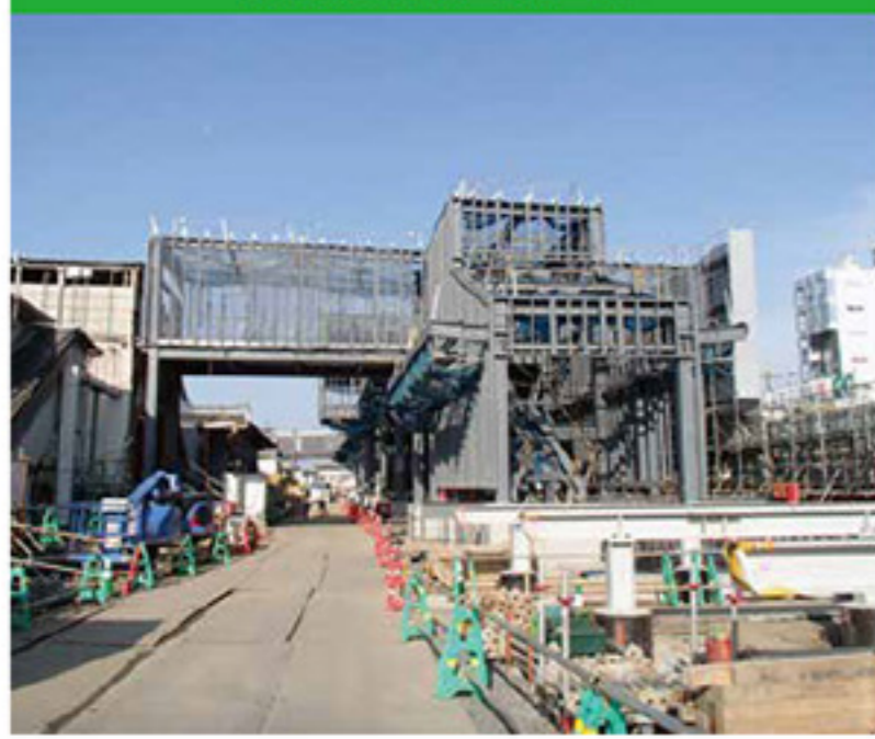
伊勢崎仮上り線ホーム工事 南北連絡通路工事