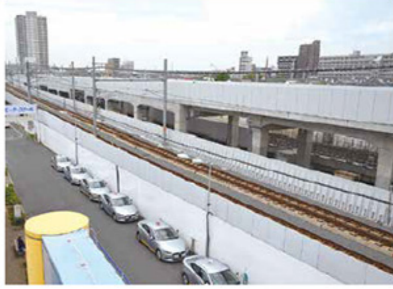
引上線高架橋の状況(外観)