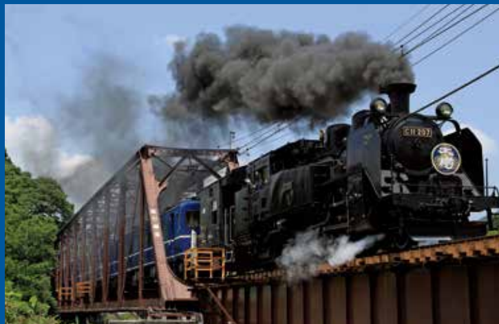
東武鉄道 SL復活運転プロジェクト 「SL大樹」 下今市駅～鬼怒川温泉駅間で運行中

いずれの工事も、ご利用になるお客様、沿線にお住いの皆様には何かとご不便、ご迷惑をお掛けしますが、安全最優先で早期完成を目指しておりますので、何卒ご理解賜りますようお願いいたします。