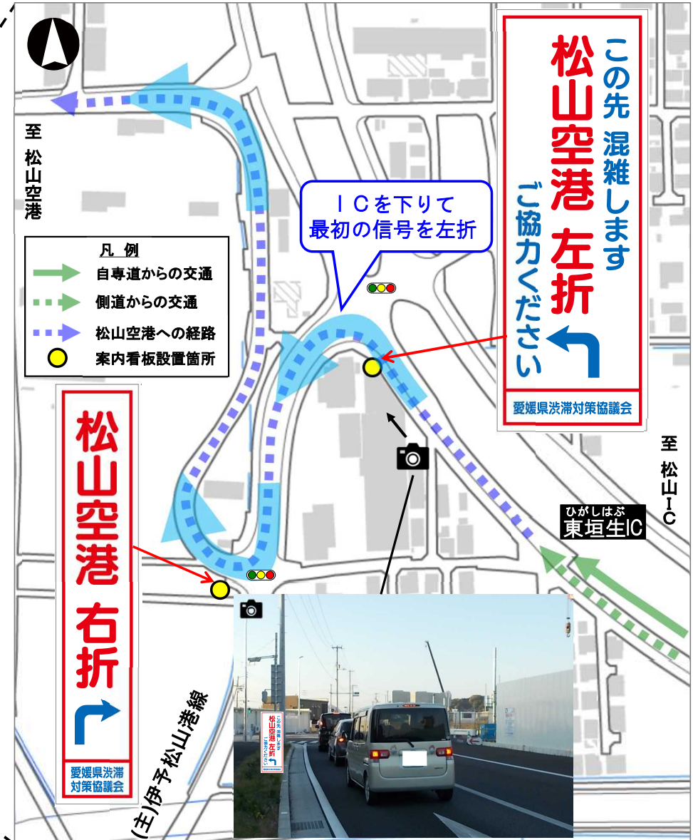
※国土地理院の数値地図(国土基本情報)を編集