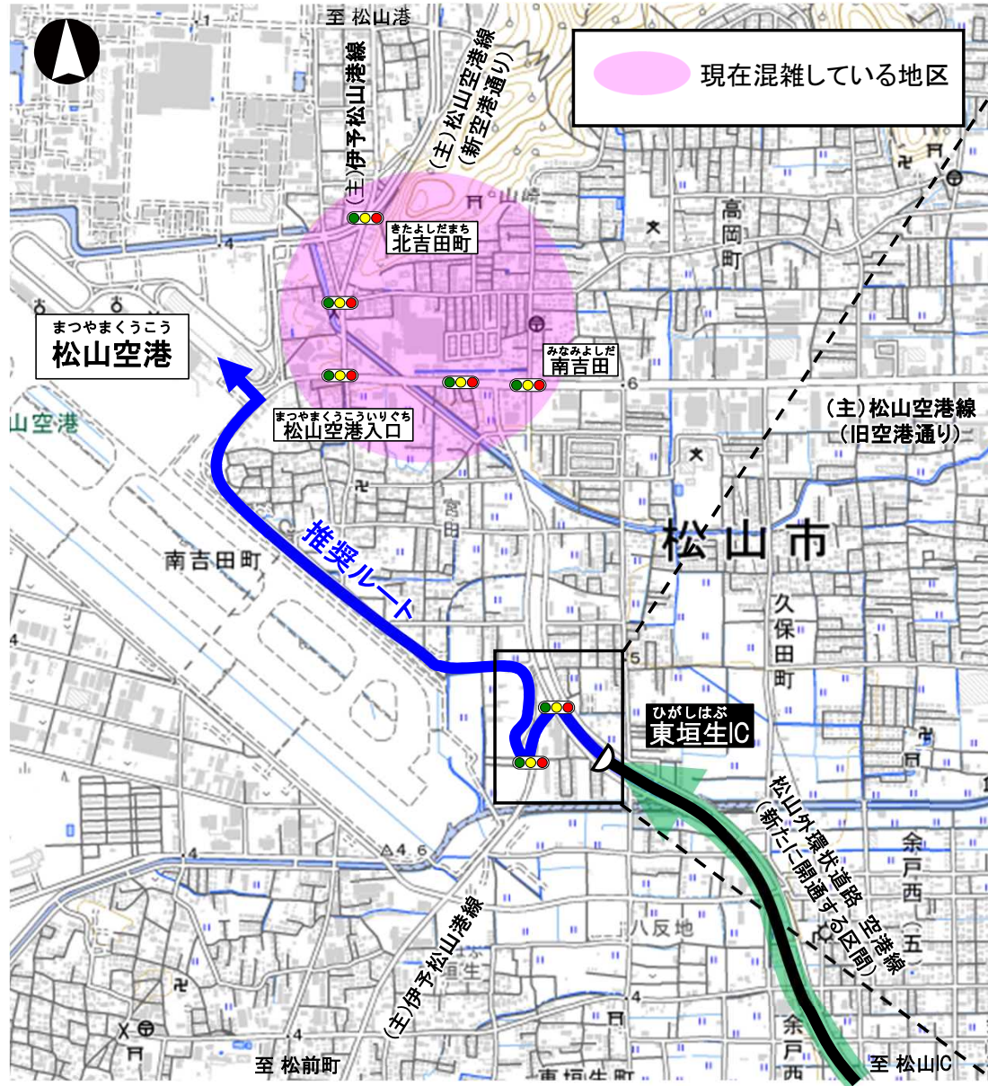
※国土地理院の数値地図(国土基本情報)を編集