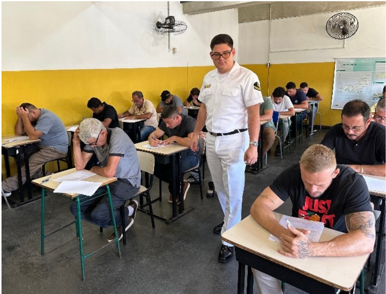
Candidatos realizam a prova de habilitação de Arrais Amador e Motonauta, em Miracema-Rj

Em 06 de abril, a Capitania dos Portos de Macaé (CPM) realizou a aplicação das provas de habilitação de Arrais Amador e Motonauta para 29 candidatos, na Escola Municipal Álvaro da Fonseca Lontra, localizada no município de Miracema (RJ). Na ocasião, a CPM também procedeu com a renovação da habilitação de amadores.