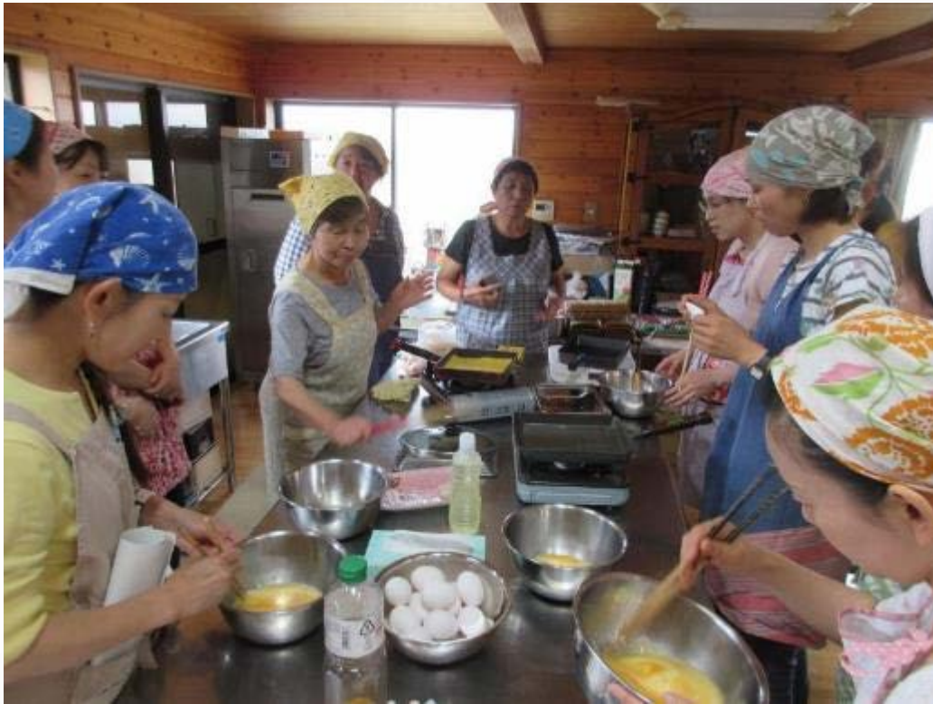
太巻き寿司の技術を伝承

サンスマイルー山武農業女子ネットー（39名） 平成30年度 食の伝承講習会と経営基礎研修