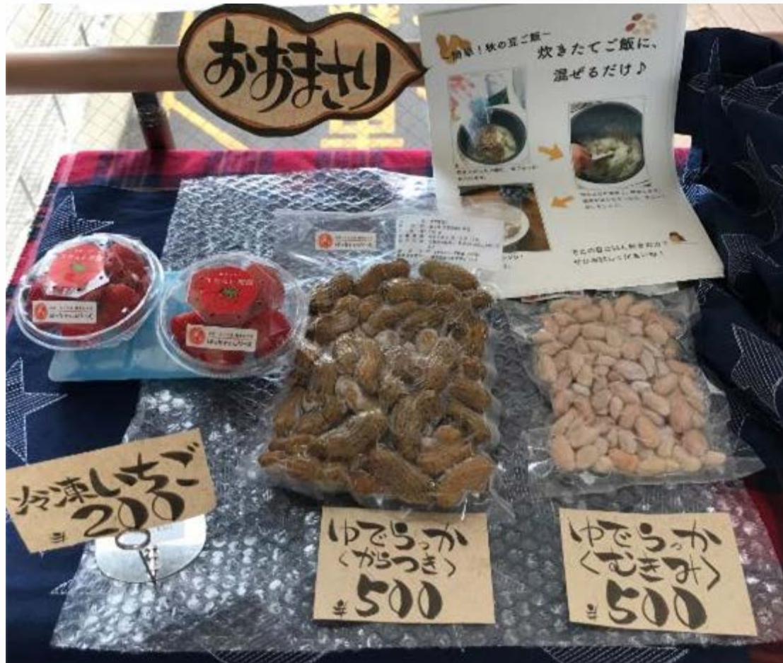
チラシやポップも手作りです