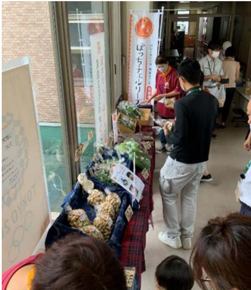
のぼり旗でアピール