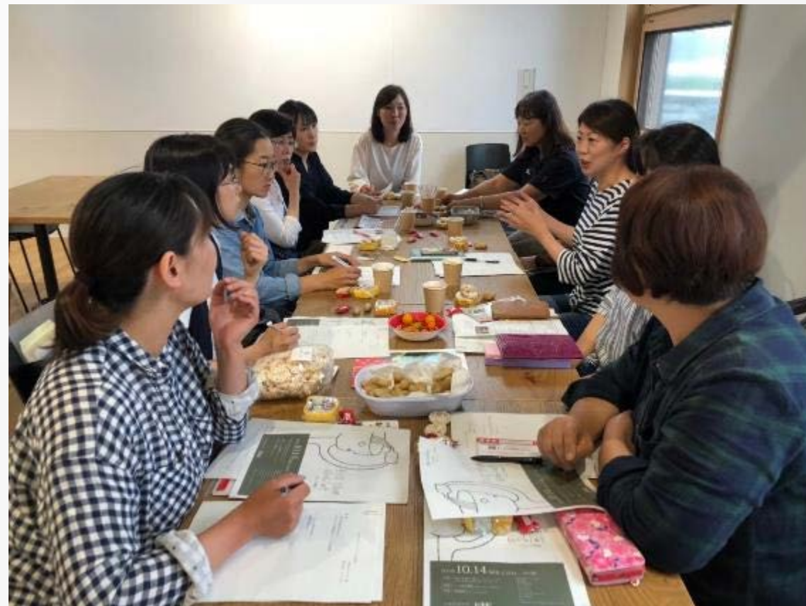
打ち合わせの様子