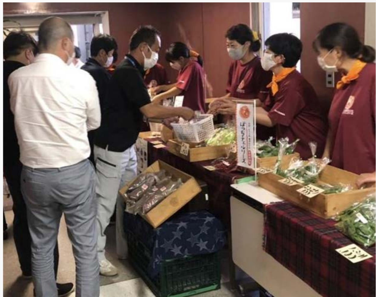
Tシャツとバンダナはお揃いです