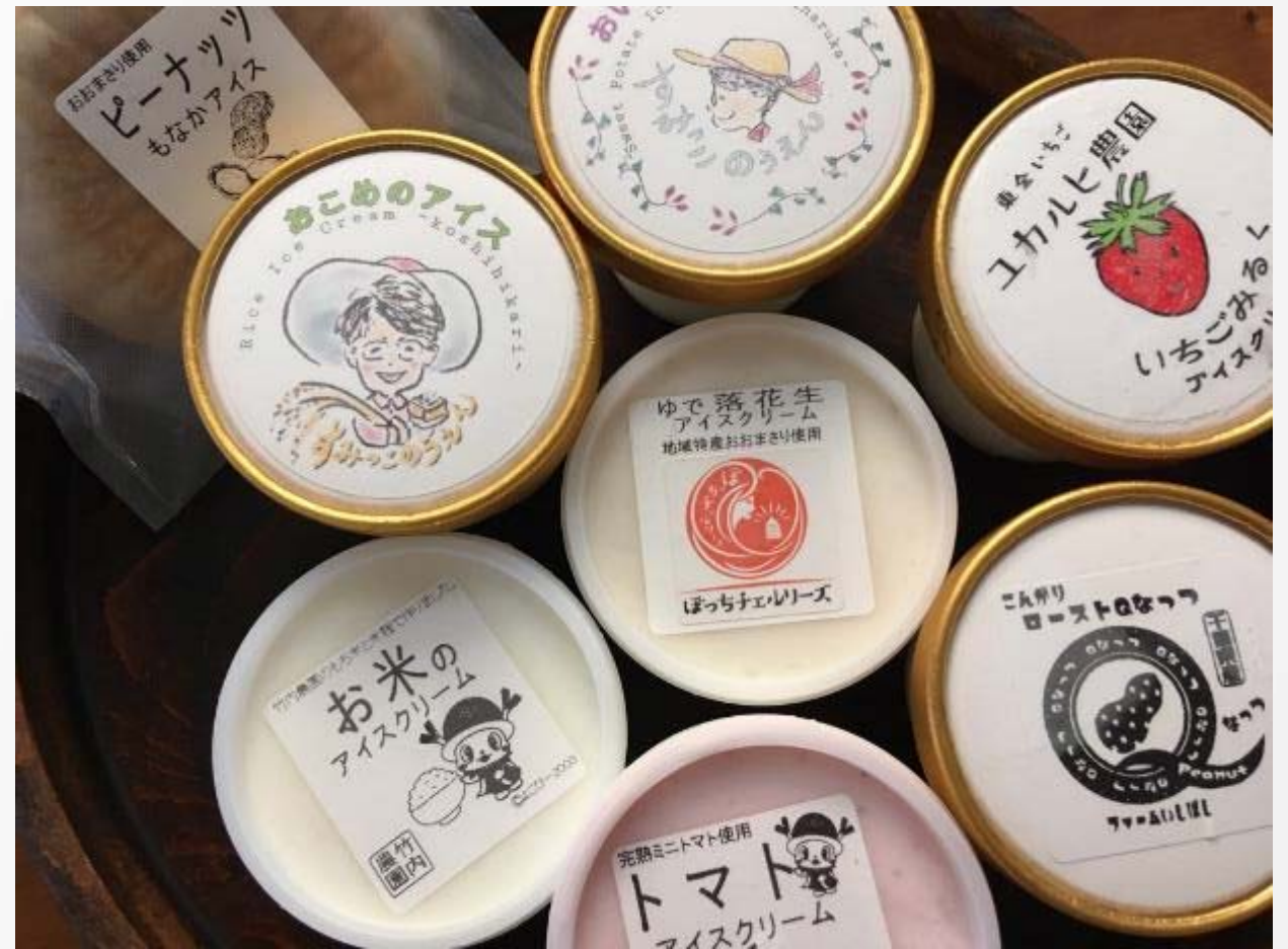
個性的なアイスたち