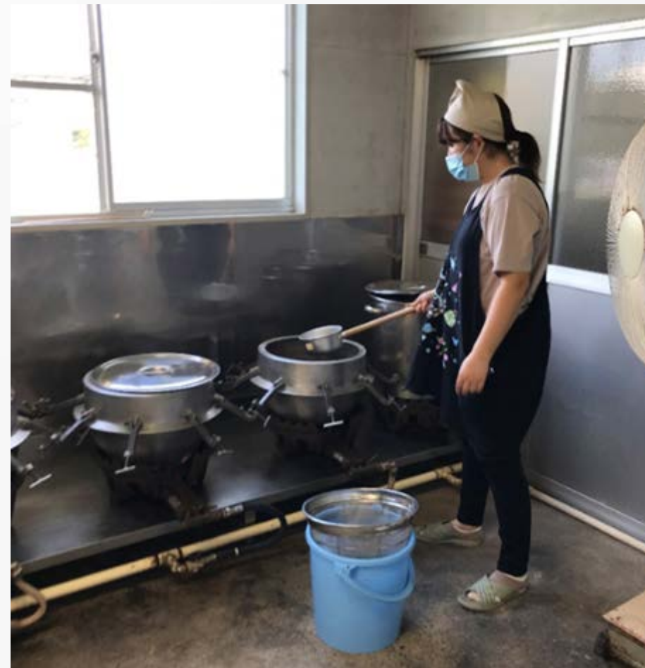
大鍋で茹でる（暑かった）