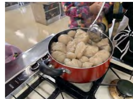
こんにゃくづくり実習