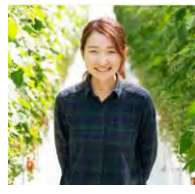
Neighbor's Farm 川名桂