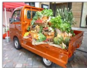
ダイハツ ハイゼット

2016年より「LOVEローカル活動」として、カラフルなハイゼットの貸し出しを実施。今期はマルシェやイベントが再開され利用機会が増加。