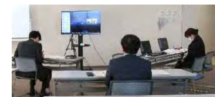
意見交換の様子 (九州農政局)