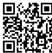
▲ 農業女子アワード2022 Webサイト