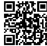
▲農の魅力発信コンソーシアムWebサイト

◆これまで農業とは縁がなかった方々が農業に関心を持つきっかけをつくるために、実際に農業現場で活躍している農業者の姿を通じて、「職業としての農業の魅力」を発信する取組。