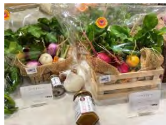
みなもとファーム