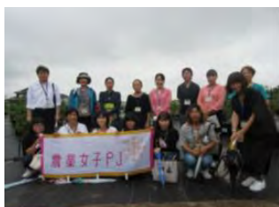
愛西市ブルーベリー園での現地交流会の様子(2022.7)