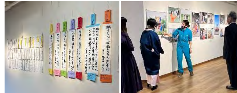
藪内さんによるトークショーの様子(2022.10)