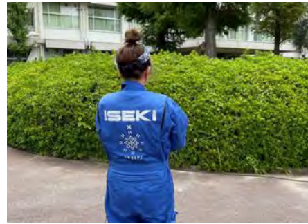
農業女子のつなぎでPR