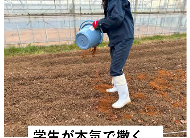
学生が本気で撒く。