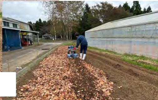
キャンパスの落ち葉も利用！