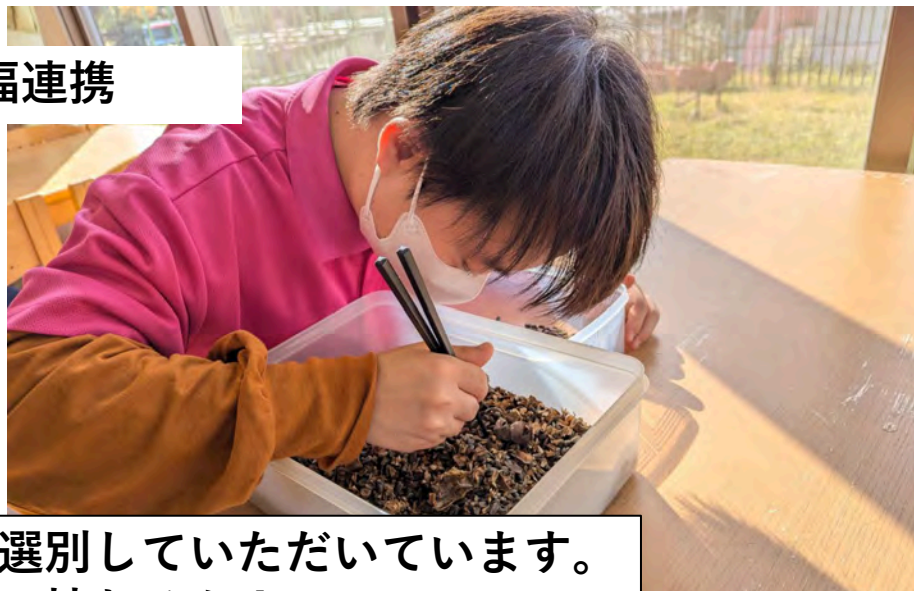
障害者就労支援施設で種を選別していただいています。 ひまわり油、搾れるか！