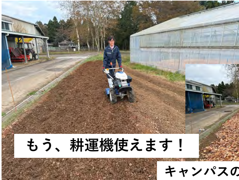
もう、耕運機使えます！