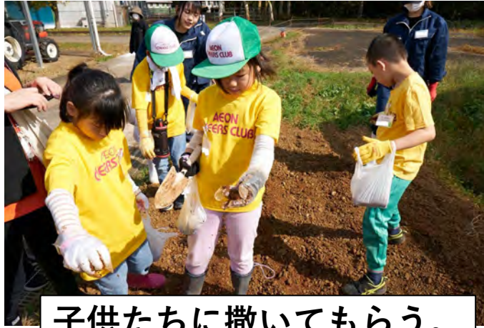
子供たちに撒いてもらう。