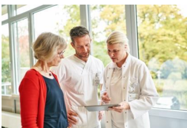
Ihre Perspektiven bei uns!