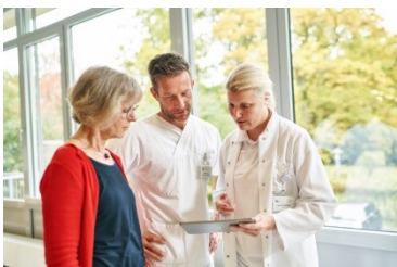
Ihre Perspektiven bei uns!