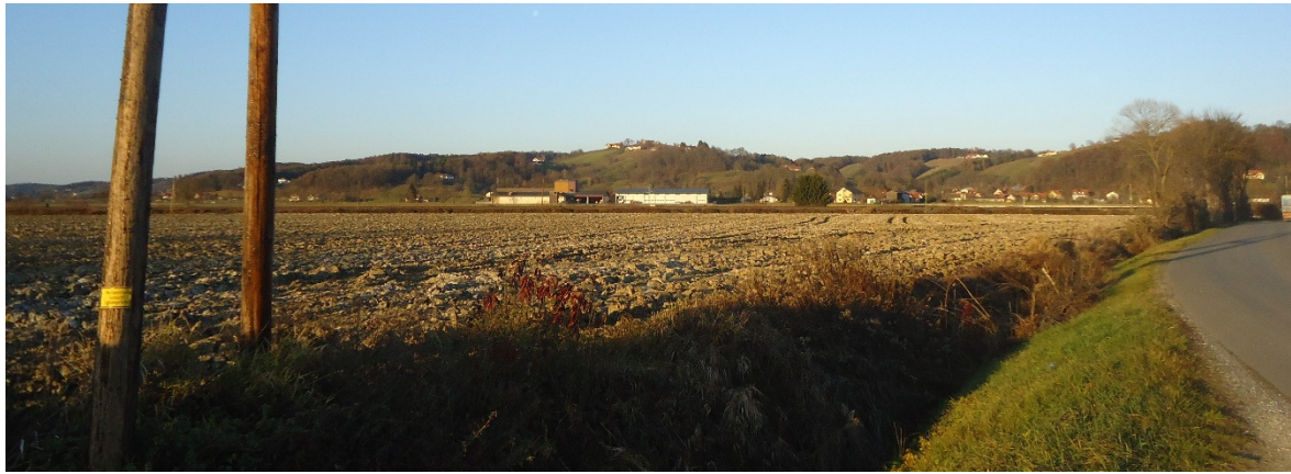
Abbildung 2: Fotostandpunkt Nr. 1. Blick Richtung Norden. Bereich südlich der Bahntrasse; rechts im Bild der Mühlweg