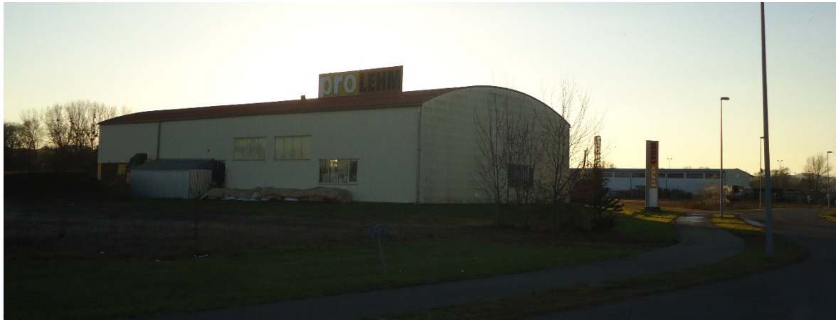
Abbildung 5: Fotostandpunkt Nr. 3. Blick Richtung Südwesten. Bereich südlich der Bahntrasse