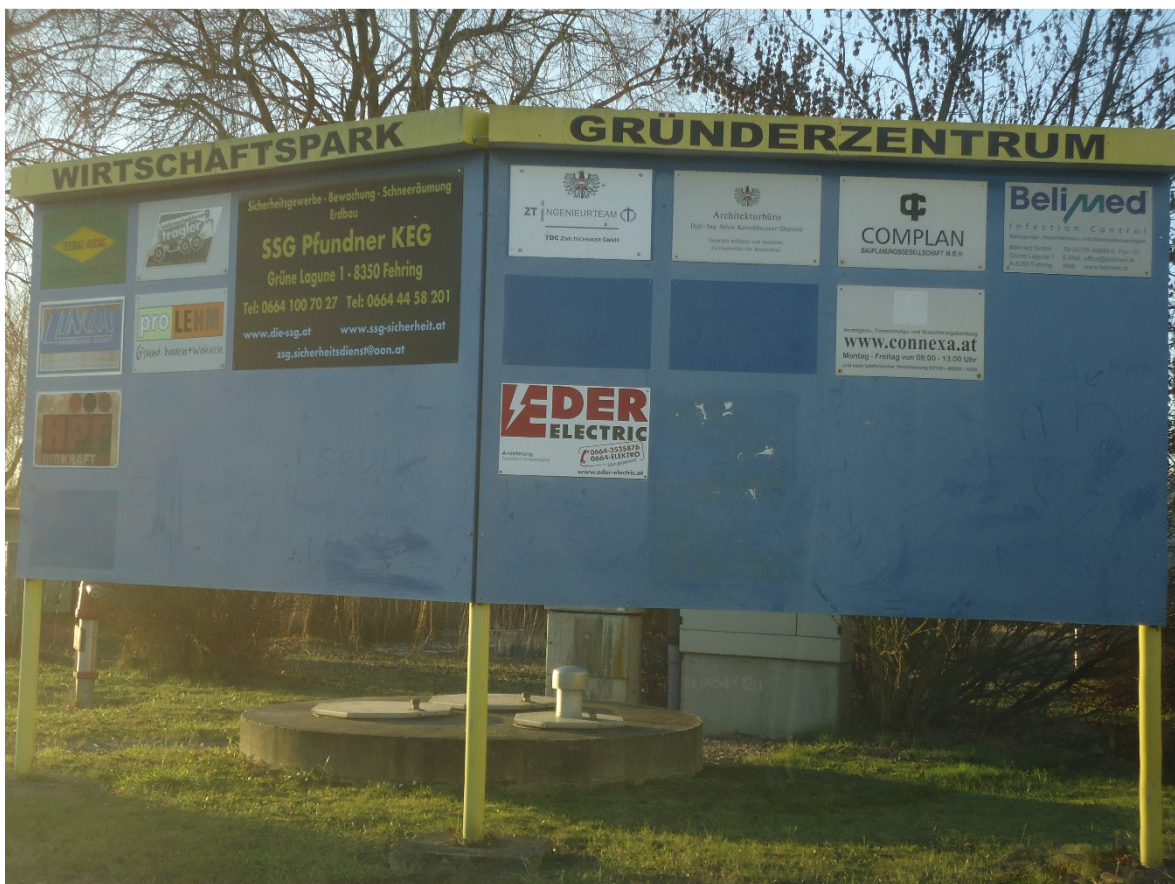
Abbildung 6: Fotostandpunkt Nr. 3. Informationstafel Wirtschaftspark