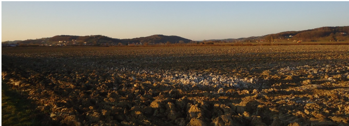
Abbildung 3: Fotostandpunkt Nr. 1. Blick Richtung Nordwesten. Bereich des Fehringer Bahnhofes, südlich der Bahntrasse; im Hintergrund der Rattenberg