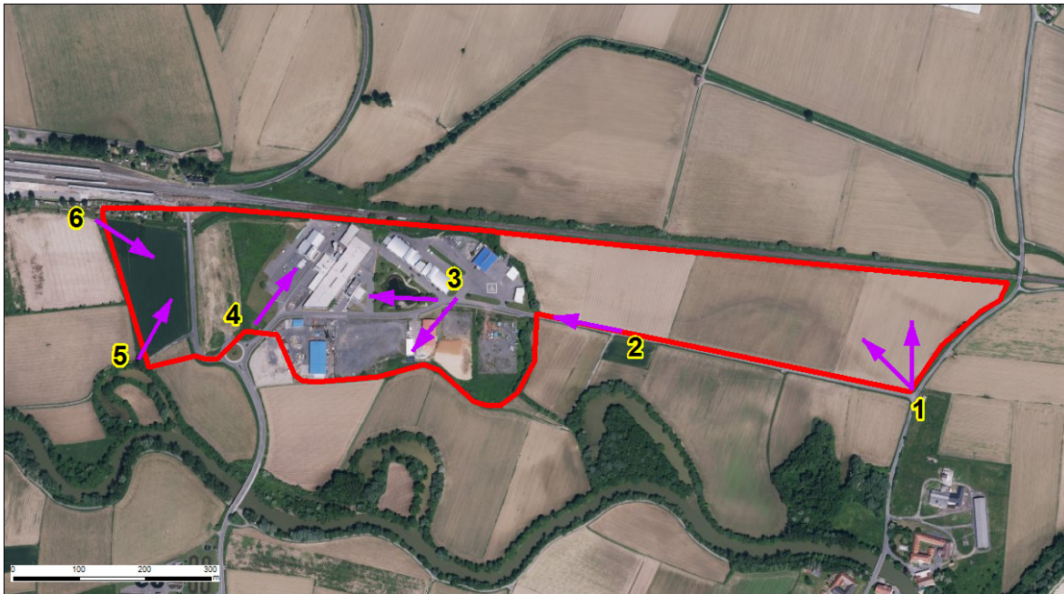
Abbildung 1: Vorrangzone Fehring: Ausschnitt Regionalplan bzw. Orthophoto (inkl. Fotopunkte)