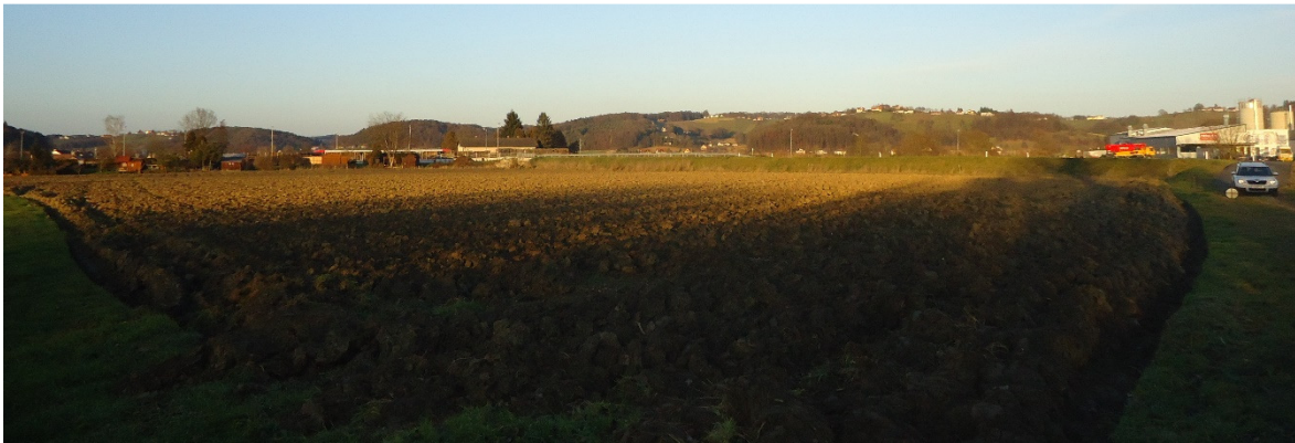
Abbildung 8: Fotostandpunkt Nr. 5. Blick Richtung Nordosten. Bereich südlich der Bahntrasse; links im Bild eine Kleingartenanlage