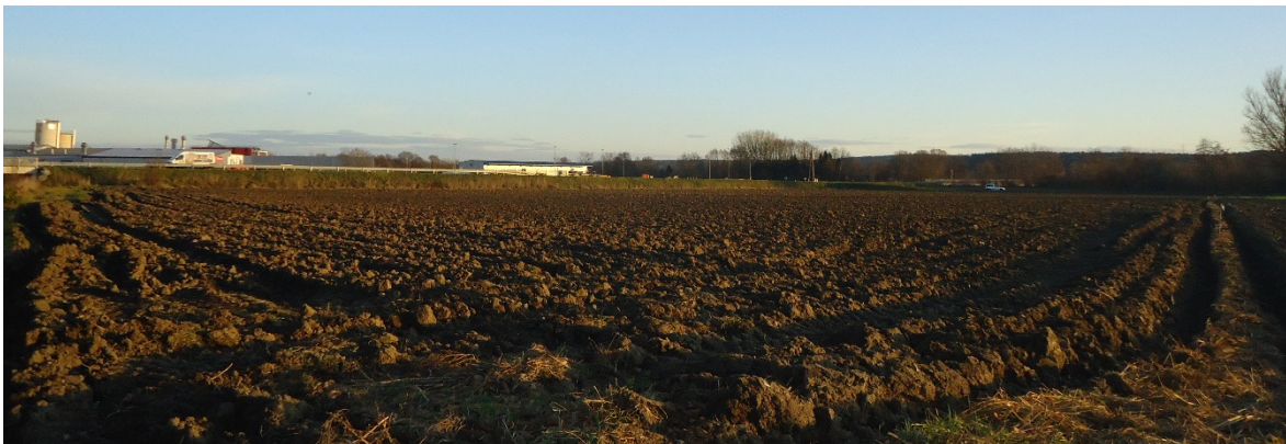
Abbildung 9: Fotostandpunkt Nr. 6. Blick Richtung Südosten. Bereich südlich der Bahntrasse; links im Bild bestehenden Betriebe des Wirtschaftsparks „Grünen Lagune“