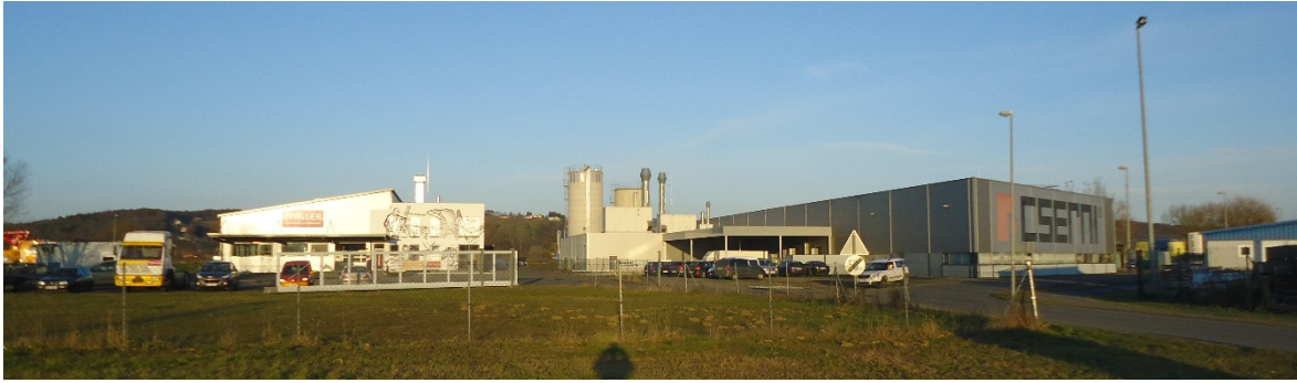
Abbildung 7: Fotostandpunkt Nr. 4. Blick Richtung Nordosten. Bereich südlich der Bahntrasse; Betriebe des Wirtschaftsparks, links im Hintergrund der Weinberg