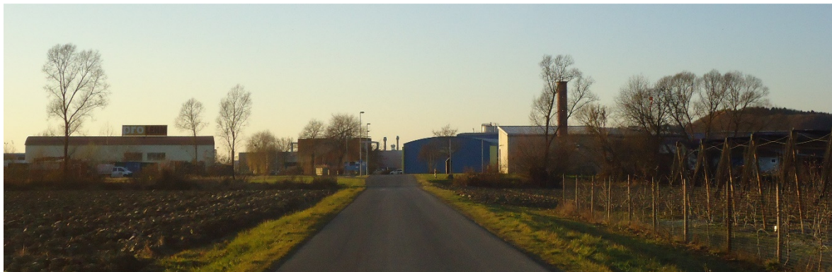
Abbildung 4: Fotostandpunkt Nr. 2. Blick Richtung Westen. Bereich südlich der Bahntrasse; Erschließung Osten