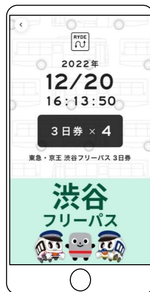
チケット画面イメージ