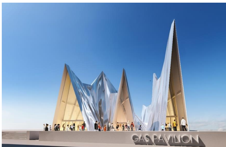
【建物デザインイメージパース】