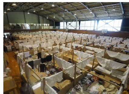
<避難所における3密対策>