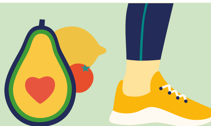
KOST OCH MOTION