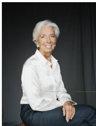
Christine Lagarde, ordförande för Europeiska systemrisknämnden

Jag är mycket glad att kunna lägga fram Europeiska systemrisknämndens (ESRB) trettonde årsrapport som omfattar perioden mellan den 1 april 2023 och den 31 mars 2024. Denna rapport är riktad till medlagstiftarna i Europeiska unionen och allmänheten i Europa i stort, och här förklarar vi hur ESRB har fullgjort sitt uppdrag. Den är en viktig del av ESRB:s arbete för att följa gällande regler om öppenhet och redovisningsansvar.