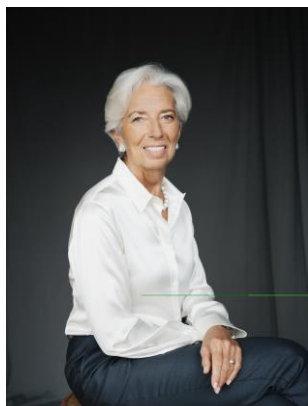
Christine Lagarde, voorzitter van het Europees Comité voor systeemrisico's

Met veel genoegen presenteer ik hierbij het dertiende jaarverslag van het Europees Comité voor systeemrisico's (European Systemic Risk Board – ESRB), dat betrekking heeft op de periode van 1 april 2023 tot en met 31 maart 2024. Dit verslag, dat is gericht aan de medewetgevers in de Europese Unie en de Europese burgers, legt uit hoe het ESRB zijn mandaat heeft vervuld. Het vormt een belangrijk onderdeel van het kader voor transparantie en verantwoording van het ESRB.