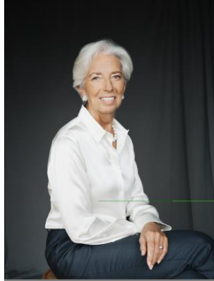
Christine Lagarde, President tal-Bord Ewropew dwar ir-Riskju Sistemiku

Huwa l-pjaċir tiegħi li nipprezenta t-Tlethax-il Rapport Annwali tal-Bord Ewropew dwar ir-Riskju Sistemiku (BERS), li jkopri l-perjodu bejn l-1 ta' April 2023 u l-31 ta' Marzu 2024. Dan ir-rapport, li huwa indirizzat lill-koleġislaturi fl-Unjoni Ewropea u lill-pubbliku Ewropew b'mod ġenerali, jispjega kif il-BERS wettaq il-mandat tiegħu. Jiffirma parti importanti mill-qafas tat-trasparenza u l-akkontabbiltà tal-BERS.