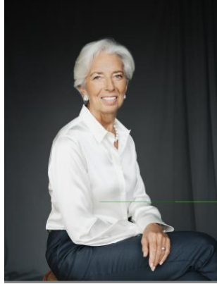
Christine Lagarde, Cathaoirleach an Bhoird Eorpaigh um Riosca Sistéamach

Tá an-áthas orm an 13ú Tuarascáil Bhliantúil ón mBord Eorpach um Riosca Sistéamach (BERS), a chlúdaíonn an tréimhse idir 1 Aibreán 2023 agus 31 Márta 2024, a chur i láthair. Leis an tuarascáil seo, atá dírithe ar chomhreachtóirí san Aontas Eorpach agus ar phobal na hEorpa i gcoitinne, mínítear cén chaoi ar chomhlíon BERS a sainordú. Is cuid thábhachtach de thrédhearcacht agus de chreat cuntasachta BERS í.