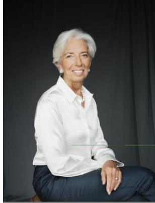
Christine Lagarde, Euroopan järjestelmäriskikomitean järjestelmäriskikomitean puheenjohtaja

Voin tyytyväisenä esitellä Euroopan järjestelmäriskikomitean (EJRK) 13. vuosikertomuksen, joka kattaa ajanjakson 1.4.2023–31.3.2024. Vuosikertomuksessa kerrotaan EU:n lainsäätäjille ja EU:n jäsenvaltioiden kansalaisille, miten EJRK hoiti tehtävänsä tuona aikana. Kertomus on tärkeä osa EJRK:n toiminnan avoimuutta ja tilivelvollisuutta.