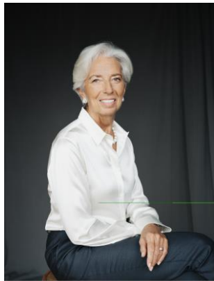
Кристин Лагард, председател на Европейския съвет за системен риск

Много се радвам да представя тринадесетия Годишен доклад на Европейския съвет за системен риск (ЕССР), който обхваща периода от 1 април 2023 г. до 31 март 2024 г. Той е предназначен за съзакондателите на Европейския съюз и за широката европейска общественост и в него се разяснява как ЕССР изпълнява мандата си. Докладът е важна част от рамката на ЕССР за прозрачност и отчетност.