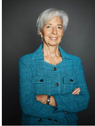
Christine Lagarde, az Európai Rendszerkockázati Testület elnöke

Örömmel mutatom be az Európai Rendszerkockázati Testület (ERKT) 12. éves jelentését, amelyben a 2022. április 1. és 2023. március 31. közötti időszakról számolunk be. Az ERKT átláthatósági és elszámoltathatósági keretrendszerének fontos részét képező jelentésben tájékoztatjuk az Európai Unió társjogalkotóit és az európai nagyközönséget arról, hogy hogyan teljesítette az ERKT a megbízatását.