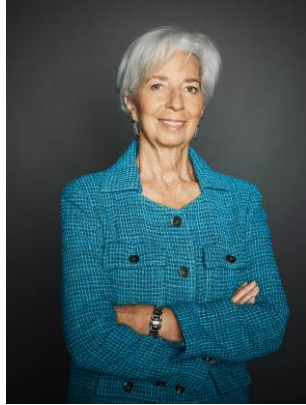
Christine Lagarde, Euroopa Süsteemsete Riskide Nõukogu eesistuja

Mul on hea meel esitleda Euroopa Süsteemsete Riskide Nõukogu (ESRN) kaheteistkümnendat aastaaruannet, mis hõlmab ajavahemikku 1. aprillist 2022 kuni 31. märtsini 2023.