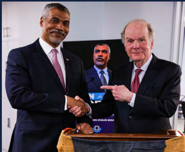
Saunders (izquierda) estrechando manos con el primer Comisionado de la CBP, Robert C Bonner (derecha)