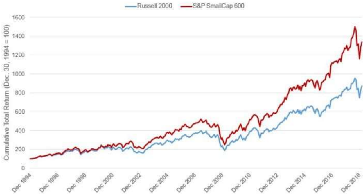
Exhibit 1: A positive earnings screen helped the S&P 600 to outperform, historically.

Chart based on monthly total returns between Dec. 1994 and Feb. 2019. Past performance is no guarantee of future results. Charts is provided for illustrative purposes only.