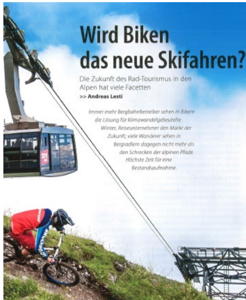
Artikel im Alpenvereinsjahrbuch Berg 2018