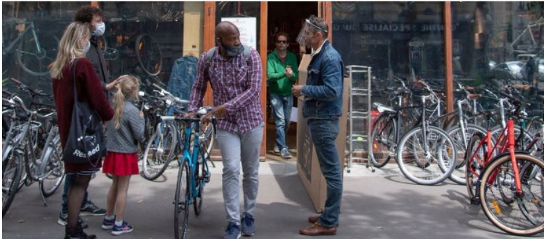
WELTFAHRRADTAG - GESCHÄFTE AM LIMIT