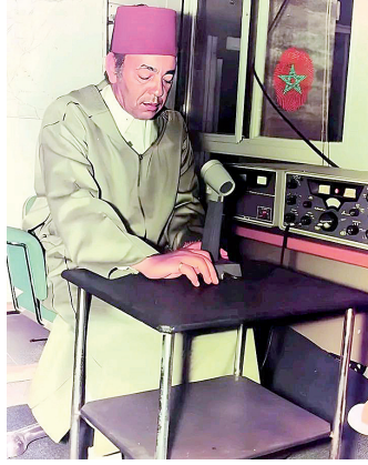
لمحة إعلان الملك الحسن الثاني لتسيرة (أرشيف)

منذ بداية السبعينيات، دخل الملك الراحل الحسن الثاني في مفاوضات عديدة مع نظام الرئيس الإسباني فرانكو من أجل إيجاد حل للمسألة، وهو ما كان يعال بالرفض تارة، وبشروط ثقافت الاستقلال محسوبة تارة أخرى، إذ كانت إسبانيا تريد إبقاء سيطرتها الاقتصادية والعسكرية في العديد من المواقع، لكن هذا الأمر تغير تدريجيا مع تقدم الجنرال في السن، وأنشغال النظام الإسباني بمرحلة ما بعد رحيله. في أحد لقاءات الملك الحسن الثاني بوزير الخارجية الأمريكي هنري كيسنجر، بتاريخ 15 أكتوبر 1974، ووفق الأرشيف الرسمي الأمريكي، وجه كلامه لكيسنجر قائلا: «أجود، دولة في الصحراء بمدينة قبول الولايات المتحدة بوجود صواريخ سوفياتية في كوبا... إذا تحركت إسبانيا لنح الاستقلال للصحراء، فأنا أخبرك بصريح العبارة أنه إذا أعلن استقلال الصحراء في العاشرة صباحا، سأحرك قواتي لدخولها في الحادية عشرة». وتابع الحسن الثاني كلامه: «الإسبان سيحاولون إلى بدهم، أما المغرب فسيتكون محاطا بالبحر الأبيض المتوسط، والمحيط الأطلسي، والجزائر والجزائر ثم الجزائر من الجانب الثلاثة الأخرى».