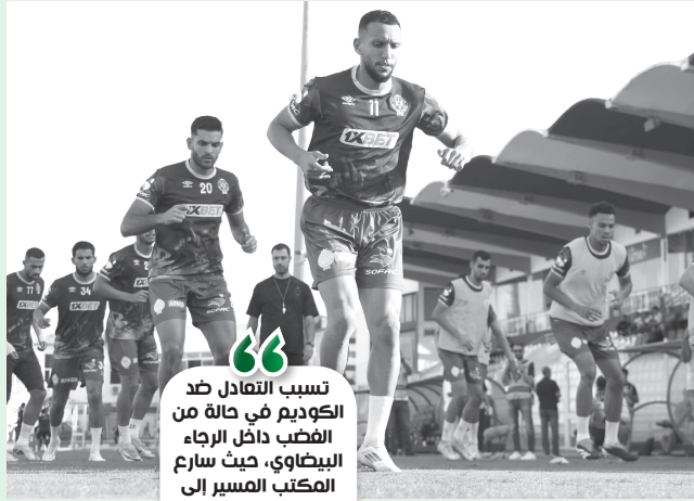
أبو شروان يرفض الالتحاق بطاقم سايننتو

تسبب التعادل ضد الكوديم في حالة من الغضب داخل الرجاء البيضاوي، حيث سارع المكتب المسير إلى الاجتماع بالمدرب البرتغالي ريكاردو سايننتو، لاستفساره عن أسباب تراجع نتائج الفريق