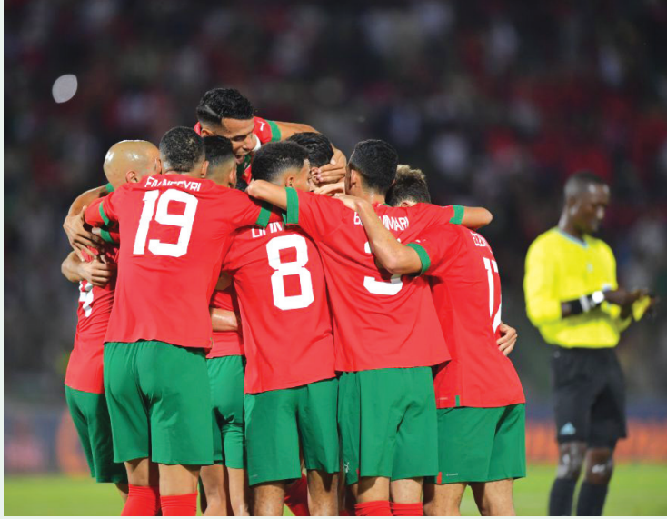
المنتخب الوطني يتفقد العديد من اللاعبين في المعسكر المقبل

«المغرب 2025»، التي أقيمت في الشهر الماضي على أرضية الملعب الشرفي بوجدة.