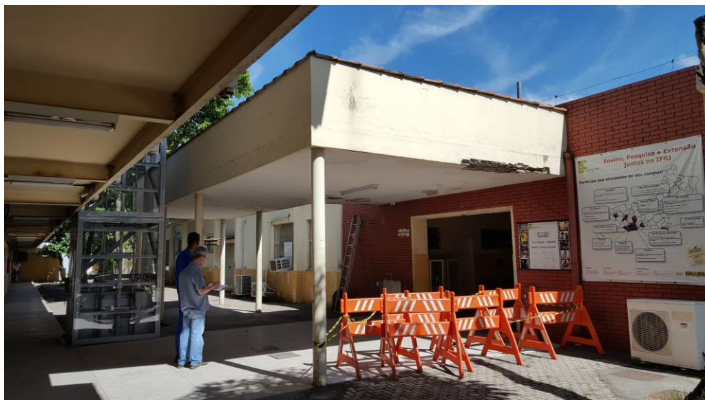
Figura 1: Pórtico a ser demolido, Campus IFRJ-Volta Redonda, RJ.