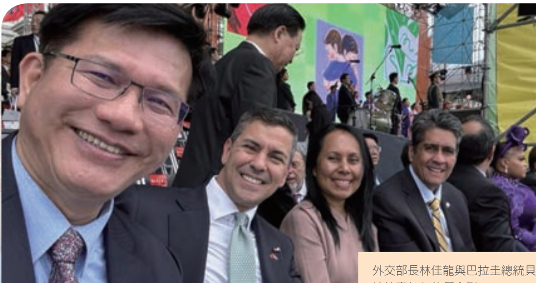
外交部長林佳龍與巴拉圭總統貝尼亞、帛琉總統惠恕仁伉儷合影