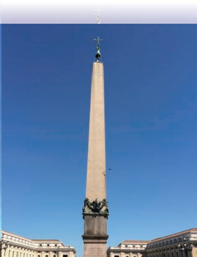
▲聖彼得廣場上的埃及方尖碑