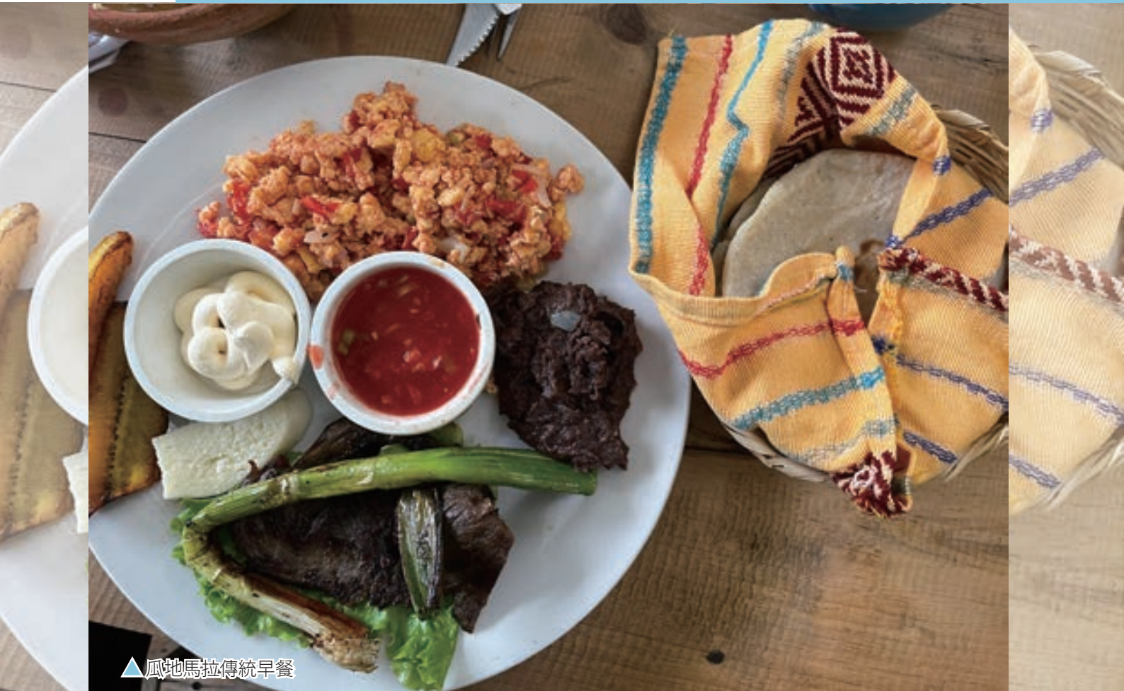
▲瓜地馬拉傳統早餐