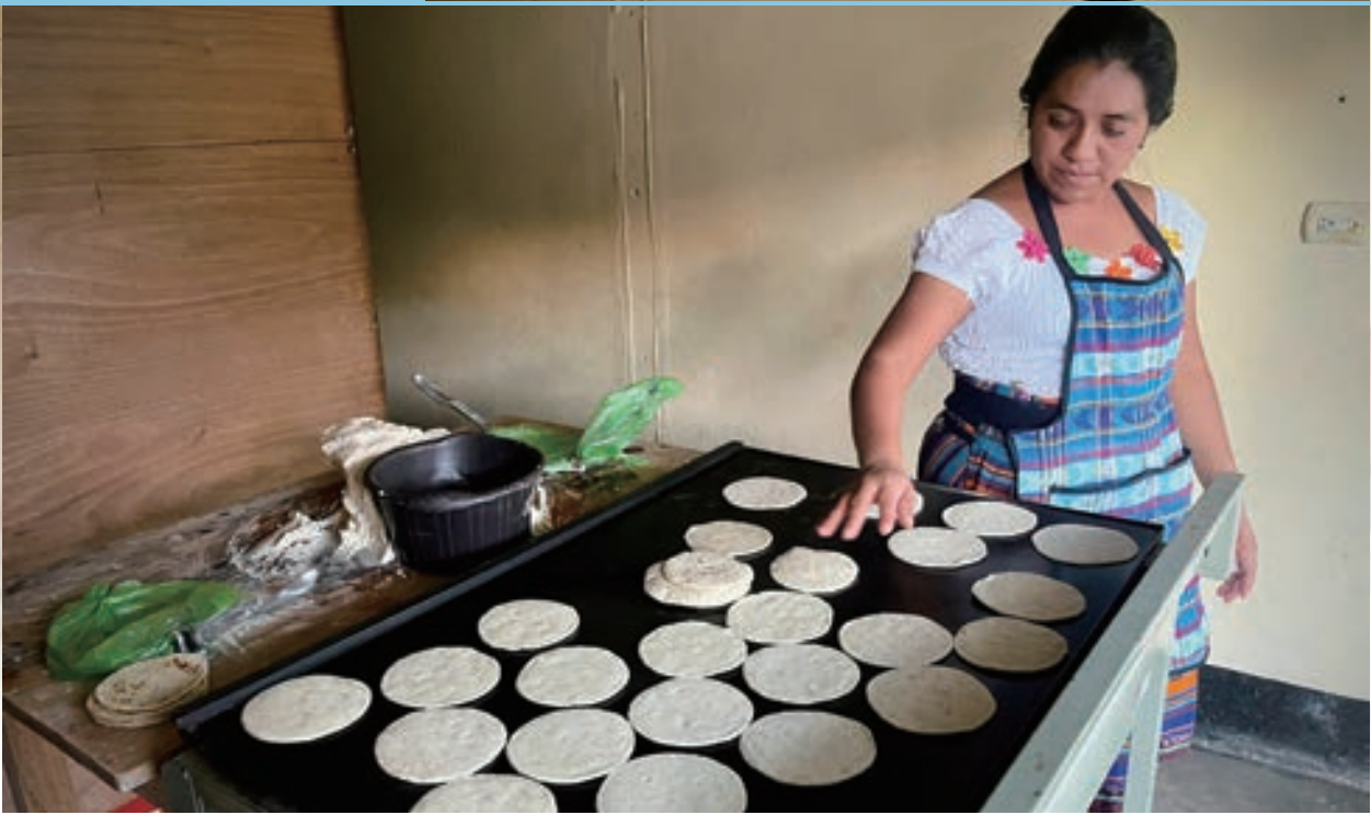
▲ 玉米餅製作的過程

玉米的食品不僅見諸於玉米餅的製作，玉米粽 (Tamal) 也是中南美洲非常受歡迎的傳統美食，由玉米粉、豬肉、雞肉等其他餡料與香料、辣醬的混和，吃下一份就會有滿滿的飽足感。玉米粉會先和水、鹽、豬油等混合形成麵團，再擀成外皮包住內餡的豬、雞肉，以及帶有香料風味的辣醬，最後塑形成橢圓形，以香蕉或玉米葉包起來放進大鍋裡蒸煮，吃法就和吃粽子一樣，把外葉剝開就可以享用。對我來說，玉米粽就像是變化多樣的台式粽子，可以當作節慶時的小吃或者下午的點心，每個家庭都有自己的獨門秘方，口感多元豐富。