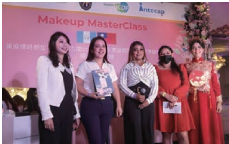
▲ 2023年「後疫情時期協助拉丁美洲及加勒比海經濟復甦暨婦女賦權計畫」創業培訓