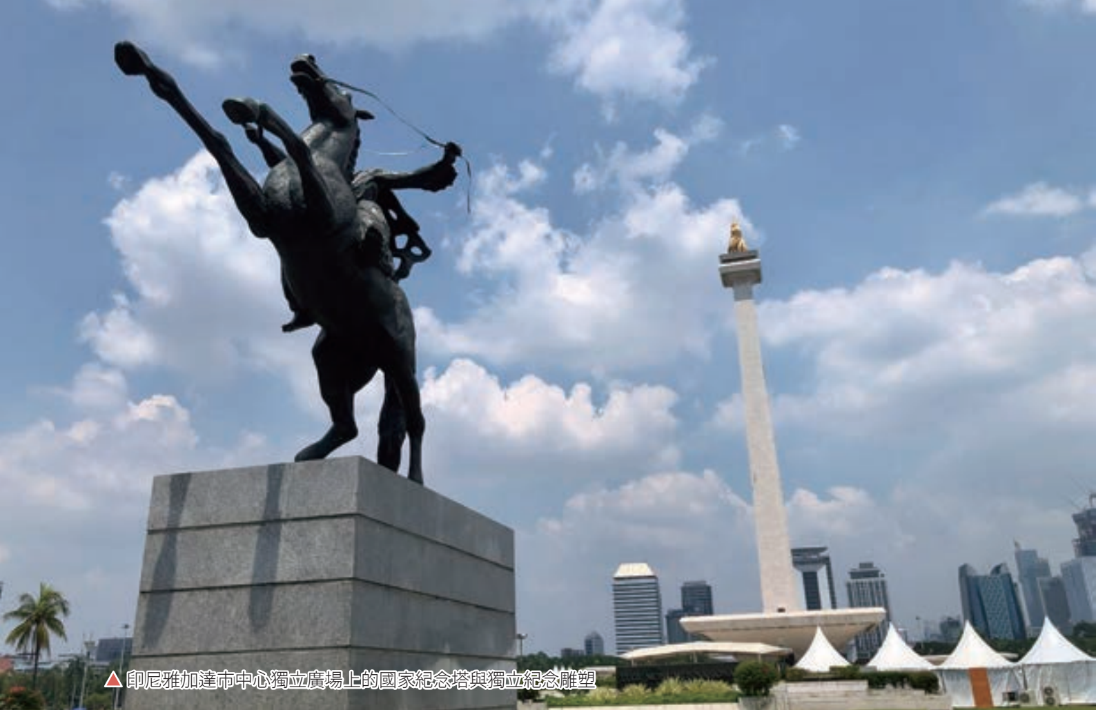
▲ 印尼雅加達市中心獨立廣場上的國家紀念塔與獨立紀念雕塑