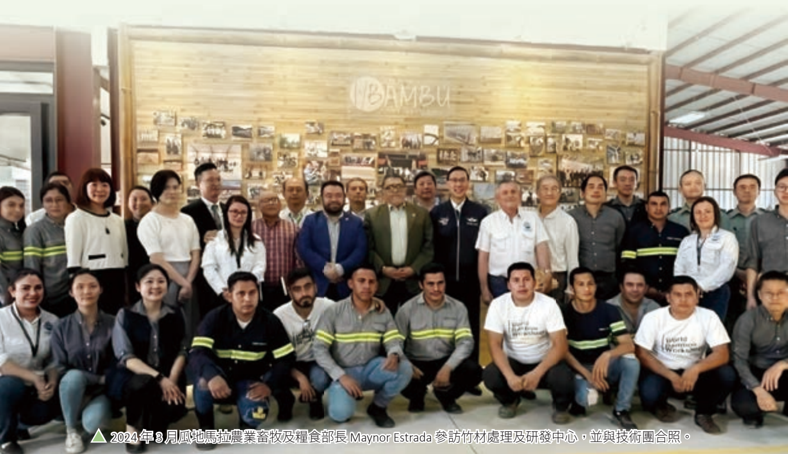
▲ 2024 年 3 月瓜地馬拉農業畜牧及糧食部長 Maynor Estrada 參訪竹材處理及研發中心，並與技術團合照。