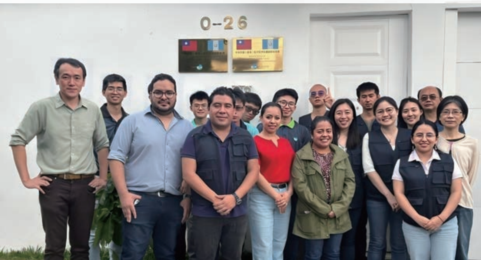
▲ 駐瓜地馬拉技術團團部