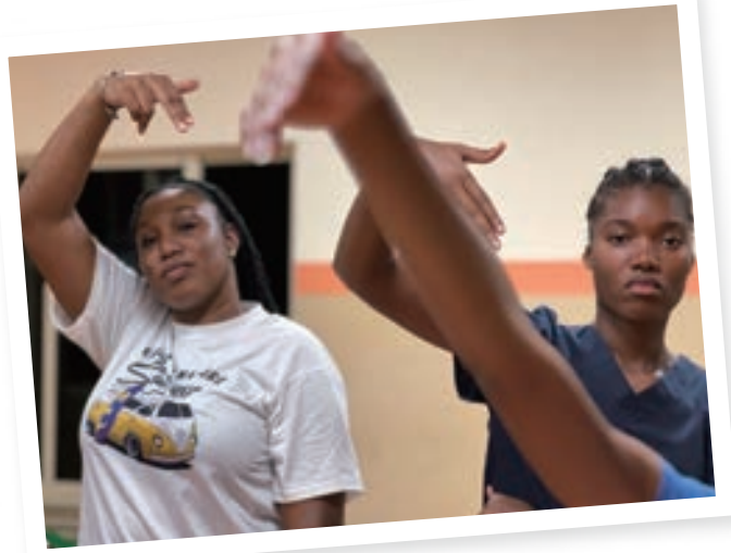
▲ 學生專注排練饒舌歌動作

在中文課上，我試圖用各種方式提供一個有趣、充滿創造力和支持的學習環境。可以肯定地說，透過集體創作饒舌歌，他們不僅牢記了方向詞語，而且這部作品讓本班的成員彼此更加親近。