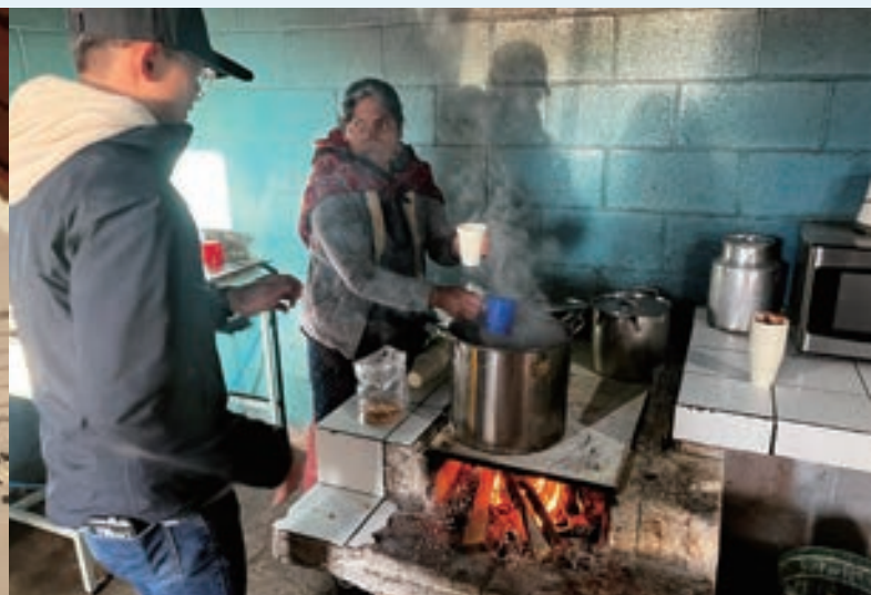
▲ 傳統馬雅婦女在廚房烹煮咖啡