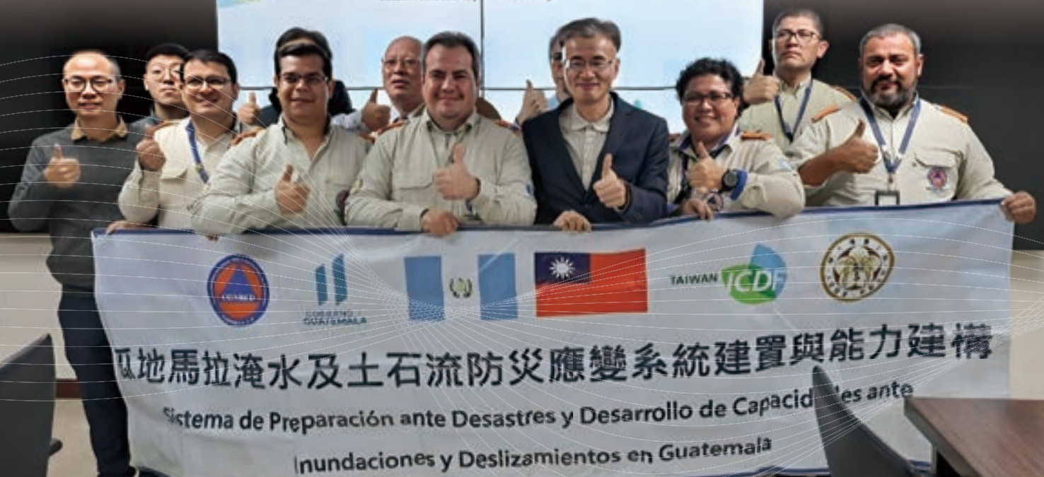
▲ 2023 年瓜地馬拉「國家防治災害協調中心」(CONRED) 專業技術人員赴台接受防災教育訓練

瓜地馬拉「國家防災協調中心滯變部門」與桃園市政府 防災經驗交流 Guatemala: Dirección de Respuesta de la SE-CONRED and Taoyuan City Government Disaster Prevention Experience Exchange