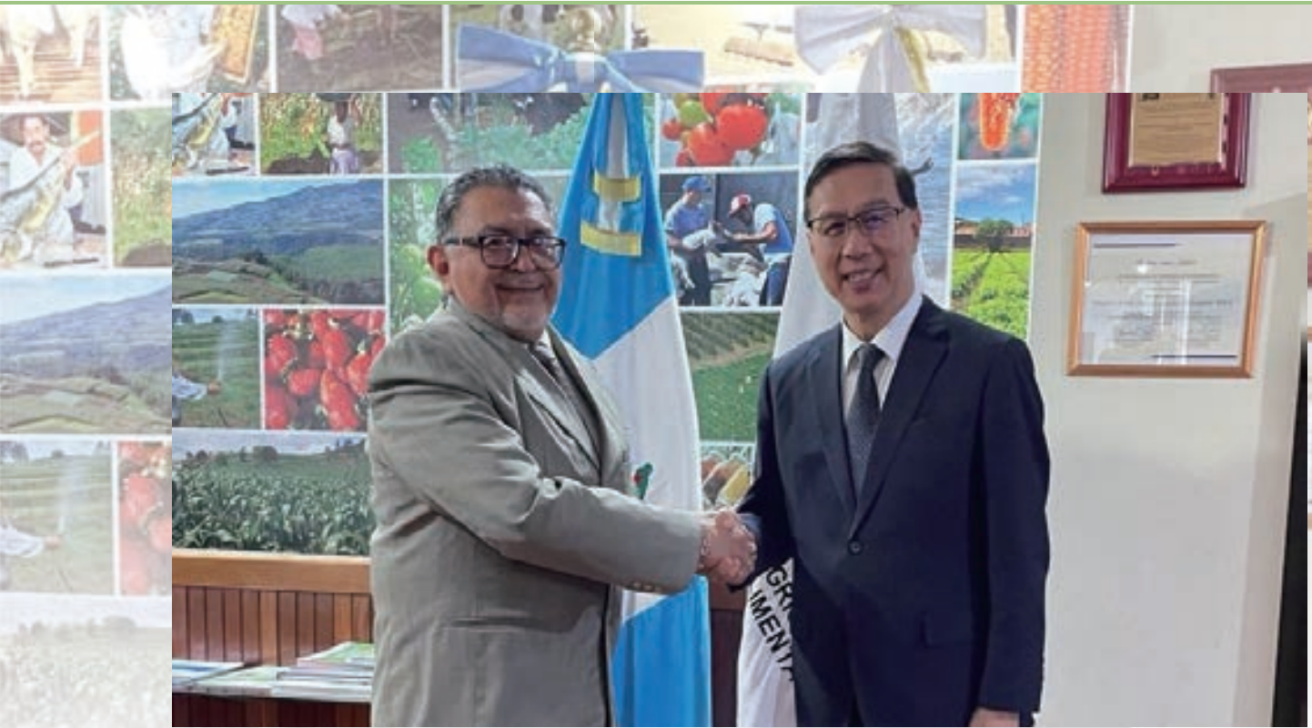
▲ 駐瓜地馬拉曹立傑大使拜會瓜國農業畜牧及糧食部長 Maynor Estrada