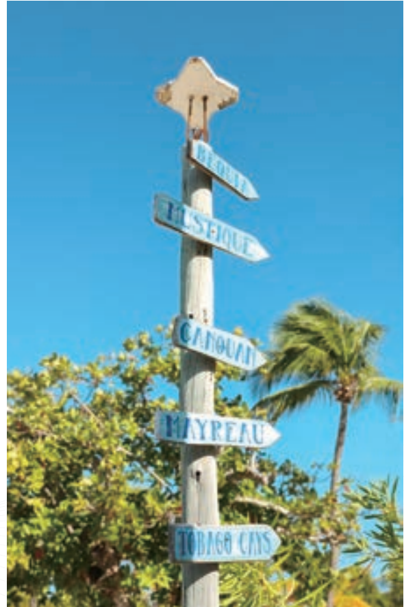
▲ 指標含括格瑞那達的主要島嶼

小船駛抵棕櫚島，他們準備在此轉乘一艘遊艇，前往目的地多巴哥群島 (Tobago Cays)，據稱那片海域中孕育著一種極其稀有的動物，也正是一行人的心之所向。