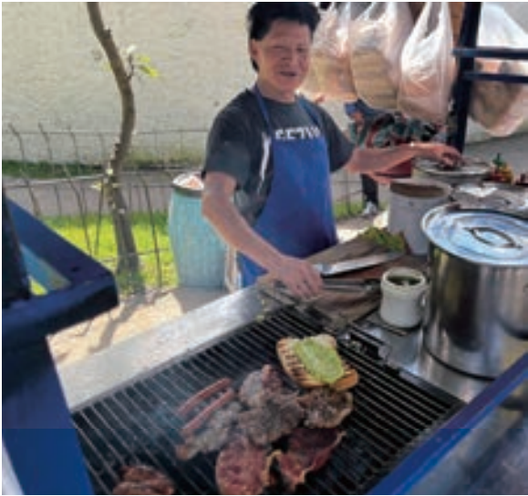
▲餐車老闆製作瓜式潛艇堡

時間還沒有到中午，在瓜國的街道、鄰近超市旁就會出現許多餐車陸續在備餐，替工作了一個早上的上班族準備現烤的瓜式潛艇堡 (Shuco)。熱狗、烤牛肉、烤雞、烤醃豬肉在餐車的烤網上滋滋作響，均價一份 15 至 20 瓜幣 (約台幣 60 元) 的麵包夾肉是快速又便利的選擇。攤販會將烤好的肉先放置一旁，接著將長條的麵包橫切放在烤網上兩面烤過，再依據顧客喜好放上洋蔥碎、塗抹一層店家自製的酪梨醬、醃菜、以及紅色的番茄醬和綠色的辣椒醬，拼組在一起就是經濟實惠又好吃的夾肉堡。