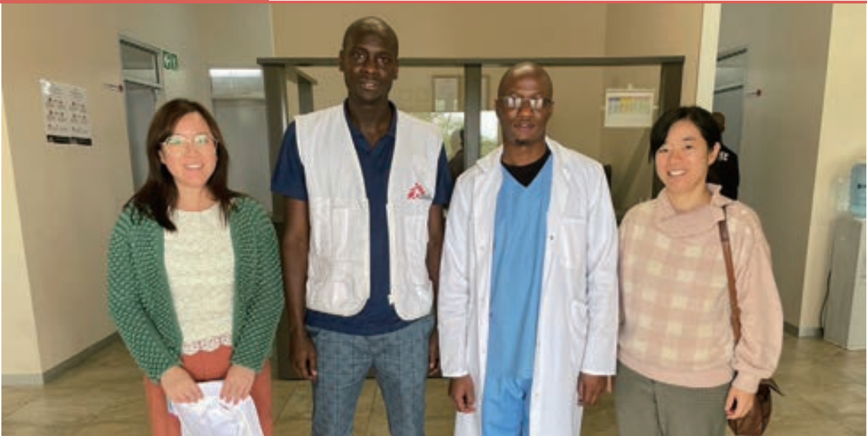
▲ 史國的醫學教育開花結果：義守大學醫學系畢業生經史國教學團在地訓練多年後，錄取成為無國界醫師的一員，與有榮焉！