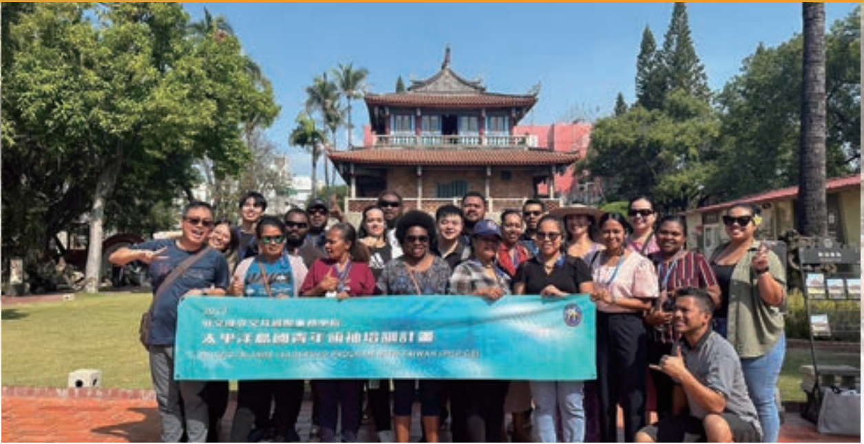
▲ 學員參訪台南赤崁樓

居民在文化傳承及環境保育等事物上深有共鳴，雙邊均感受到深切的文化連結，使當日交流氣氛倍感溫馨，亦展現台灣與太平洋島國間特殊的文化紐帶。