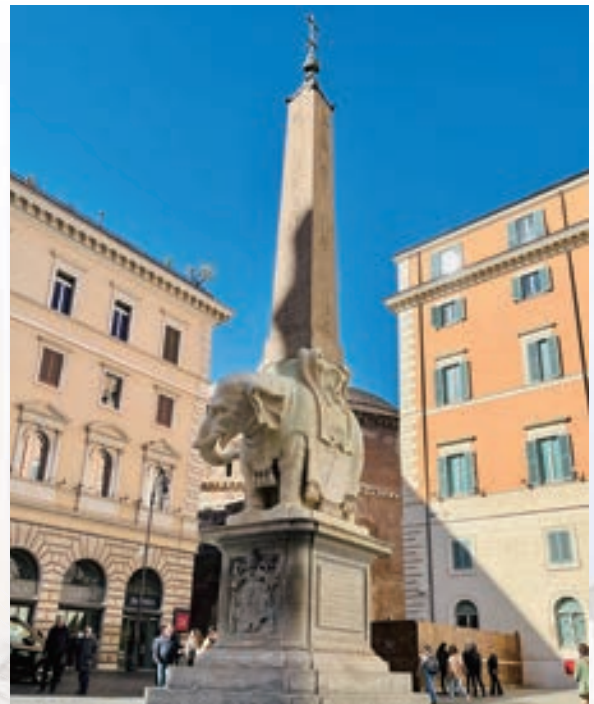
▲ 這座最小的埃及方尖碑被一隻可愛的大象背負著

西元 1667 年教皇亞歷山大七世 (Alessandro VII) 特聘名雕刻大師貝尼尼設計有智慧象徵的大象雕塑，由貝尼尼和他的學生完成，並在方尖碑尖頂加上這位教皇的家徽銅飾。