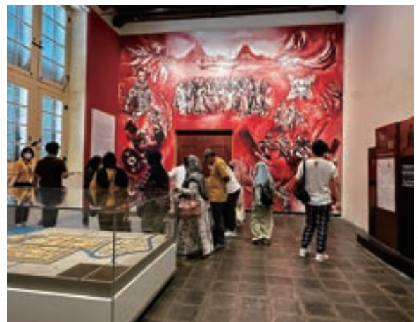
▲ 前身為荷蘭東印度公司巴達維亞市政廳和總督府的雅加達歷史博物館展出印尼人民爭取獨立並遭鎮壓的巨型壁畫

話」，亦是其他國家境內馬來族 (Melayu) 的「母語」，而馬來民族不僅生活於馬來西亞，在現今的印尼蘇門答臘島、泰國南部、新加坡及汶萊等區域亦有許多原住馬來民族，但這些在馬來西亞國境外出生及成長的馬來族人，並非全部來自「馬來西亞」這個國家，因此不能將「馬來語」視為專屬且僅限於馬來西亞。