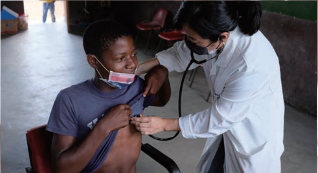
▲ 每月醫療團成員至偏鄉舉辦義診及贈米，關懷鄉里，頗受好評。

我秉持著「授人以魚不如授人以漁」的觀念，希望能將神經內科知識和技能傳承於史國的醫學教育中。我於門診均特別指導住院醫師，讓他們從最初的病史詢問、神經學檢查、用藥調整、影像判讀，全程都能參與其中。凡有特殊身體特徵或病理表現，則會加強討論。期望縱使有一天我離開此地，知識和技能也不會失傳，病人仍能找到足以信賴的神經科醫師。