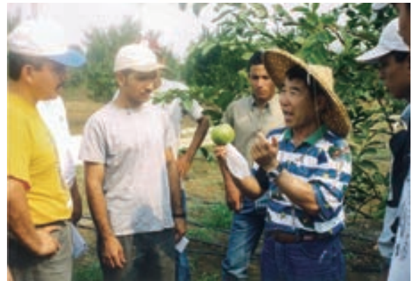
▲ 2003 年駐瓜地馬拉技術團於北碇省 (Petén) 輔導生產番石榴

台灣自 1980 年代起提供瓜地馬拉如竹編手工藝、竹管製作家具與竹建築農用設施的相關技術協助，一步一腳印，演變至今。下一個階段重點則是擺在提升瓜國竹產業工業化技術和精緻度，所以在 2021 年 6 月建置竹材處理及研發中心，並營運迄今。