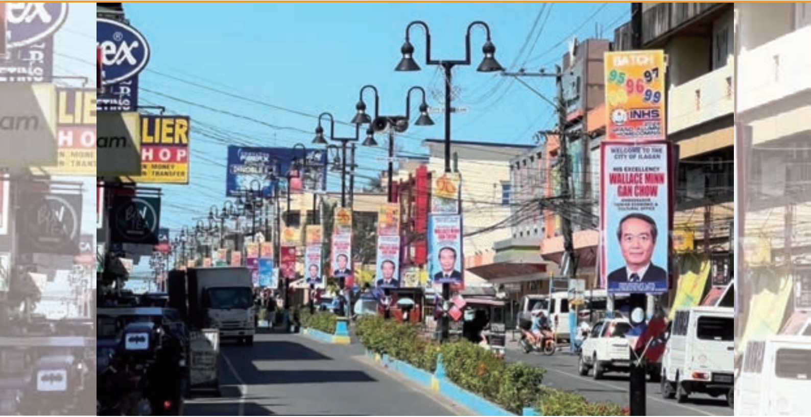
▲ 伊莎貝拉省 Ilagan 市道路兩側掛滿歡迎周大使海報

不過大部分人所不知道的是，這三個北呂宋省分其實是菲律賓重要的農產品生產地，也具有豐富的觀光資源，尤其北呂宋地區與台灣淵源深遠，地理距離最短，氣候相近，並有南島民族的血緣連結，兩地相似度高。例如位於菲律賓西北角之北伊羅戈省，其作物與台灣的雲林縣高度重合，卡加延河谷（涵蓋卡加延省及伊莎貝拉省）則處處可見花東縱谷的影子，加上兩國飲食文化相近，可快速複製我國農業成功經驗。此次本處周民淦大使夫婦於 2024 年 2 月偕同筆者與我國臺灣技術團 (TTM) 專家應邀考察該三省當地農業與觀光資源，獲當地政要熱烈歡迎，行程收穫豐富。