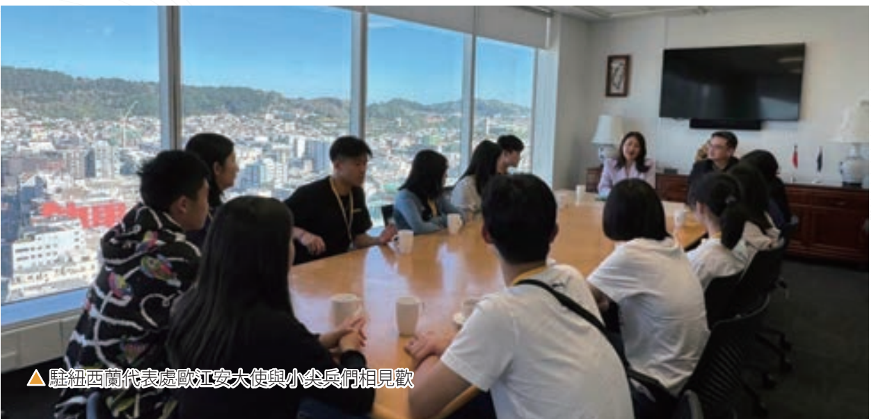
▲ 駐紐西蘭代表處歐江安大使與小尖兵們相見歡

紐西蘭自然景觀豐富且文化獨特，有著「活的地理教室」之美名，訪團首先抵達首都威靈頓，駐紐西蘭歐江安大使即與大家見面，並熱情分享了許多紐國的政治、經濟與文化知識，讓訪團成員對於紐國的一切有了新的認識。歐大使端莊又不失幽默的談吐，讓小尖兵們深為「傾倒」，大家也在期待中展開紐國的一系列行程。