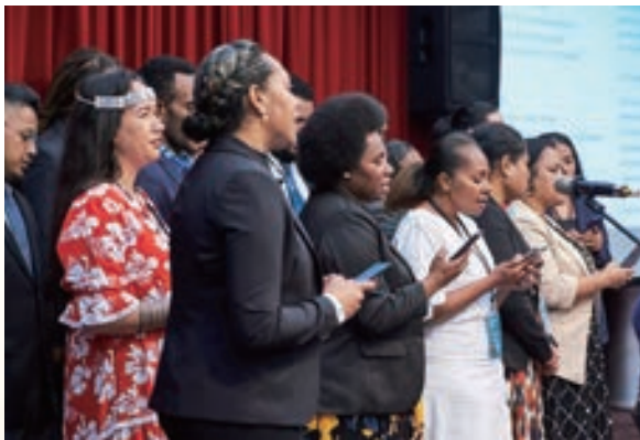
▲ 參訓學員合唱斐濟民謠 Isa Lei，為在台 6 週的訓練課程做了溫暖的結尾。

未來我國也將持續與各理念相近國家攜手，在穩定區域和平及保護環境資源上，進一步深化彼此的實質合作，使台灣成為區域和平穩定的舵手，同區域各國互惠互利、共存共榮。