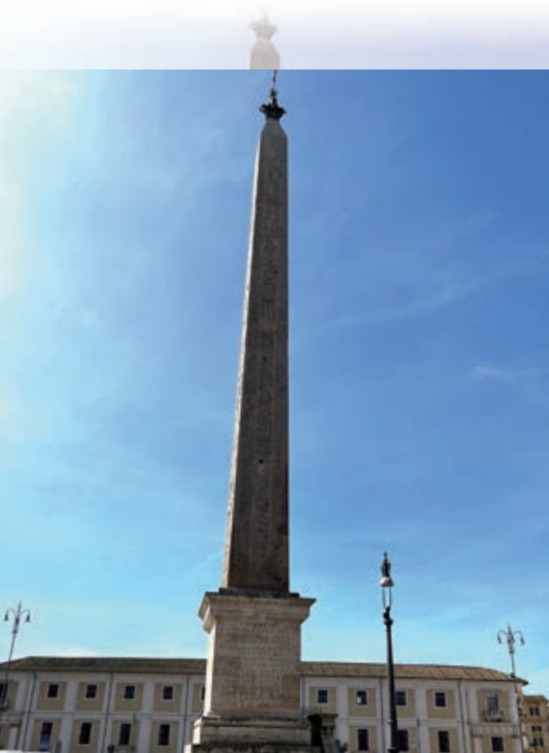
▲羅馬現存最古老、最高的埃及方尖碑

這是現存整個大羅馬 (含梵蒂岡城) 地區唯一無刻字和圖案埃及方尖碑，據說碑文是後來被去除成光滑的花崗岩碑面。