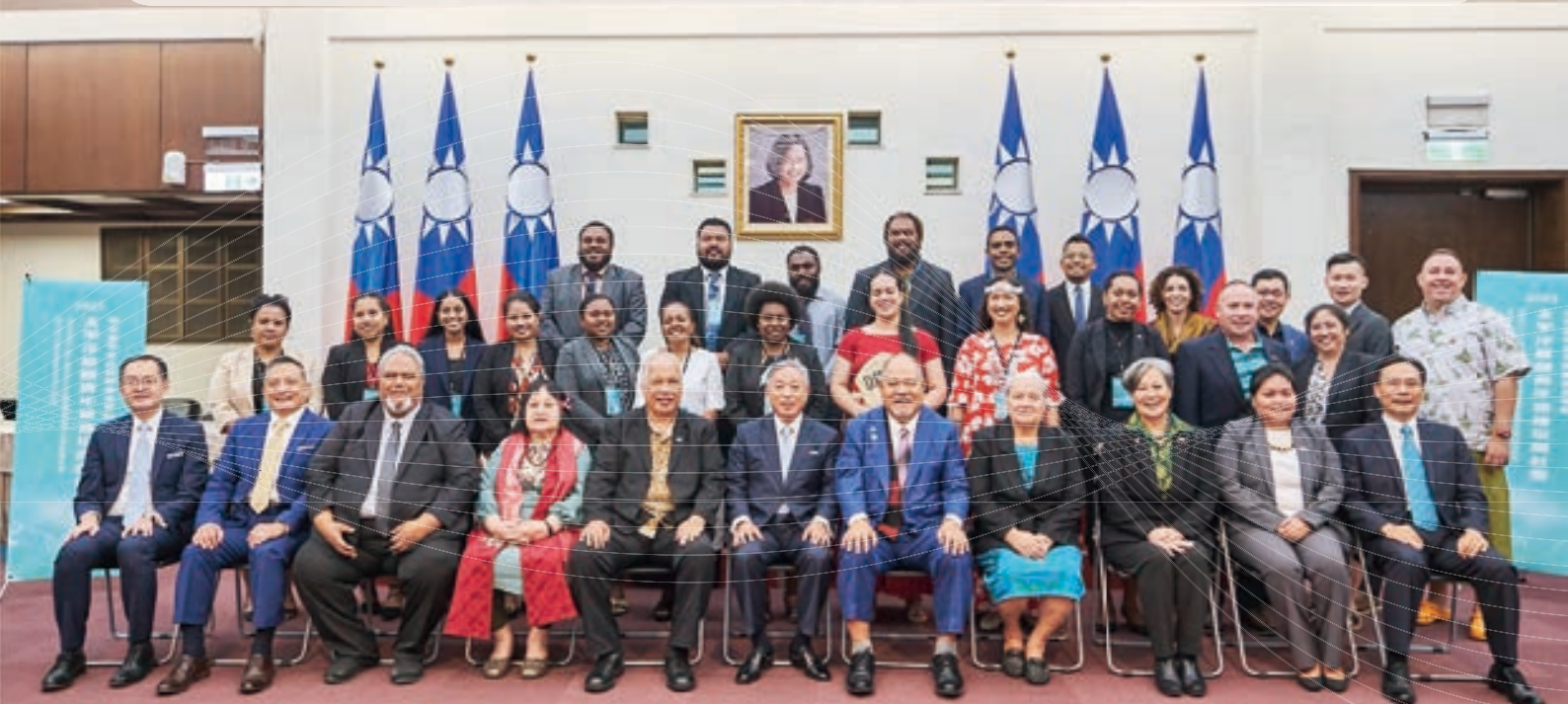
▲ 第 8 屆「太平洋島國青年領袖培訓計畫」順利結訓