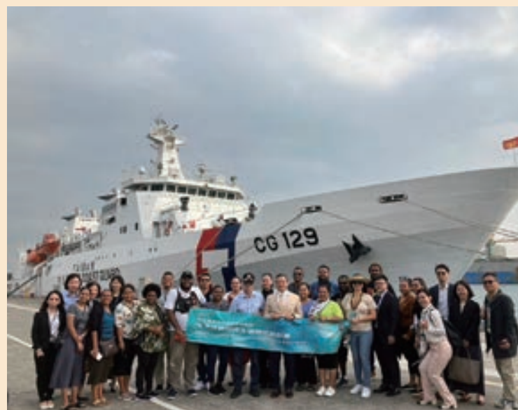
▲ 外交及國際事務學院李副院長及學員訪團於海巡艦前合影

安全、海洋資源保育、海廢回收及海岸巡防等議題交換意見，並登上海巡艦，讓學員進一步瞭解我國海洋安全設施。透過此次參訪機會，讓學員們得以認識到，同為海洋國家的台灣，對於海洋政策之重視，以及我國海洋委員會職掌及政策。