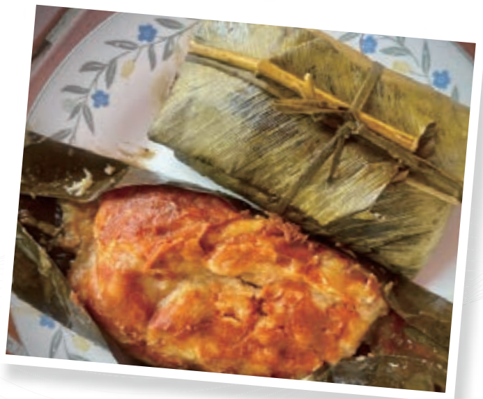
▲ 中南美洲特色食物，以玉米為基底的玉米粽。

方形的小乾酪、中美洲特有的新鮮酸奶油與番茄莎莎醬作為蘸料，有的店家還提供多一片烤肉的升級選擇，再配上前面提到的玉米餅，可說是瓜國必嚐的道地餐點。在役期的假日，我和同梯的役男夥伴常前往瓜地馬拉最知名的速食連鎖店 Pollo Campero 用餐，這間速食店除了提供炸雞外，早餐的選項也包含瓜國的早餐拼盤，值得作為大家嘗試當地早餐的第一站！