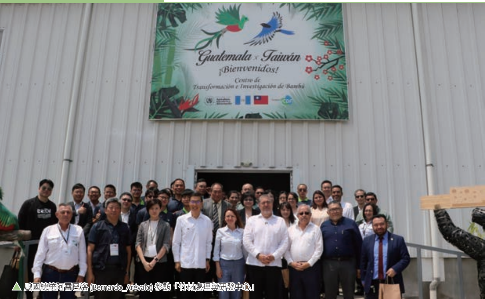
▲ 瓜國總統阿雷巴洛 (Bernardo Arévalo) 參訪「竹材處理與研發中心」