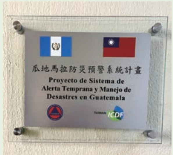
▲ 2024 年 3 月「瓜地馬拉防災預警系統計畫」進駐瓜國「國家防治災害協調中心」(CONRED)

驗。「瓜地馬拉防災預警系統計畫」在此身經百戰的基礎上，透過導入台灣防災科技，與瓜國合作尋找符合他們需求的解決方案，有效因應。