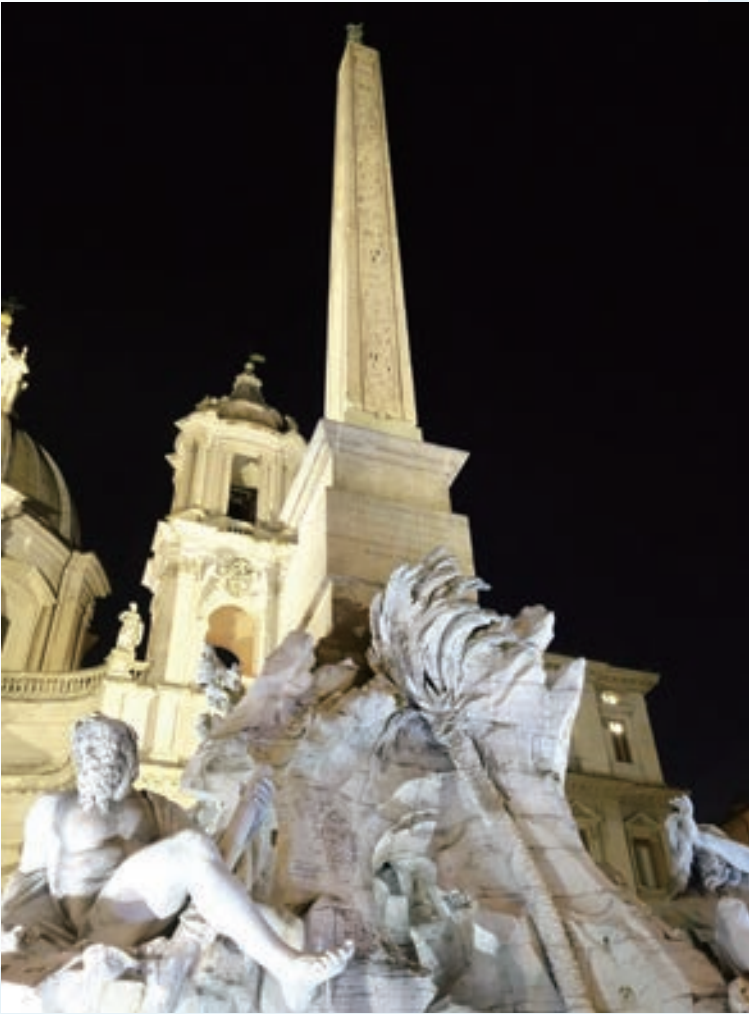
▲ 四河噴泉上的方尖碑夜景頗為浪漫