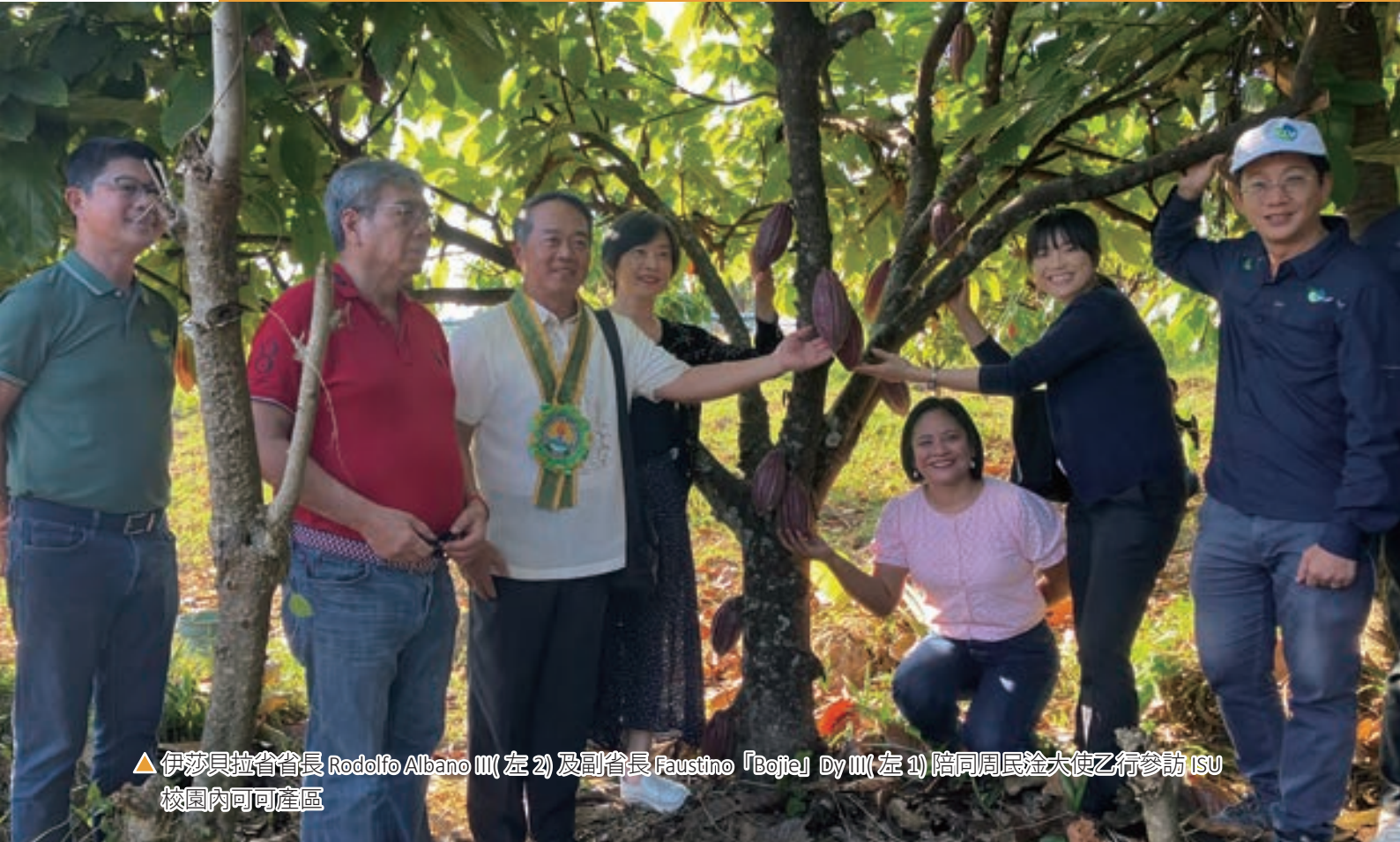
▲ 伊莎貝拉省省長 Rodolfo Albano III(左 2) 及副省長 Faustino 「Bojie」 Dy III(左 1) 陪同周民淦大使乙行參訪 ISU 校園內可可產區