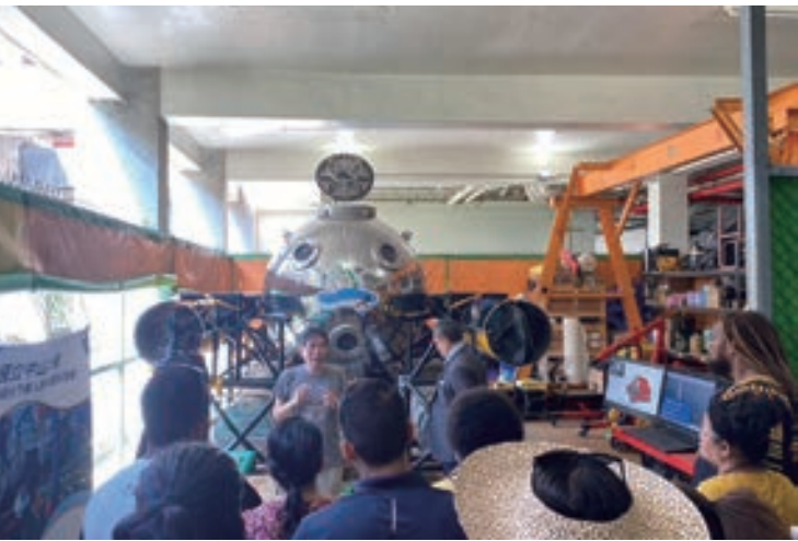
▲ 國立中山大學海洋科學研究院向學員展示我國第一艘 MIT 迷你潛艇

此外，李副院長續於隔日率團拜訪國立中山大學海洋科學學院。當日中山大學熱情款待學員，並展示了用於海洋研究的各項設備。其中，由中山大學所開發的自製迷你潛艇是我國海洋科學研究重要的里程碑，學員均興奮地進入設備中參觀。學院師生亦簡報分享包含對減碳海洋植物的研究等豐富成果，並與學員們進行學術問答，加深太平洋島國青年與我國海洋科學研究學者之間的交流。