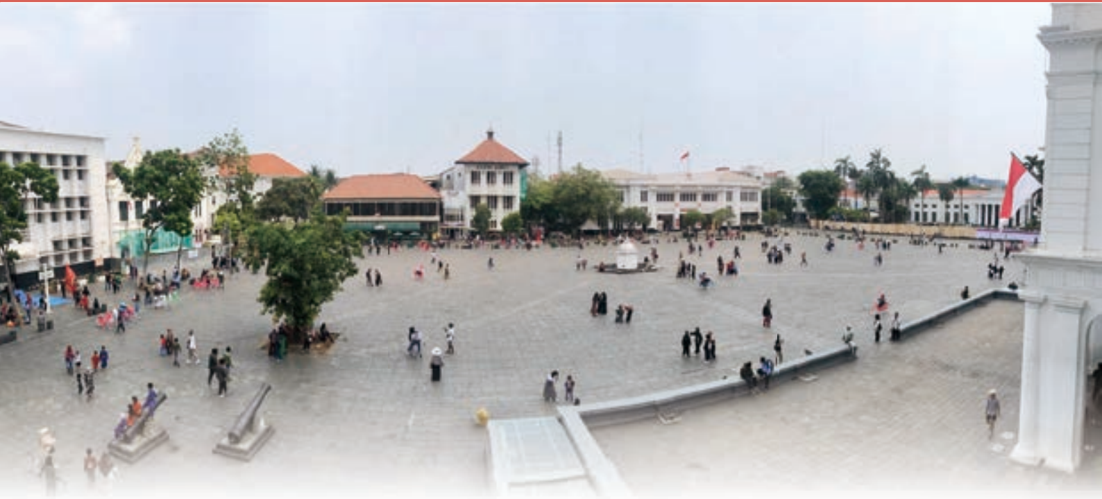
▲ 荷蘭東印度公司 (VOC) 巴達維亞總督府 (現為雅加達歷史博物館) 前方的法塔喜拉廣場