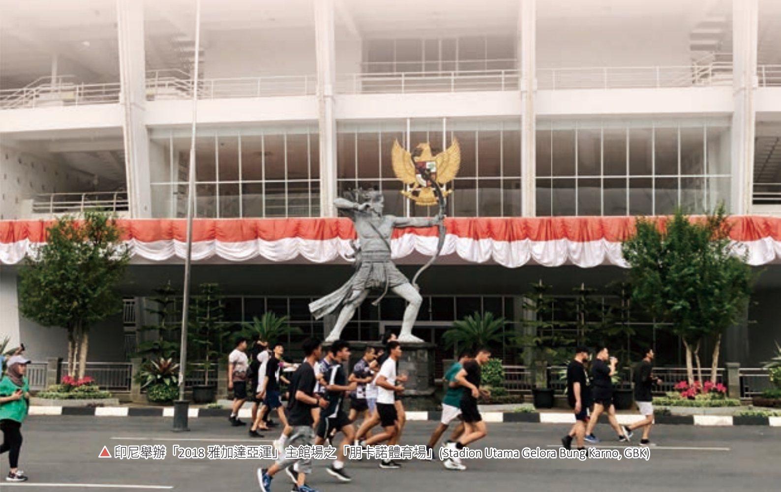
▲ 印尼舉辦「2018 雅加達亞運」主館場之「朋卡諾體育場」(Stadion Utama Gelora Bung Karno, GBK)

最終印尼為達到擺脫殖民統治、爭取獨立建國和實現國家統一的終極目標，因此滿懷國族主義的領導菁英，決定不以印尼主體民族使用的母語：爪哇語（約 7,550 萬人使用）或巽他語（約 2,000 萬人使用）作為統一的官話，而是優先考慮以流傳範圍更廣的馬來語作為獨立後的「國語」，從而避免及減少對非主體民族的歧視或不平等現象的發生，藉以打破不同族群之間的溝通障礙，有效促成國內 1,300 多個族群順利融入獨立後的「印度尼西亞共和國」。