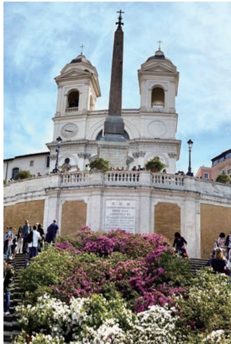
▲ 方尖碑在杜鵑花襯托下顯得柔和

之前提過，羅馬街道的交叉處總是一座廣場接著另一座廣場，廣場上不是裝飾噴泉就是方尖碑，甚至兩者都有。在羅馬有一個特別的四泉路口 (Via delle Quattro Fontane)，由路口向北、西、南分別可以看到山上的聖三一教堂前廣場 (Piazza della Trinità dei Monti)、總統府前廣場 (Piazza del Quirinale)、聖母大教堂後廣場 (Piazza dell'Esquilino) 的三座方尖碑，這是在現今世界上唯一的奇景，若有機會到羅馬旅遊千萬別錯過喔！