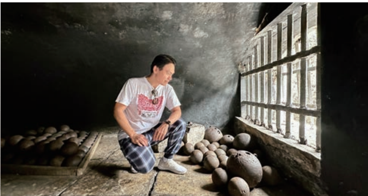
▲ 筆者造訪曾關押印尼國父蘇卡諾的荷蘭東印度公司巴達維亞總督府 (現為雅加達歷史博物館) 地牢及當時限制囚犯行動用的腳藤鐵球

2023 年 11 月 20 日在法國巴黎舉行之第 42 屆「聯合國教科文組織」(UNESCO) 大會，正式通過將印尼語 (Bahasa Indonesia) 定為該組織可使用之會議用語，成為繼英語、阿拉伯語、華語、法語、西班牙語、俄語、印地語、義大利語及葡萄牙語後的第 10 種官方語言。