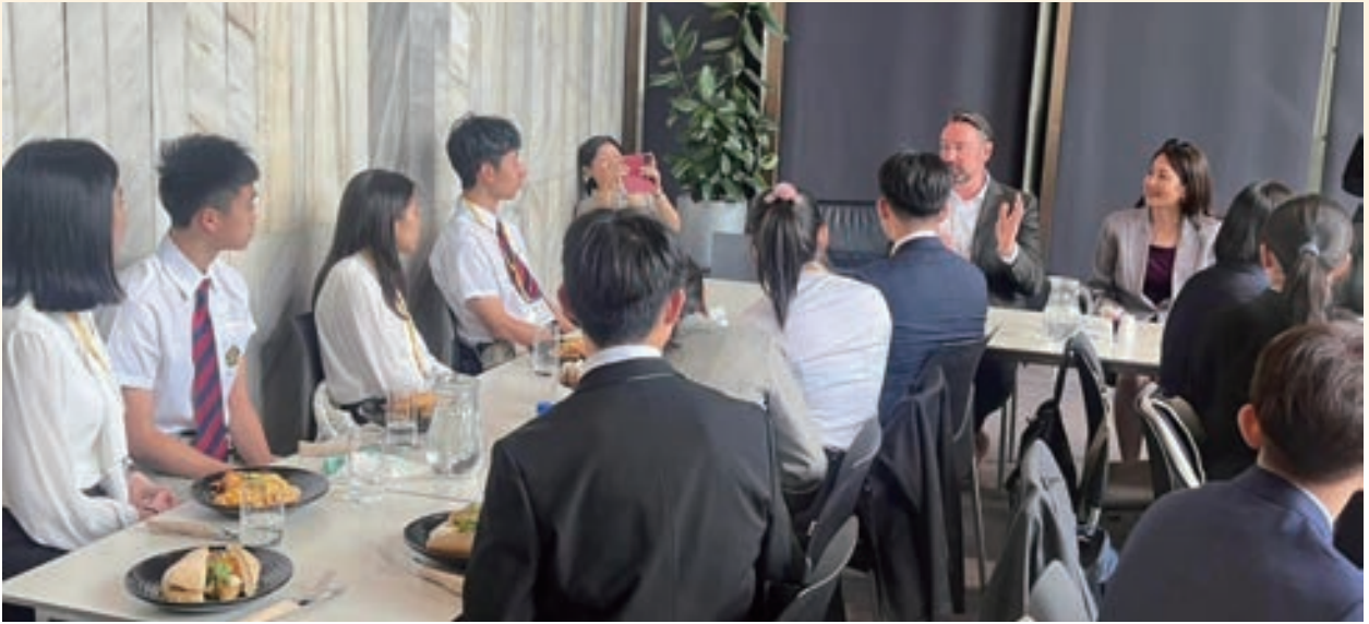
▲ 訪團成員與紐西蘭國會議員進行交流