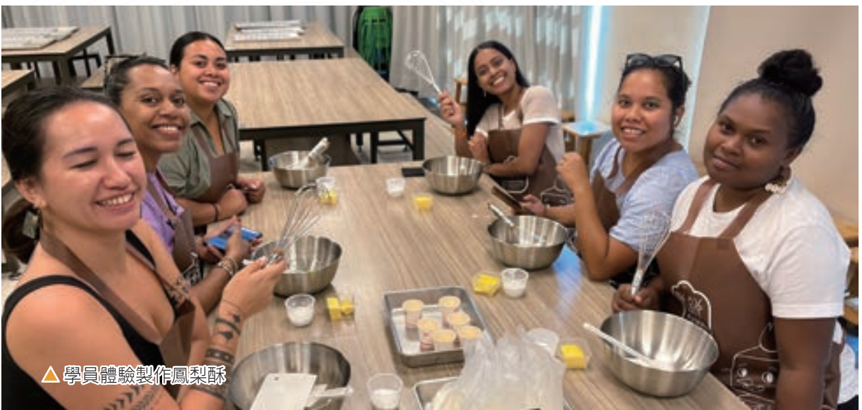
▲ 學員體驗製作鳳梨酥

為讓學員體驗台灣在地文化的魅力，並與台灣人民深入交流，課業之餘，外交學院亦動員多位同仁帶領學員參訪 101 大樓、台北象山及台南大東夜市，並安排搭乘台北雙層觀光巴士，遊覽街頭風景。部分學員們更親身參與了彩虹大遊行、天母萬聖節等活動，與台灣人深入交流。學員對於能親身體驗台灣日常生活，實際與我國當地民眾互動，均感到十分高興。