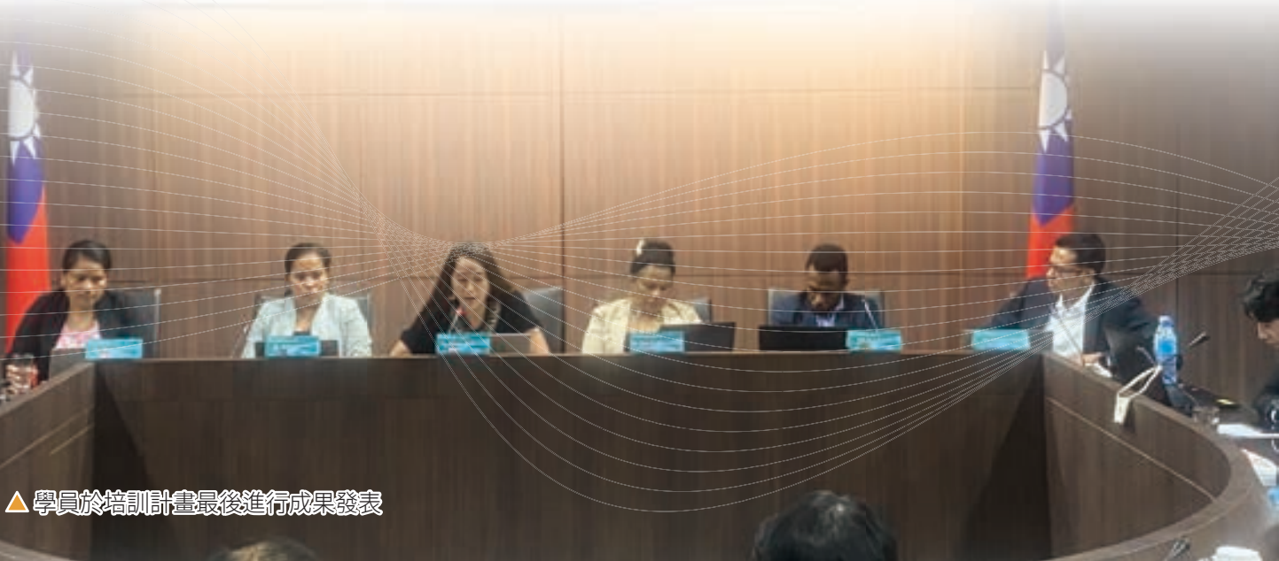
▲ 學員於培訓計畫最後進行成果發表

在田政務次長主持下，11 月 29 日於外交部舉行了「2023 年太平洋島國青年領袖培訓計畫」結訓典禮暨歡送茶會，外交學院亦邀請太平洋友邦駐台使節以及美國等駐台使節與代表，共同見證 12 個太平洋島國共 19 位青年領袖結訓。美國東西中心院長蘇珊妮 (Suzanne Vares-Lum) 夫婦更特別來台出席結訓典禮，表達對結訓學員的重視與祝福。