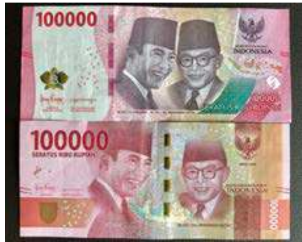
▲ 印有印尼第一任總統蘇卡諾及副總統哈達頭像的 10 萬印尼盾之新、舊版紙鈔 (其上帶有印尼國名全稱「印度尼西亞統一共和國 (Negara Kesatuan Republik Indonesia, NKRI)」)

印尼教育暨文化部長納迪姆·馬卡里姆 (Nadiem Makarim) 曾發表聲明反對馬來西亞首相沙比里 (Ismail Sabri) 提出將馬來語列為東南亞國家協會 (ASEAN) 第二官方語言之建議，他表示：「印尼語在歷史、語法和語言學方面都佔優勢，將印尼語視為東協官方語言更為可行；印尼語在國際上已經成為東南亞最廣泛使用的語種」。