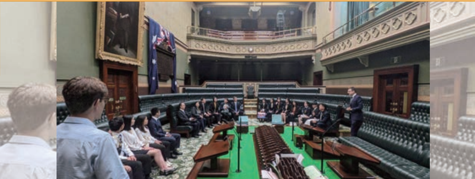
▲ 外交小尖兵們實際模擬議會運作情形

在我國駐紐西蘭代表處、駐雪梨辦事處及駐奧克蘭辦事處的用心安排下，外交小尖兵們與澳洲及紐西蘭的各界人士進行有趣且極具意義的互動，除了交流更加瞭解澳紐兩國的政治制度及歷史脈絡外，同時也將我國的文化軟實力如美食及音樂等，介紹給兩國友人，在小尖兵們的努力下，台澳、台紐之間的友誼橋樑更加堅固，友好關係更上一層樓。