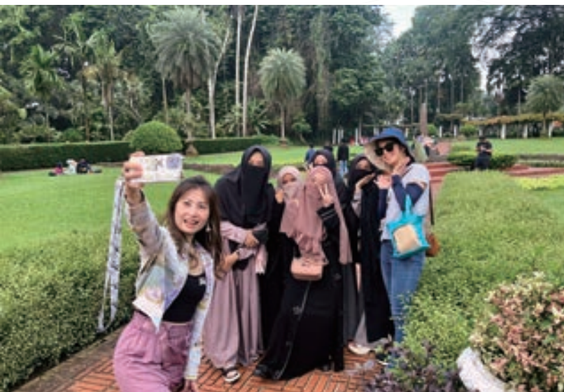
▲ 印尼國內約有 1,340 個族群彼此信仰雖然不同，但能和諧相處共同追求獨立後的國家統一。

對於追求「大一統」的印度尼西亞而言，將不同族群融合為統一的「國族」尤為重要，其過程是實現民族認同到國族認同的轉變，「國族化」並不排斥各個族群的原生特性，但更重視在同一政治與地域空間內相互依存、同生共榮的一致性，因此在整合過程中，需要藉由一套符號，使得原本狹小和局部的民族認同，轉換歸屬於一個更大的國族認同，以所謂的「國家利益」來超越個別民族的族群利益，最後達到一個不斷增加權力共管與政治文化同質的終極目標；因此，首要任務就是必須找出國族內的主體民族與非主體民族的利益共同點，整合出一種對國家忠誠取代對民族忠誠的昇華概念，同時國族內的主體民族也必須不斷自我完備，並時刻顧及非主體民族的本位感受，如此才有能力與自信採取傾向非主體民族的寬容政策，最終形成「想像的政治共同體」以爭取共同的「國家利益」。