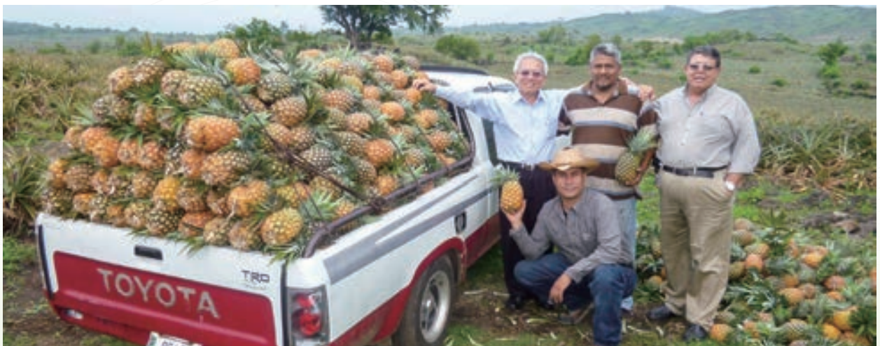
▲ 2014 年駐瓜地馬拉技術團輔導鳳梨產銷班提升銷售