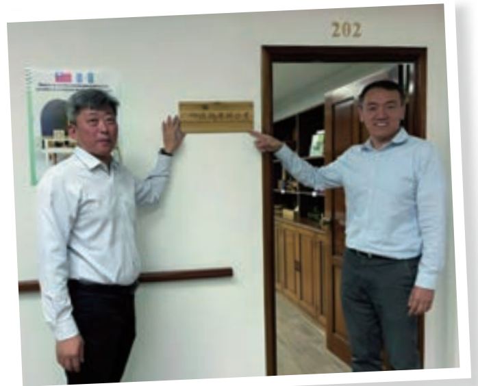
▲ 駐瓜地馬拉技術團在大使館設立展示辦公室

點，將技術團帶進大使館。本即一家人的大使館跟技術團，這雙手現在握得更緊了，這不就是「我泥中有你、你泥中有我」嗎？