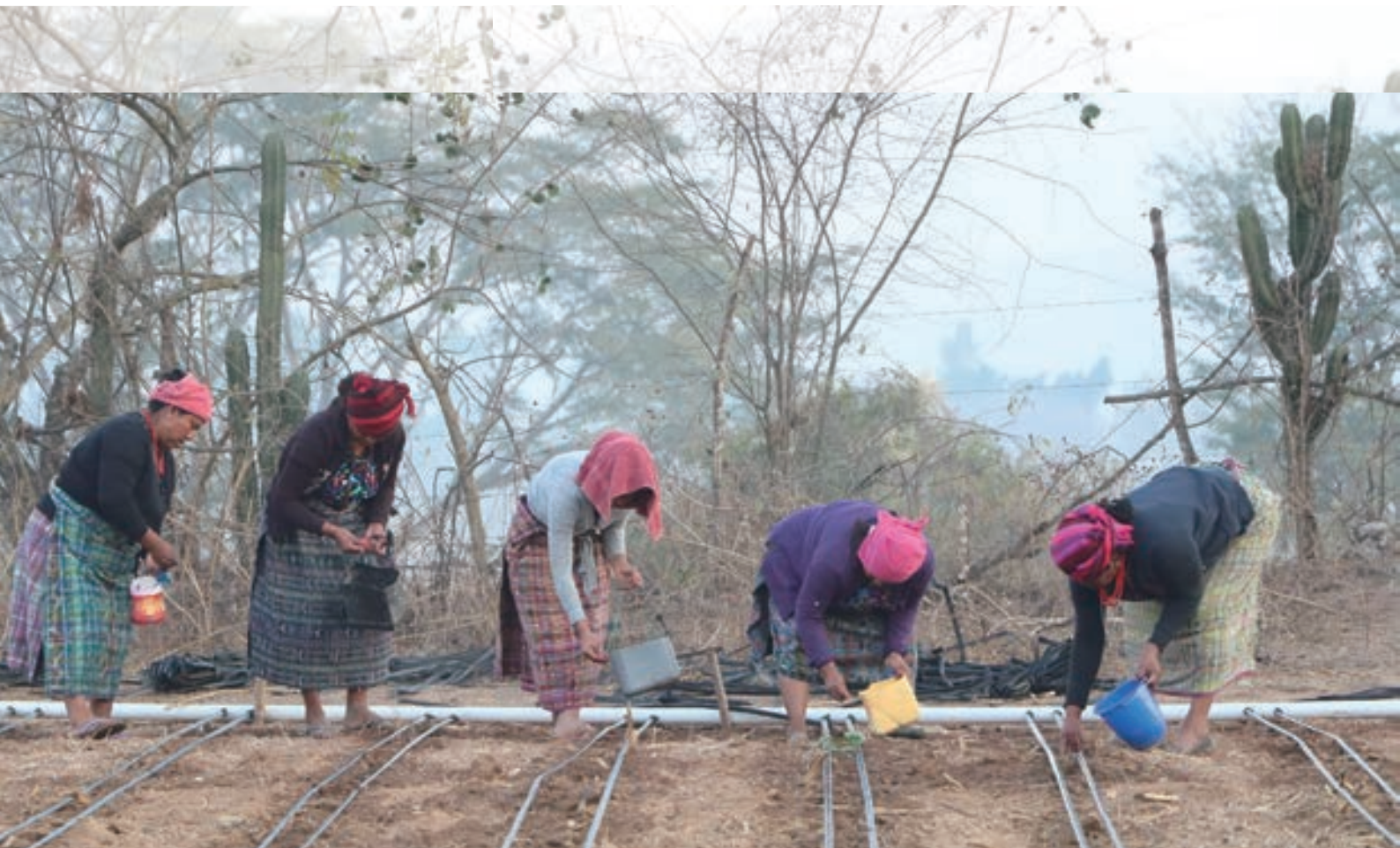
▲ 穿著傳統服飾進行農活的馬雅婦女

我是一個熱愛美食與文化的農業青年，在瓜地馬拉生活的過程從飲食開始就使我想要更加認識這個文化，這裡的料理樣樣都征服了我的胃，進而讓人想一探其背後的文化與歷史，是如何匯聚成現代我們所見的樣子。很高興可以和大家分享這段我在瓜地馬拉經歷的寶貴經驗以及自己的所見所聞，也邀請各位有機會可以造訪這個以馬雅色彩與歐洲宗教歷史所孕育的國家。