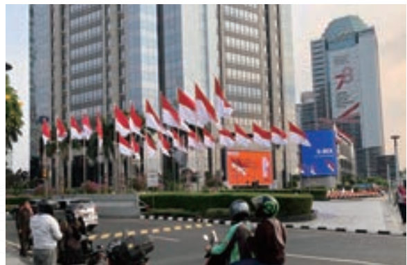
▲ 印尼國營獨立 (MANDIRI) 銀行總部為慶祝 78 週年獨立而張貼巨幅精神標語

所有語言的發展都離不開國家政治權力的中心。最初馬來語的權力中心是在廖內和柔佛一帶，其後隨著廖內的權力中心轉移到荷蘭人殖民的巴達維亞 (即雅加達)，而柔佛的權力中心則移轉到英國人控制的吉隆坡，因此兩地語言經過一段長時間的各自發展，立足於雅加達的馬來語，除了受到群島語言的直接影響外，也融合了大量的荷蘭語，而