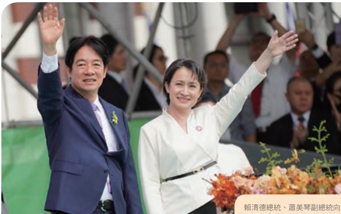
賴清德總統、蕭美琴副總統向大家揮手致意

包括來自史瓦帝尼、馬紹爾群島、帛琉、巴拉圭、貝里斯、聖露西亞、聖文森及格瑞那丁、吐瓦魯、聖克里斯多福及尼維斯、瓜地馬拉、教廷與海地等友邦，以及與我們理念相近的國家，如美國、日本、新加坡、澳洲及歐洲國家的代表們計 51 團 508 位外賓來台觀禮，新任外交部長林佳龍也開心迎接這些外國貴賓。