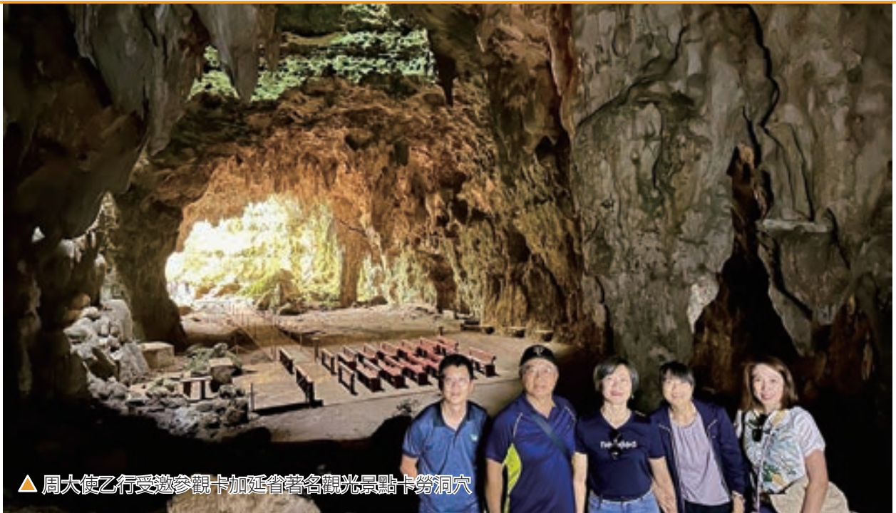
▲ 周大使乙行受邀參觀卡加延省著名觀光景點卡勞洞穴

我們的第二站來到卡加延省，卡省位於菲律賓呂宋島東北端，於 1581 年建省，土地面積 9,003 平方公里，是菲律賓的第三大省。省會是土格加勞市 (Tuguegarao City)，全省人口 1,268,603 人 (2020 年統計)，該省經濟以農業及農產品加工、漁業為主，大部分地區地勢平坦，水利灌溉設施發達。同時，由於該省海岸線較長，漁業資源非常豐富，交通運輸方便。