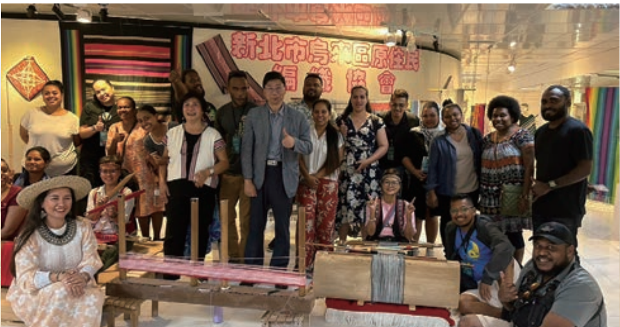
▲ 學員拜訪新北市烏來部落，並與當地編織協會交流。

烏來部落為泰雅族部落，部落人民堅持與山林共存、愛護環境的生活方式，和太平洋島國人民與海洋共生、對抗氣候變遷的信念吻合。在一整日的互動中，學員們與部落