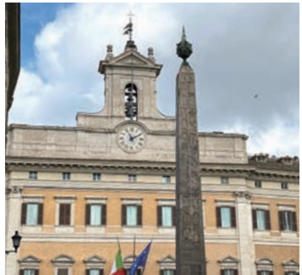
▲ 眾議院前的埃及方尖碑