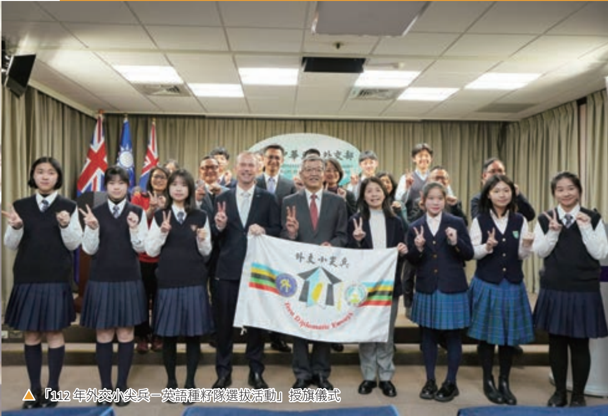
▲「112 年外交小尖兵—英語種籽隊選拔活動」授旗儀式