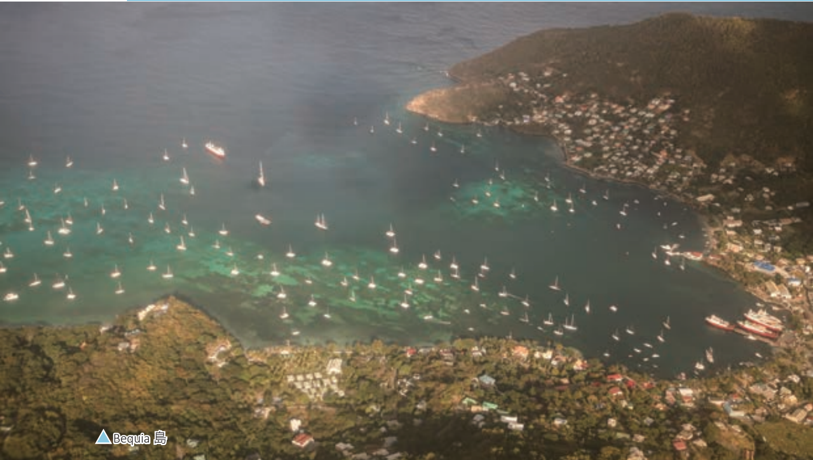
▲ Bequia 島