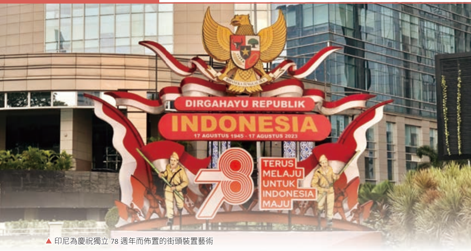
▲ 印尼為慶祝獨立 78 週年而佈置的街頭裝置藝術