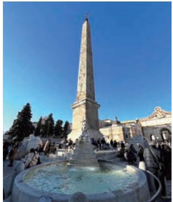
▲ 人民廣場上的方尖碑原本立於大競技場

西元前 10 年，奧古斯都從埃及赫里奧波里斯 (Heliopolis) 帶回西元前 13 世紀塞提一世 (Seti I) 和拉美西斯二世 (Ramesses II) 法老時期的方尖碑，原本也是豎立於大競技場，在西元 1589 年同樣由教皇西斯都五世下令遷於人民廣場；直到 19 世紀，這座方尖碑四周始另加上 4 隻獅子雕像裝飾。