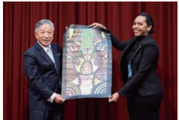
▲ 斐濟籍學員代表全體參訓學員致贈外交部政務次長兼外交及國際事務學院院長田中光紀念品