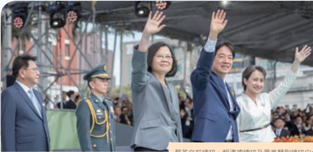
蔡英文前總統、賴清德總統及蕭美琴副總統向大家揮手致意