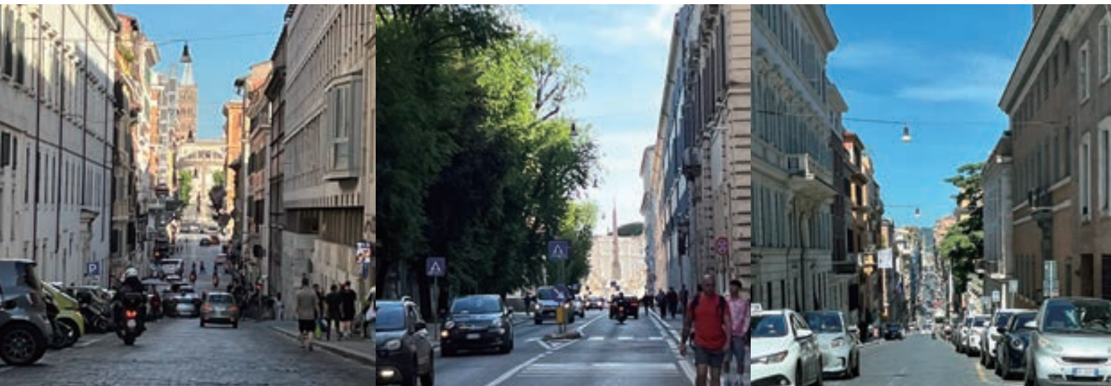
▲ 由四泉路口向北、西、南分別看到山上的聖三一教堂廣場、總統府廣場、聖母大教堂後廣場三座方尖碑