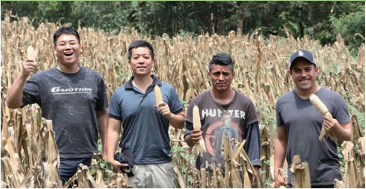
▲ 2023 年「強化玉米生產韌性計畫」農民採種田收成

科技防災的優勢在於它的即時性與精確性，這個計畫在瓜國北部 Alta Verapaz 省具有高氾濫風險的 Cahabón 河流域建置 3 座自動化水情觀測站，同時開發災害早期預警資訊平台，應用物聯網 (IoT) 與人工智慧 (AI) 技術預判災害，另一項則是結合無人機新興科技以紅外線和多光譜相機空拍水體和植被變