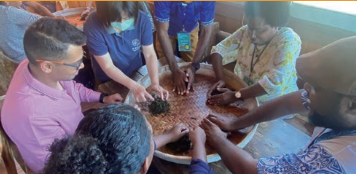
▲ 學員至貓空體驗我國製茶與品茶文化

我國遠近馳名的美食名產亦是重要軟性實力。本屆課程特別安排學員與友好國家外交人員華語班一同參與手作鳳梨酥的活動，體驗台灣知名特產的製作過程。此外，也安排學員搭乘纜車到貓空製作茶葉及品茶，藉此讓學員瞭解我國重要農產品—茶葉的產銷過程，並從中體驗中華茶文化。