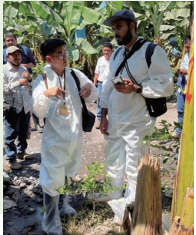
▲ 2023 年「中美洲區域香蕉黃葉病防治計畫」 — 田間監測

該中心以分享過去台灣在農業轉型輕工業之產業鏈發展經驗為出發點，藉著導入台灣農工業加工技術、know-how 與設備，利用竹材資源，經加工處理製成具高附加價值的竹積層板材，同時結合產品符合潮流的設計元素，開發如竹地板、精緻平滑的竹桌與竹椅等各式竹板產品，希望能在未來促成竹中心的商業運轉，整合強化整體竹產業更具規模，升級瓜國竹產業技術，提升工業製產品的市場競爭能力，並將前述竹製產品外銷至歐美市場，以提升瓜國從事相關產業人民、企業與整體國家收入。