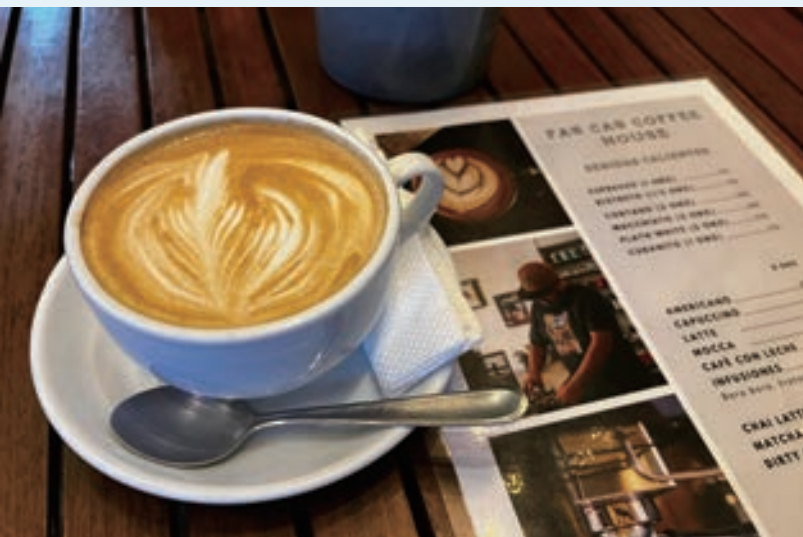
▲ 品嚐一杯安地瓜咖啡

前面提到農業在瓜地馬拉的重要性，擁有大面積的玉米田，使得瓜國人民主食也多以玉米為主。玉米在品種上可以分為鮮食、水煮的甜味種、提供牲畜作為飼料的馬齒種或硬粒種，以及易加工作為爆米花的爆裂種等。瓜地馬拉以硬質的玉米製成著名的玉米餅 (Tortilla) 作為主食，其傳統作法是先將乾燥的玉米粒在水中加熱軟化並洗去玉米表皮，接著於石臼加水磨成團狀，再取小團於雙手掌心來回拍打成圓片狀以鐵板加熱烤製。熱騰騰的玉米餅出現在各式速食或主食中，並以當地具馬雅 (Maya) 色彩的桌巾包覆保溫，增加飽足感。剛做好的玉米餅能從熱氣中間到陣陣玉米香，但玉米澱粉的特性使其在冷卻後的口感變得較硬，因此趁熱吃齒頰留香是我推薦享用玉米餅的最佳方式。