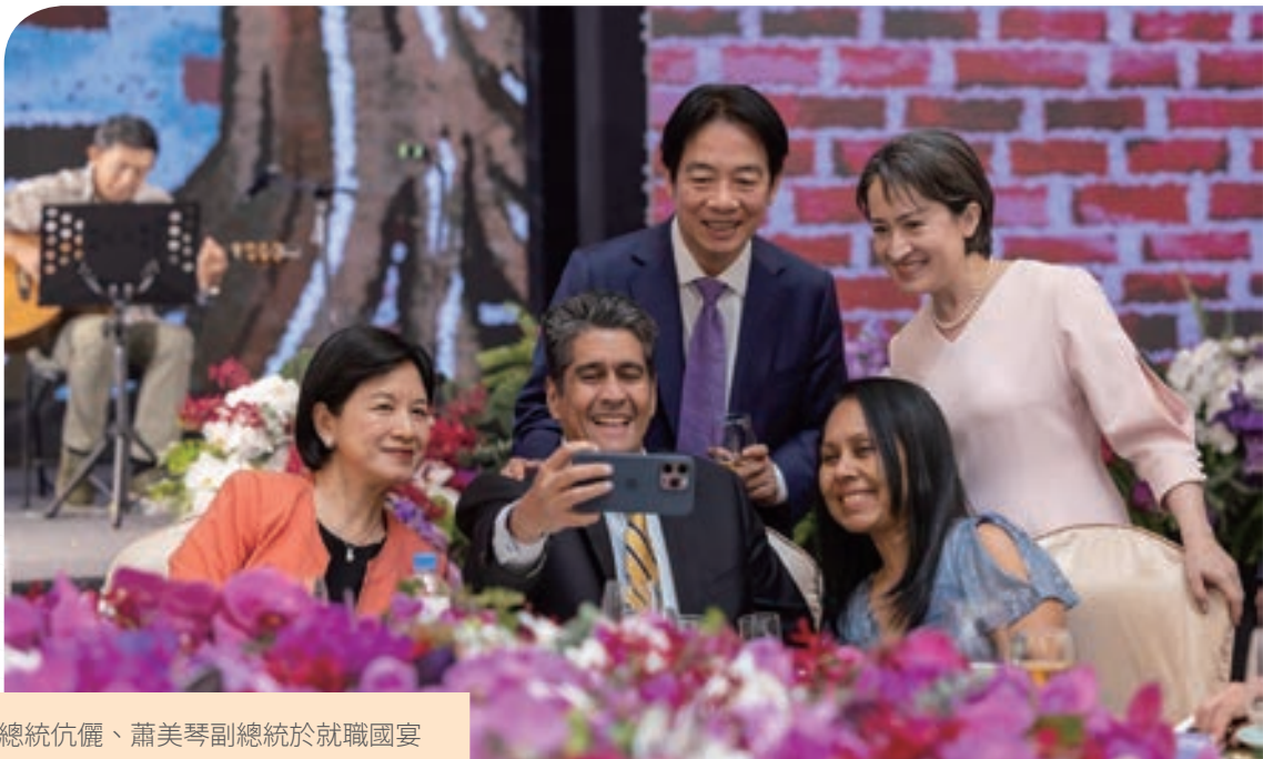
賴清德總統伉儷、蕭美琴副總統於就職國宴上與帛琉總統惠恕仁伉儷自拍