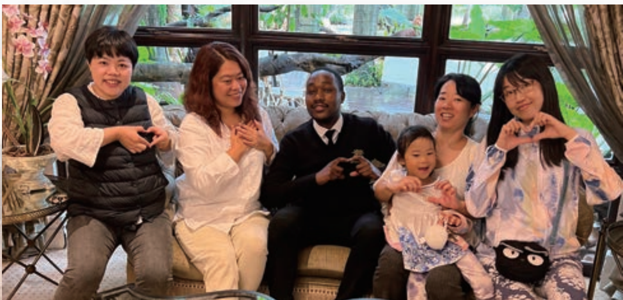
▲ 台灣長期對史瓦帝尼的幫助，讓當地人民銘感於心，台灣與史瓦帝尼手連手、心連心。

走遍世界各國，史瓦帝尼人最窩心，一見我們臉孔，就知道是「台灣人」。接著，每個人都能述說台灣的美好。捐物資的場合，人們稱道：「謝謝台灣常關心我們。」當地朋友說：「我的親戚拿獎學金在台灣讀書，有一天我也想去。」吃著技術團豐收的農產品，女孩說：「台灣種的火龍果又大又好吃。」最令我感動的是病人說：「謝謝台灣的醫師治好我的心律不整，台灣與史瓦帝尼是手連手、心連心的朋友！」