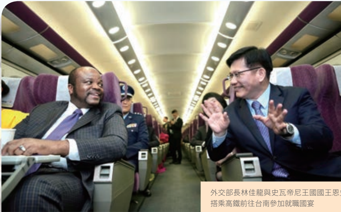
外交部長林佳龍與史瓦帝尼王國國王恩史瓦帝三世搭乘高鐵前往台南參加就職國宴