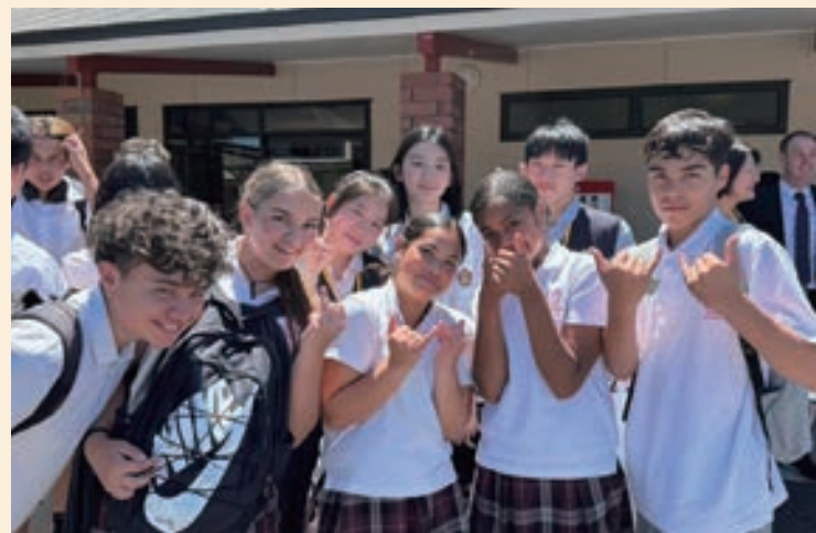
▲ 小尖兵們與天主教中學 John Paul College 當地學生交流合影

當地的人文歷史，而且此趟旅程的主角—外交小尖兵們，也藉由此次難得機會拓展自身國際視野以及培養外交興趣。看見我國的外交新血逐漸萌芽茁壯，此趟旅程的感動不是三言兩語就能完整說明。最後特別感謝外館同仁以及所有前來與訪團交流的人員，相信小尖兵們會把這次參訪所得到的啟發與感動帶回國內，分享給台灣的民眾！