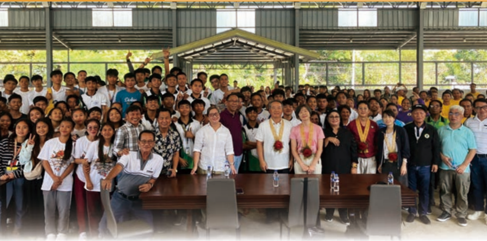
▲ 周大使乙行與卡加延省府轄下農校學生進行座談並於會後合影

室進行會談、與 Tuao 市各地灌溉協會舉行公開座談會、參訪該省遊客中心 (Pavilion Nassiping)、動物育成中心與生態觀光公園 (Zitanga-Ballestero, Cagayan) 等，行程緊湊豐富，Mamba 省長夫婦全程陪同，十分重視我團到訪。