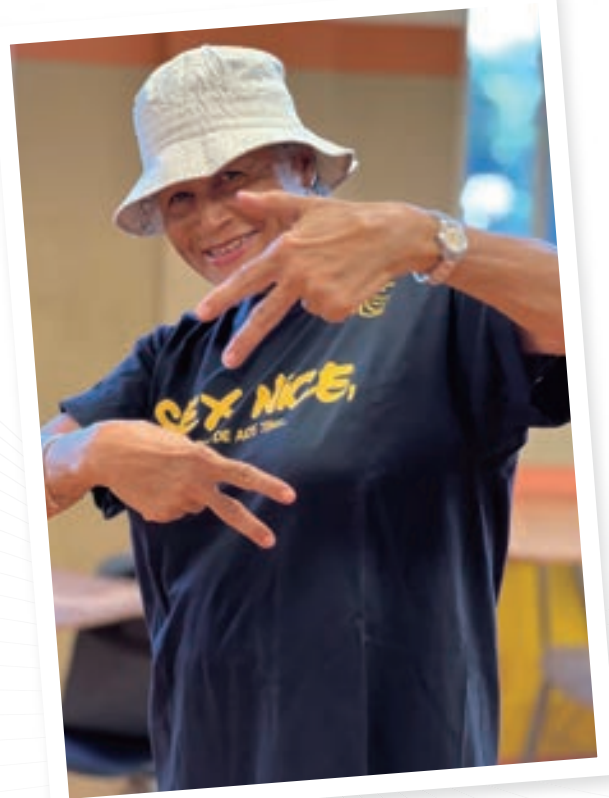
▲ 高齡 74 歲的學生仍充滿學習熱情

饒舌教學的成功在於學生語言能力的提高和學習態度的積極變化。他們從最初的「這也太難了吧」到後來的「原來我也可以做到」，自信心大大增強，對未來學習和成長有深遠影響。總之，將饒舌歌融入中文教學是一種創新的且有效的教育方法。它在輕鬆愉快的氛圍中，激發了學生的創造力和學習熱情，使他們在學習中找到自信和成就感。