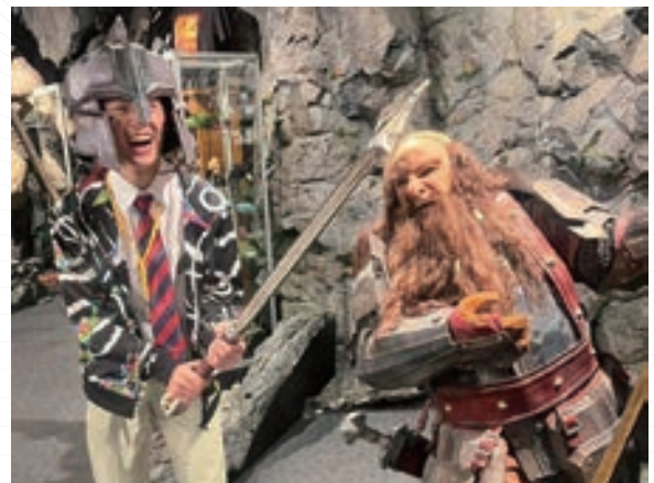
▲ 訪團成員參訪維塔電影特效工作室 (Weta Workshop)