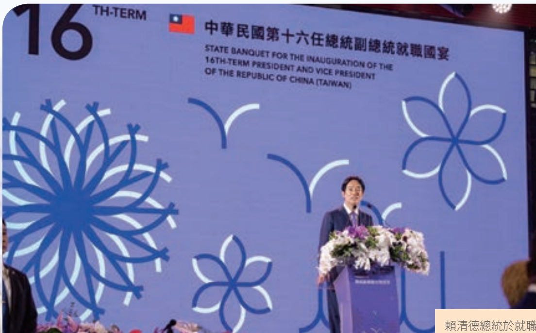
賴清德總統於就職國宴上致詞