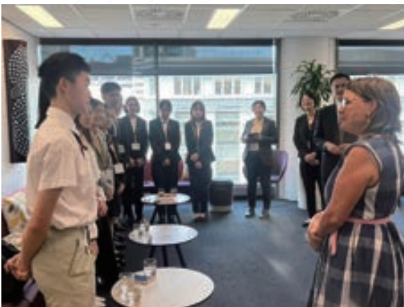
▲ 小尖兵們一一向威靈頓市副市長 Laurie Foon 自我介紹

隨後3天，小尖兵陸續造訪了威靈頓市政府、亞洲紐西蘭基金會 (Asia New Zealand Foundation)、紐西蘭環境部 (Ministry for the Environment)、紐西蘭國立博物館 (Te Papa Tongarewa Museum of New Zealand)、紐西蘭國際事務協會 (New Zealand Institute of International Affairs)、維塔電影特效工作室 (Weta Workshop) 及 Zealandia 生態保護區等單位，訪團成員透過拜訪，對於紐西蘭的原住民毛利文化、教育制度、影視環境及生態政策等有了更全面的認識。