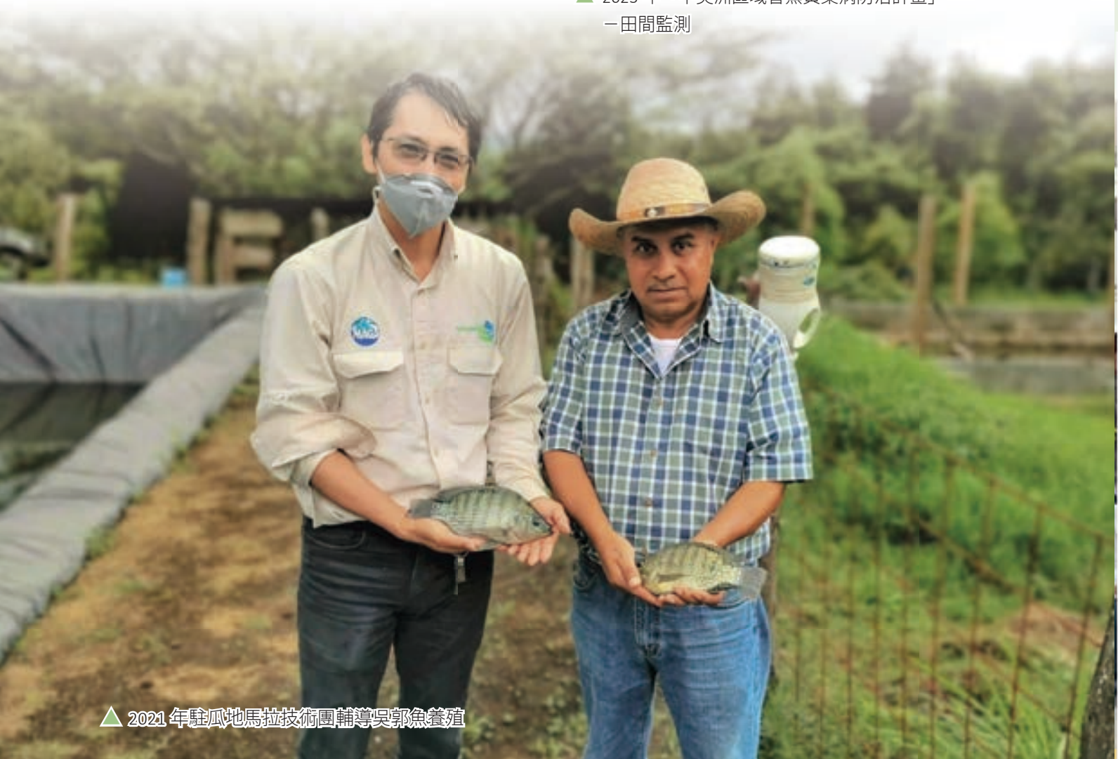
▲ 2021 年駐瓜地馬拉技術團輔導吳郭魚養殖