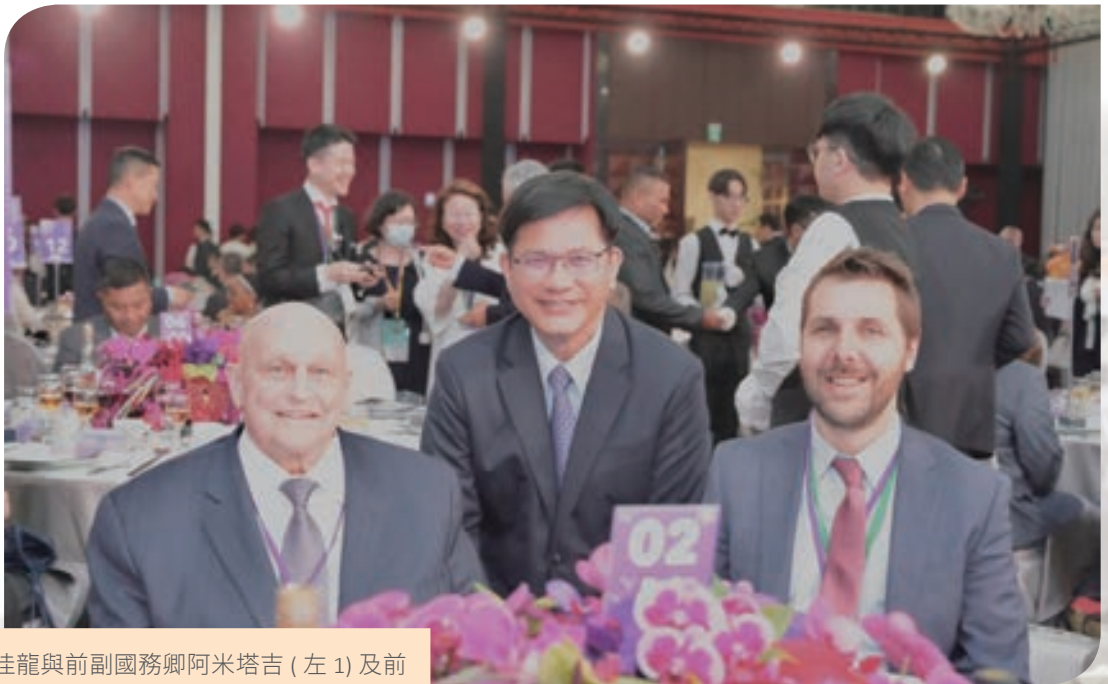
外交部長林佳龍與前副國務卿阿米塔吉 (左 1) 及前白宮國家經濟會議總監迪斯 (右 1) 合影