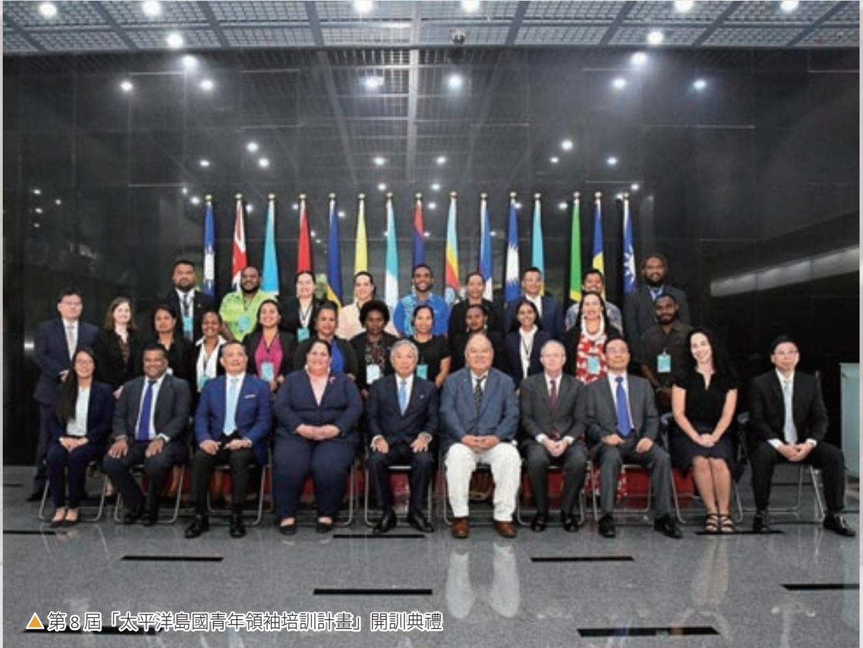
▲第8屆「太平洋島國青年領袖培訓計畫」開訓典禮