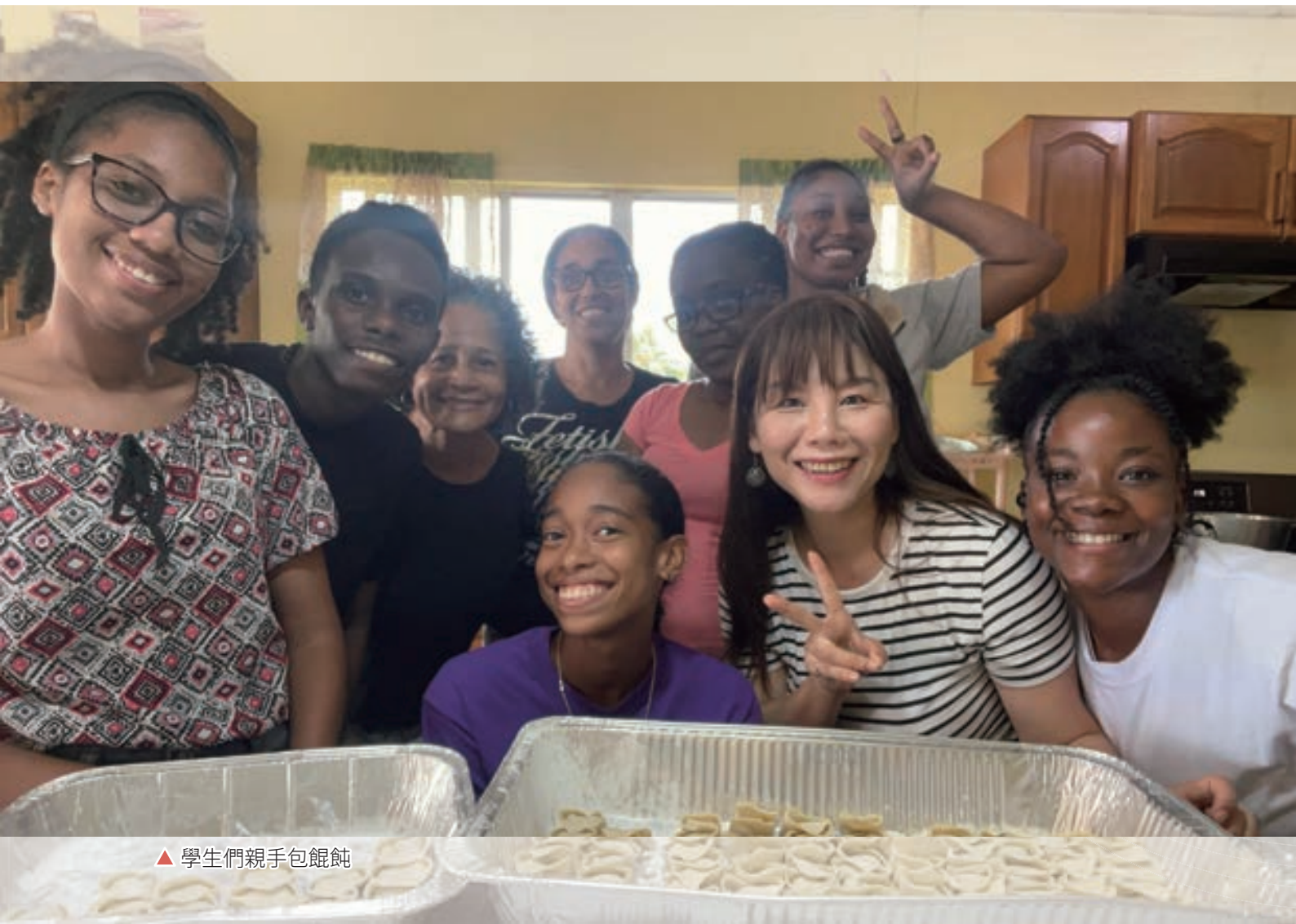
▲ 學生們親手包餛飩

加勒比海群島在歐洲國家擴張過程中，經歷了非洲、亞洲、東印度和歐洲移民的融合，產生了文化交融現象，稱為「克里奧爾化」(creolization)。這種多元文化背景使加勒比海國家在音樂等領域呈現多樣性。在克里奧爾化社會中，音樂繼承了西非傳統，尤其是「呼一應」(call and response) 唱法，後來發展成不拘泥於重複整句旋律。饒舌音樂起源於 1970 年代美國紐約布朗克斯，由加勒比海移民及當地非裔發展，內容多抨擊社會黑暗面。饒舌吸納了西非、加勒比海和美國文化，代表了移民的歷史。