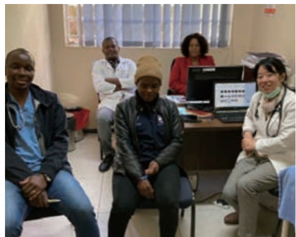
▲ 醫療團深耕醫學教育，並於教學門診中同時訓練數位當地醫護人員，從實際操作中學習。

神經內科算是醫學中偏難的科目，神經不像肌肉骨骼一樣，看不到也摸不到，十分抽象，需要牢記神經的解剖位置，並搭配特殊的病徵，方能診斷。因此，縱使勤學的醫學生或住院醫師熟讀教科書上的知識，若無人實際指導，依舊很難專精神經科疾病。