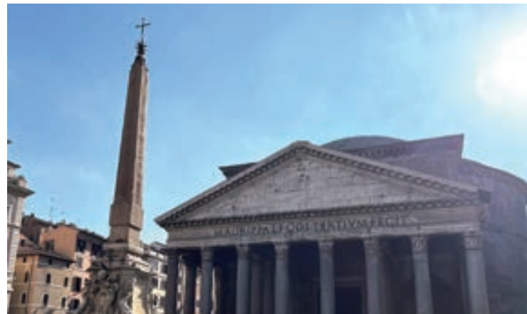
▲ 萬神殿前的埃及方尖碑

也許您會訝異，羅馬擁有埃及方尖碑甚至比故鄉埃及的現存量還多！這要回溯古羅馬帝國不斷向外征戰帶回戰利品的歷史淵源，以兩千年前的搬運工具與技術，竟然能以貨船將重達幾百噸的方尖碑，從尼羅河上游、再橫跨地中海運送到羅馬，所動用的人力、物力實在超乎想像。因篇幅所限，筆者略擇幾座位於羅馬城內頗具特色的方尖碑分享。