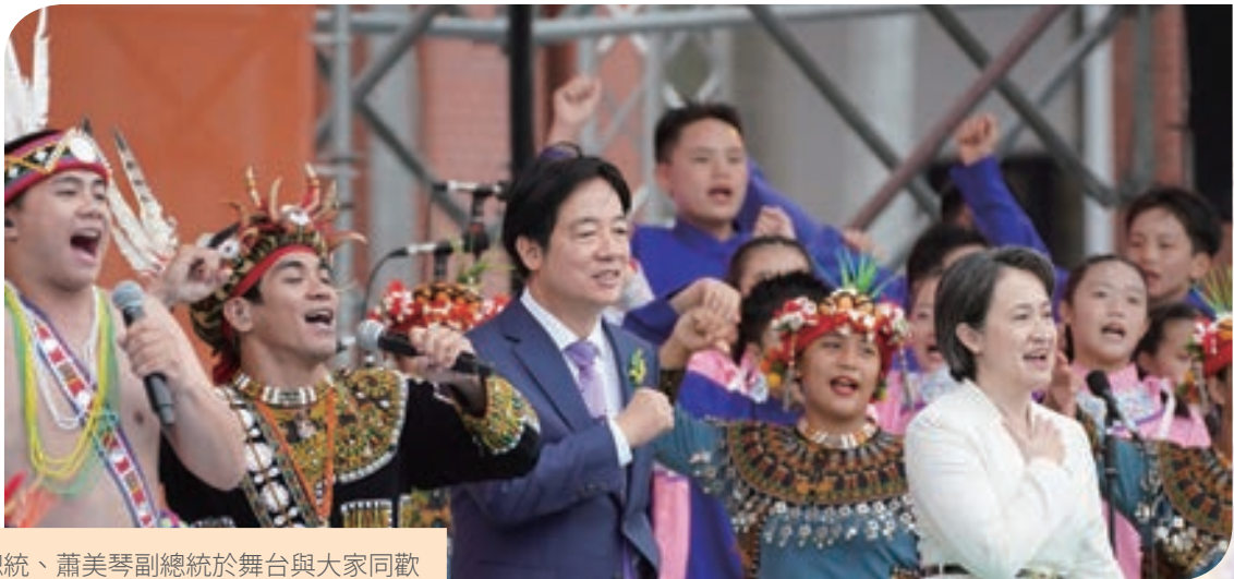
賴清德總統、蕭美琴副總統於舞台與大家同歡