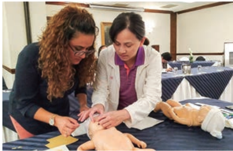
▲ 2021年「瓜地馬拉運用醫療科技提升孕產婦與新生兒保健功能計畫」－培訓瓜國醫事人員 (第一期)

台瓜技術合作務實踏實，從傳統農業走向科技結合農業、公衛與防災等廣泛領域，一直在思考如何提升合作的質量，駐瓜地馬拉大使館將與技術團，持續秉持最溫暖、熱情付出的台灣精神，協助瓜國人民提升生活福利，散播友誼的種子，也是台灣對瓜國挺身相助，跟始終不變情誼與承諾的展現。