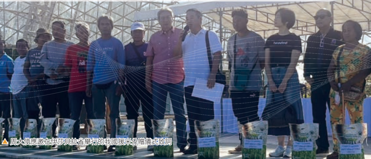
▲ 周大使應邀在伊莎貝拉省舉行的我國援米分贈儀式致詞