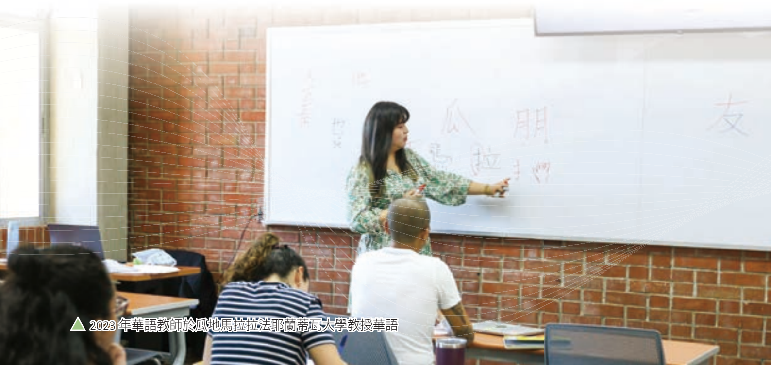
▲ 2023年華語教師於瓜地馬拉法耶蘭蒂瓦大學教授華語