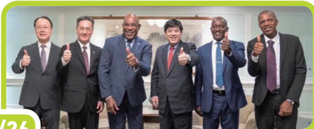
外交部長林佳龍歡迎聖克里斯多福及尼維斯聯邦總理德魯伉儷率團訪台