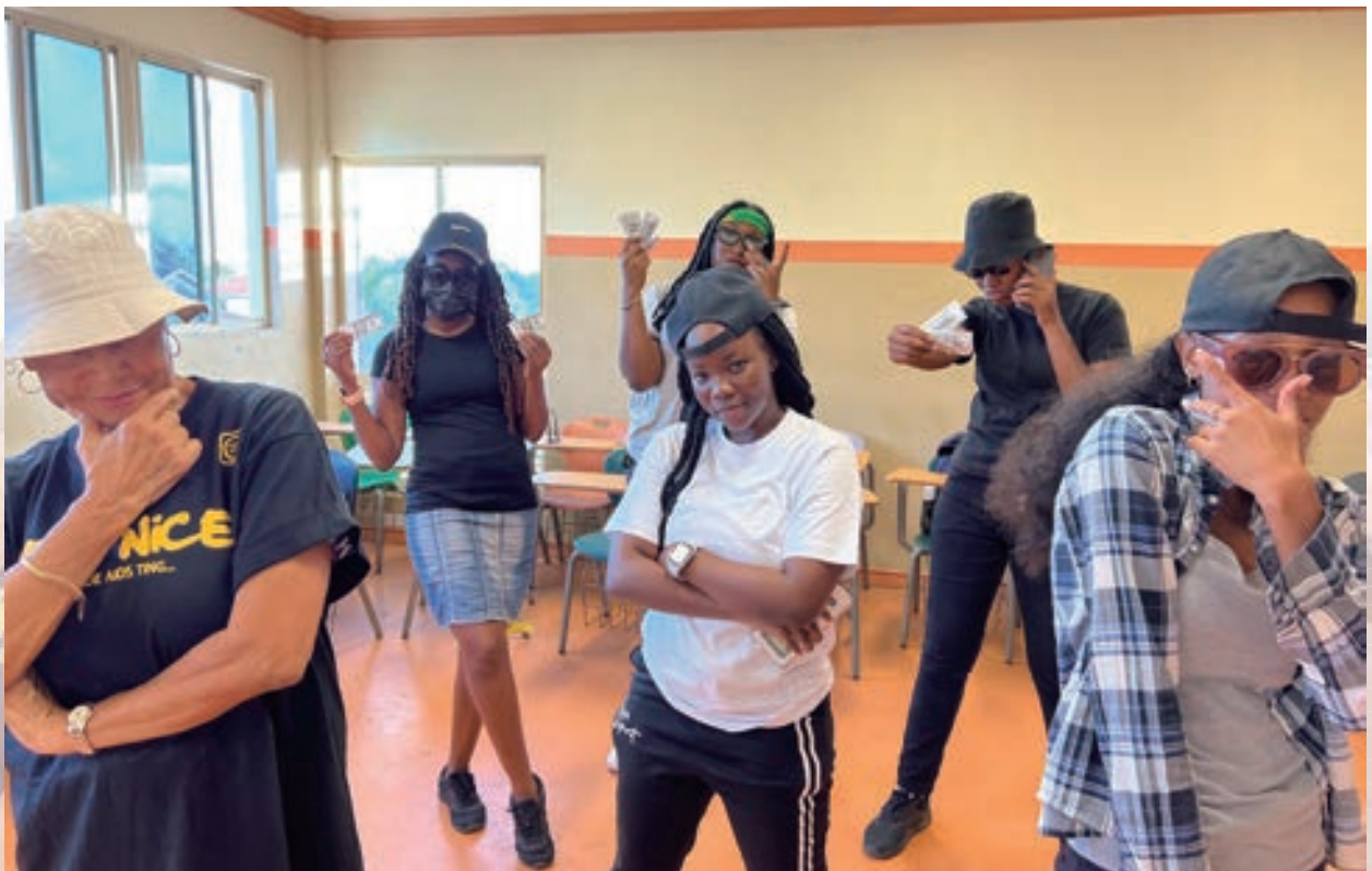
▲ 學生演唱饒舌創作，自備道具服裝。

學生低落的學習動機每每是教師授課最大的挑戰，因此，在上課過程中，如何激發學生的學習動力，進而提升學習成效，是在聖文森教授中文時亟待解決的問題。