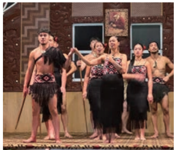
▲ Te Puia 毛利文化園區之毛利文化表演

訪團也參訪了市政府，並與該市擁有毛利身分的第一位女市長— Tania Tapsell 市長會面交流。她向大家介紹根據『懷唐伊條約』原則，毛利人擁有自決的權利，且與當時殖民者也維持著重要的夥伴關係。此城市不僅為毛利文化的重鎮，其參政的自由度也令人大開眼界。與市長交流後，小尖兵前往當地為青年所成立的非政府組織 (NGO) Taiohi Turama 青年中心，此 NGO 的創立宗旨是協助當地青年的日常生活及培養其專長，當地對於青年，尤其是對弱勢族群的重視及照顧，也使我國年輕學子們感受到更多的溫暖。