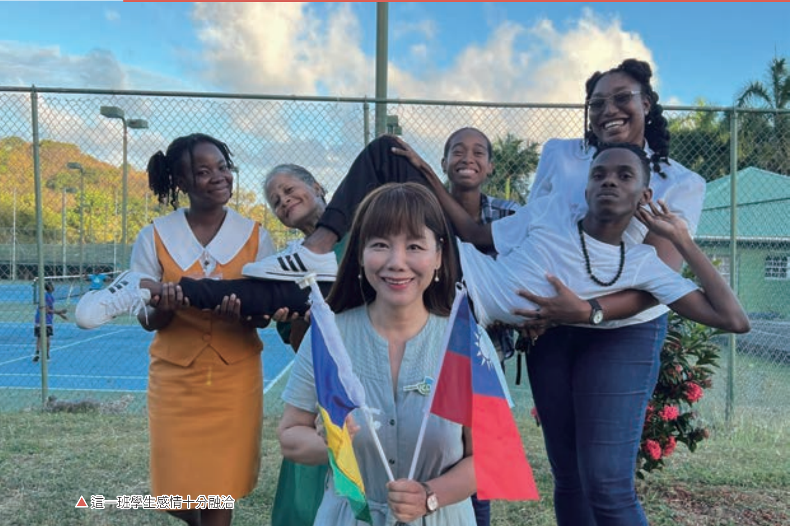
▲ 這一班學生感情十分融洽