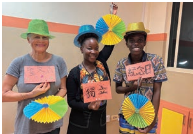
▲ 中文課慶祝聖文森獨立紀念日