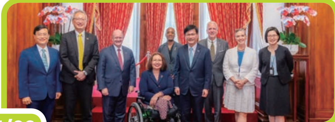
外交部長林佳龍歡迎美國聯邦眾議院外交委員會主席麥考爾跨黨派議員慶賀團訪台