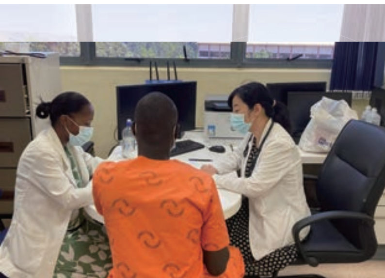
▲ 在嶄新的醫療大樓看診：此為台灣捐贈興建，設備新穎，視野遼闊，大大提升史國醫療水準。

病人可於神經內科接受高品質的藥物治療，若經判斷需開刀或侵入性治療，即可於同一天接受外科診治，快速安排手術，不需徒勞往返。神經外科病人於術後需神經內科協助調整藥物時，亦可即時獲得照護。如此一來，除大大增進病人就醫方便性外，也提供少見的高效率醫療，足見台灣對史國醫療提升的努力。