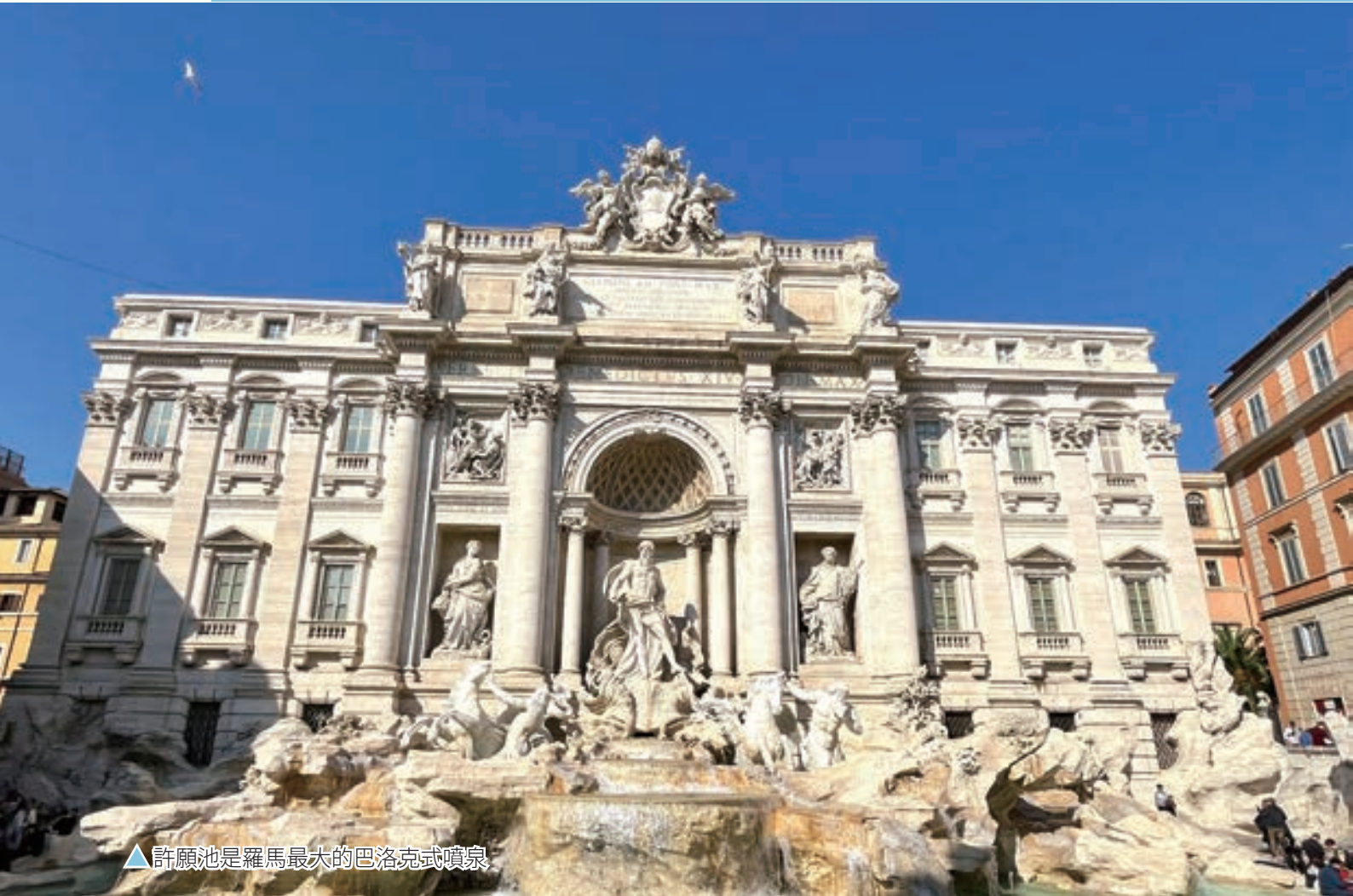
▲許願池是羅馬最大的巴洛克式噴泉