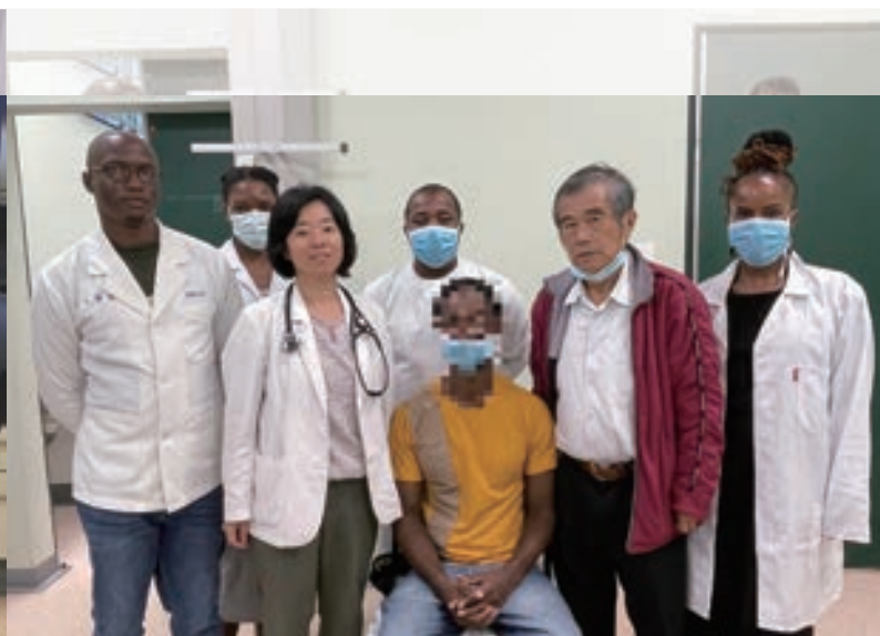
▲ 神經科團隊成功治癒癱瘓病人：此病人罹患罕見自體免疫腦炎，一度癱瘓臥床，絕望無助。經神經科團隊及時介入治療，恢復良好，重新回歸職場。