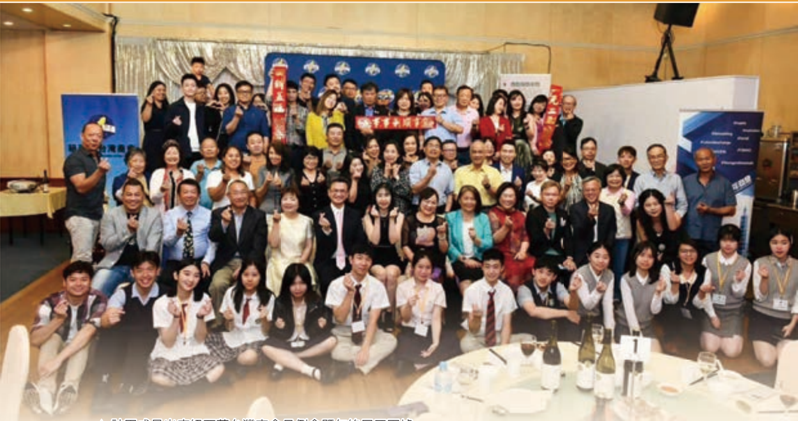
▲ 訪團成員出席紐西蘭台灣商會月例會暨年終尾牙圍爐

在羅托路亞市的最後一站來到了當地的天主教中學 John Paul College，學生們都十分熱情的與來自台灣的青年互動，除了邀請一同打球外，也積極介紹紐西蘭，活潑主動和友善的態度讓大家深刻感受到紐西蘭教育的獨特之處。這是小尖兵此行唯一真正進入紐澳高中校園的體驗，甚至獲邀進入教室與他國學生一同上課，雙方在好奇中建立了友誼。