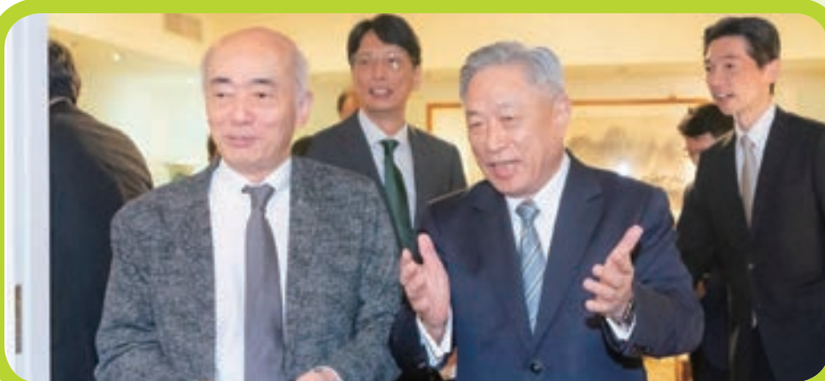
外交部長林佳龍歡迎美國聯邦參議員達克沃絲跨黨派重量級議員團