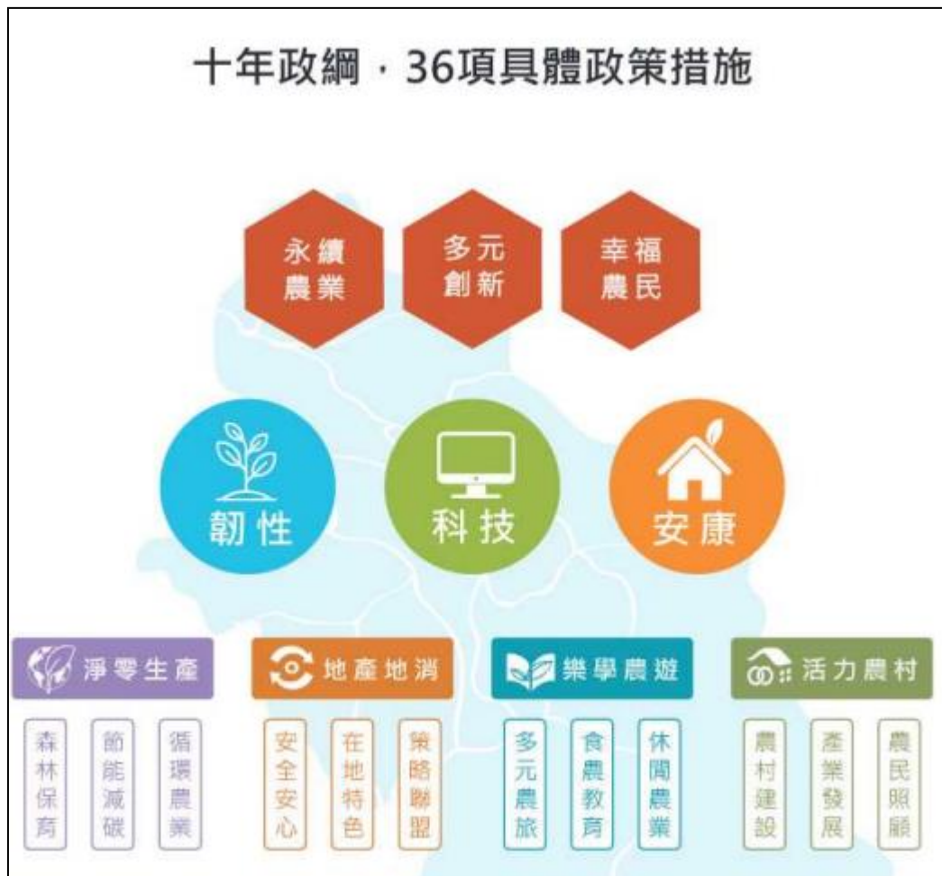
圖 3、新竹縣農業未來 10 年發展之具體措政策施