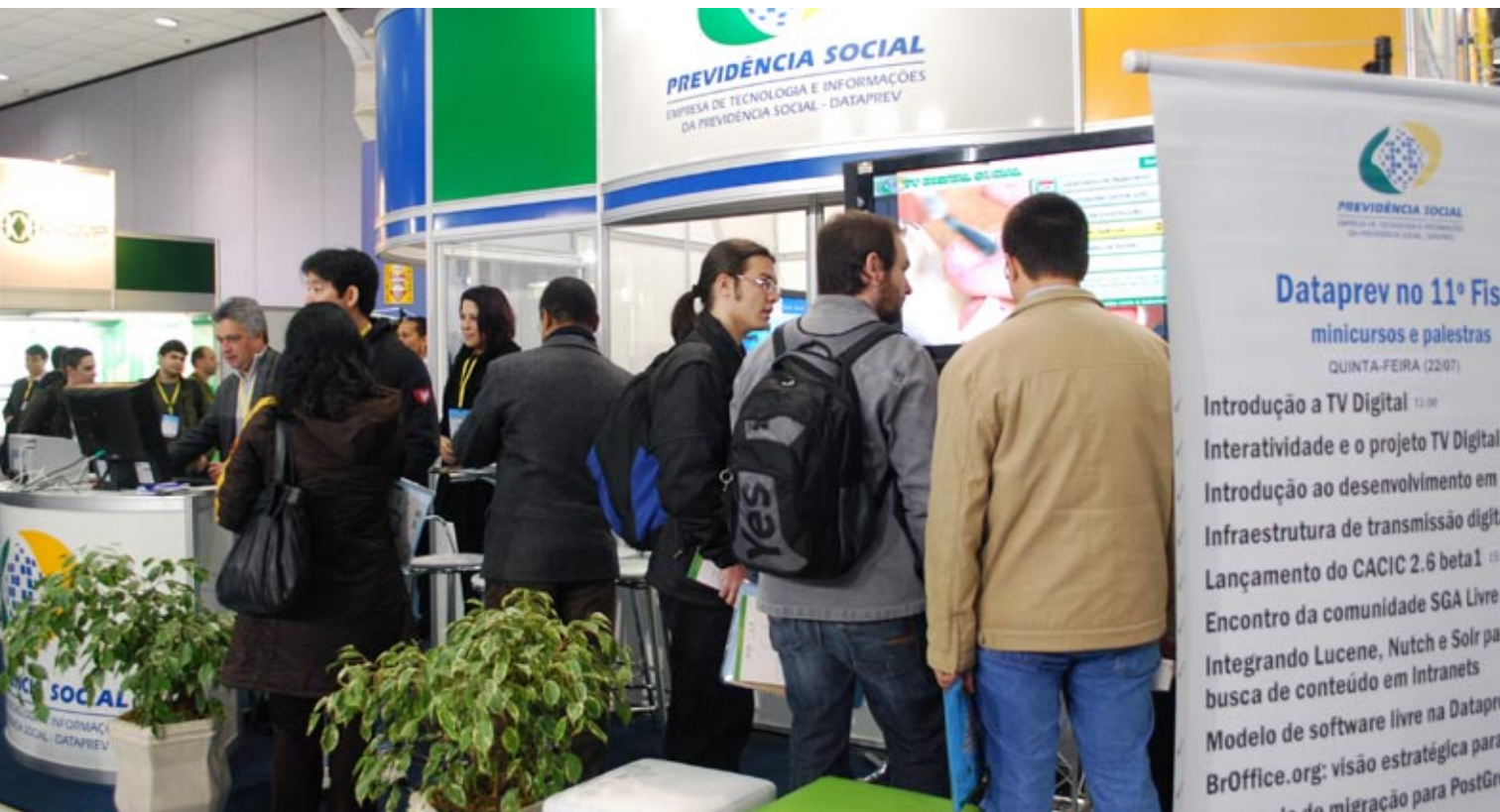
Estande da Dataprev no 11º Fisl, um dos mais visitados no evento, em julho de 2010 em Porto Alegre/RS