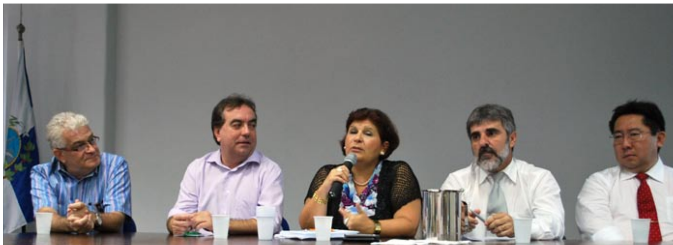
Reunião de apresentação do SGPe, em novembro de 2010.