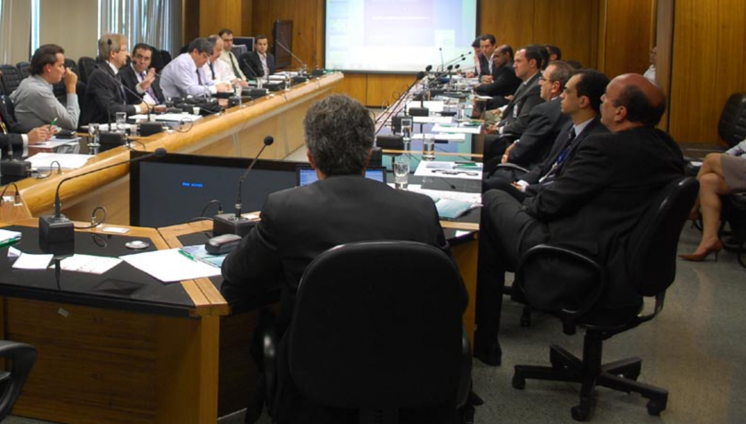
XX Fórum de TIC, com o tema “Ambientes de Produção”, realizado em novembro