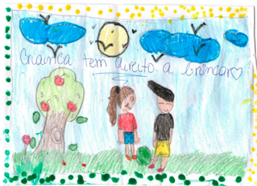
Myllena Leal Duarte 10 anos