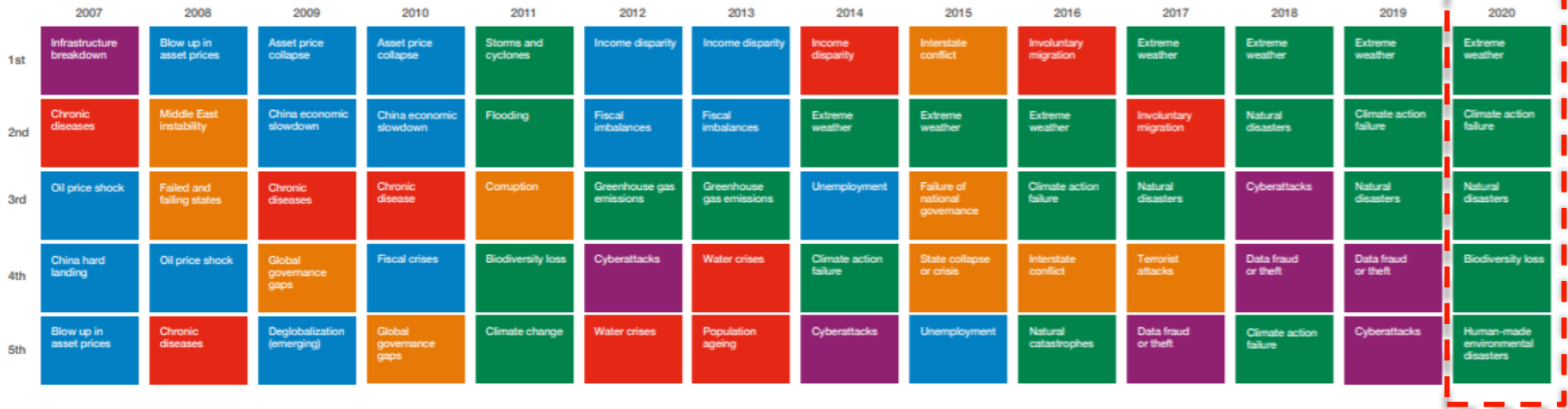
Top 5 Global Risks in Terms of Impact